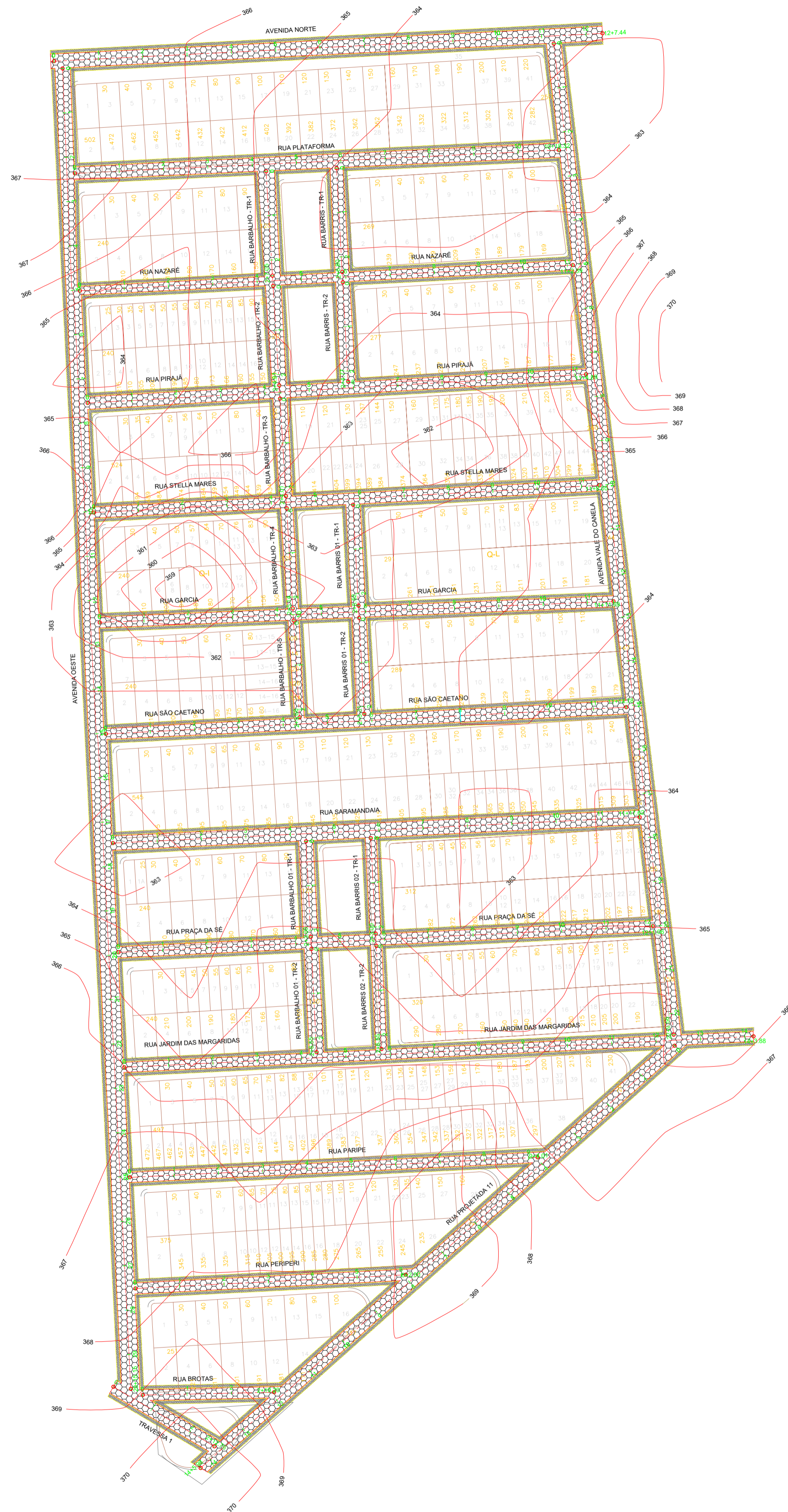
PLANALTIMÉTRICO ESCALA: 1/1000