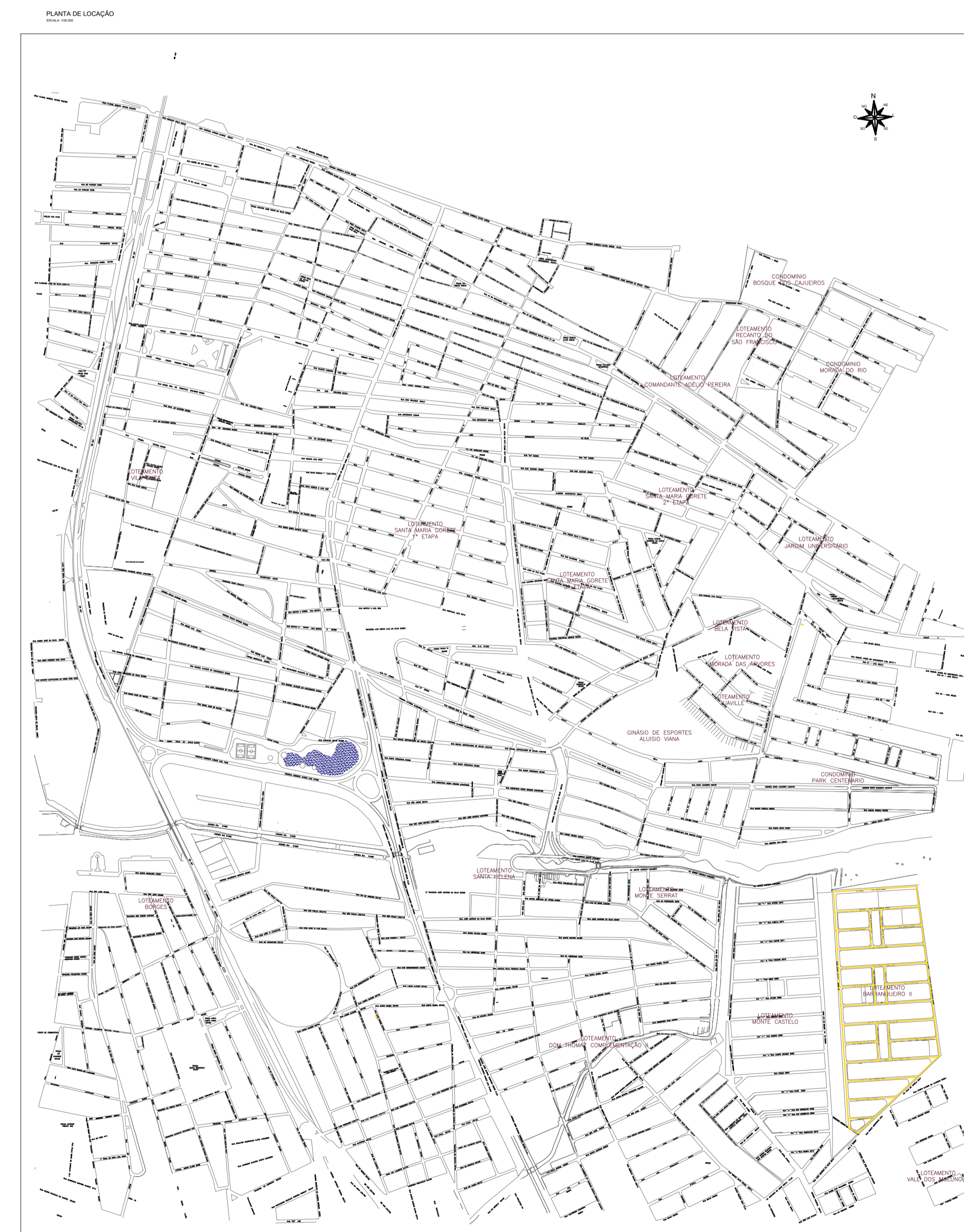
PLANTA DE SITUAÇÃO ESCALA: 1:200.000