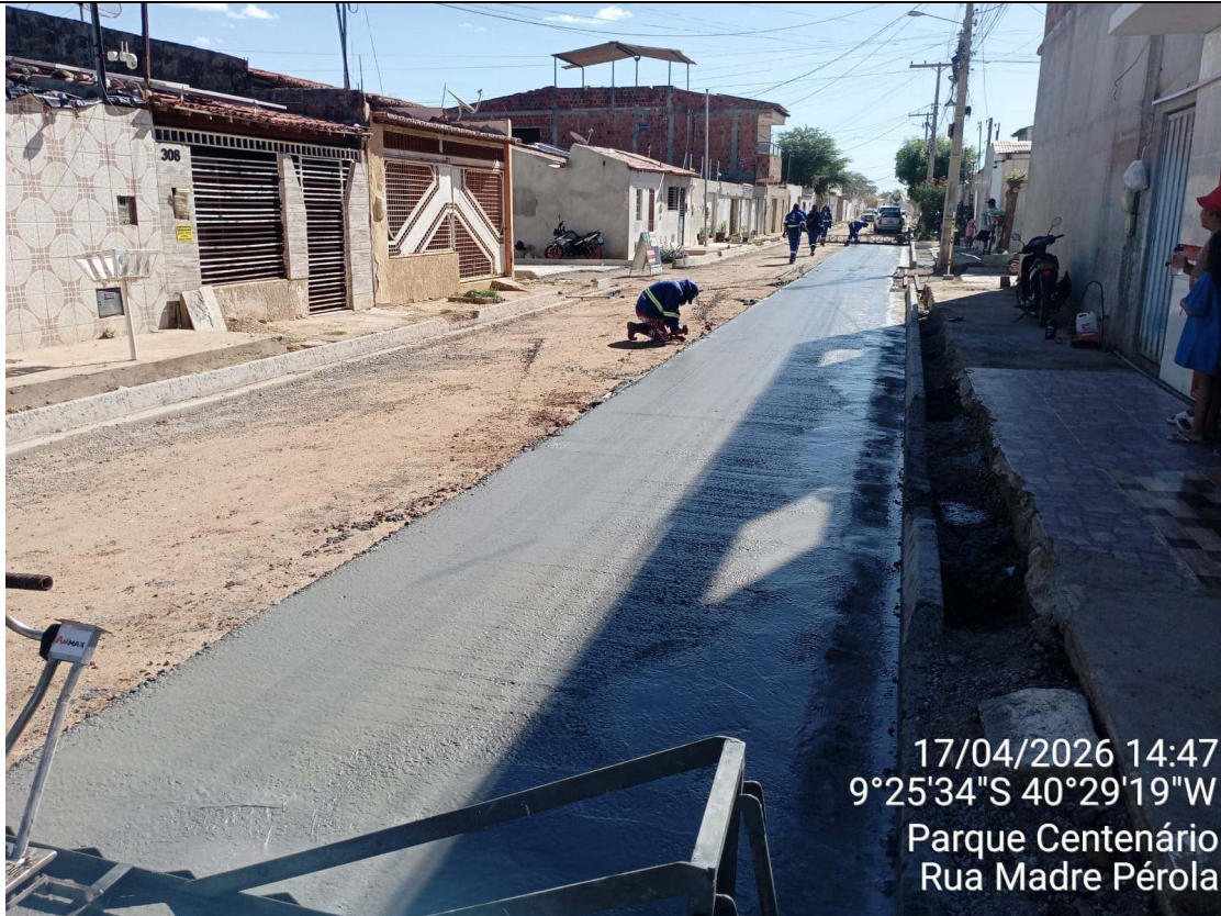
Foto 81: Execução de piso sextavado moldado in loco na Rua Madre Pérola.

CT-052/2025 – PAVIMENTAÇÃO DE VIAS EM CONCRETO USINADO POLIDO ESTAMPA-DO EM DIVERSOS LOGRADOUROS NO MUNICÍPIO DE JUAZEIRO - BAHIA.