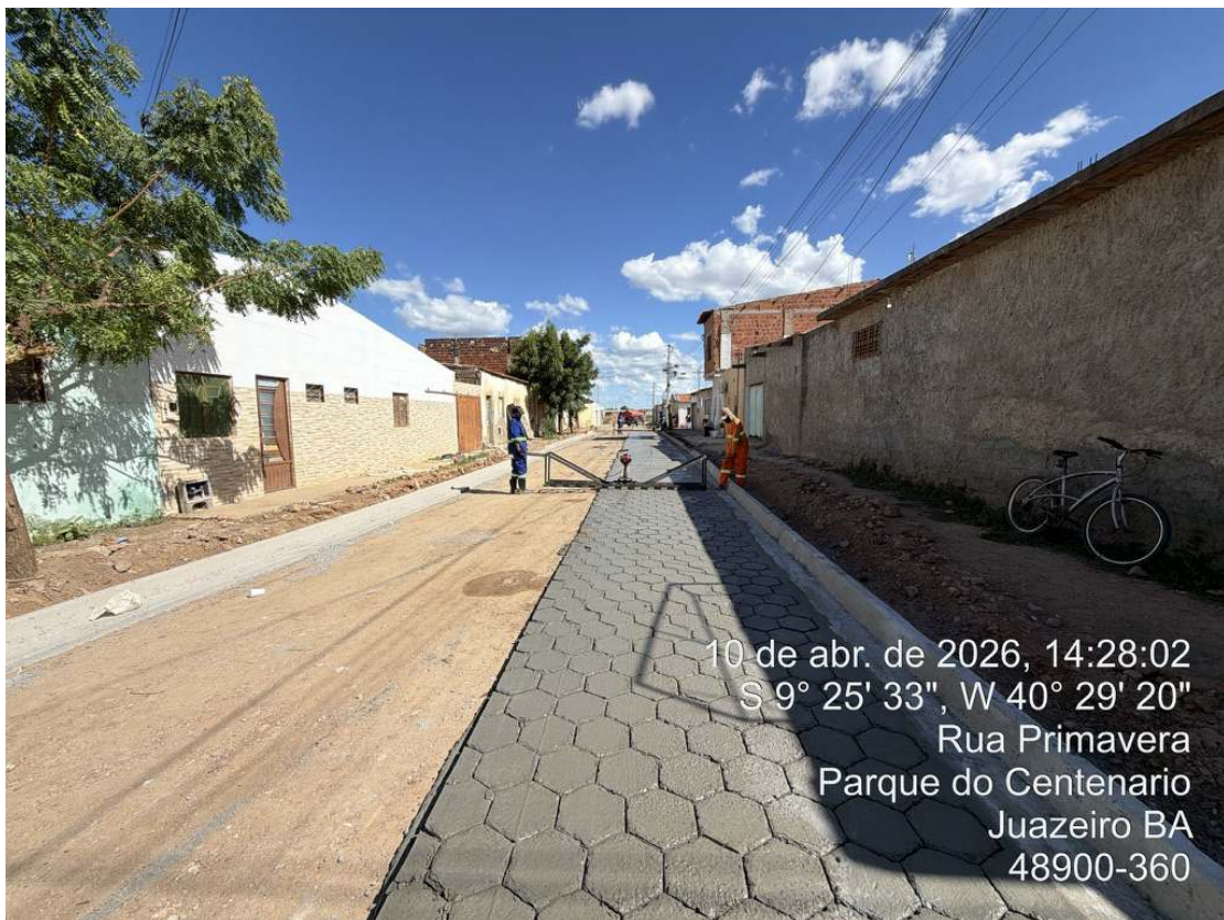
Foto 52: Execução de junta de dilatação em concreto moldado in loco.