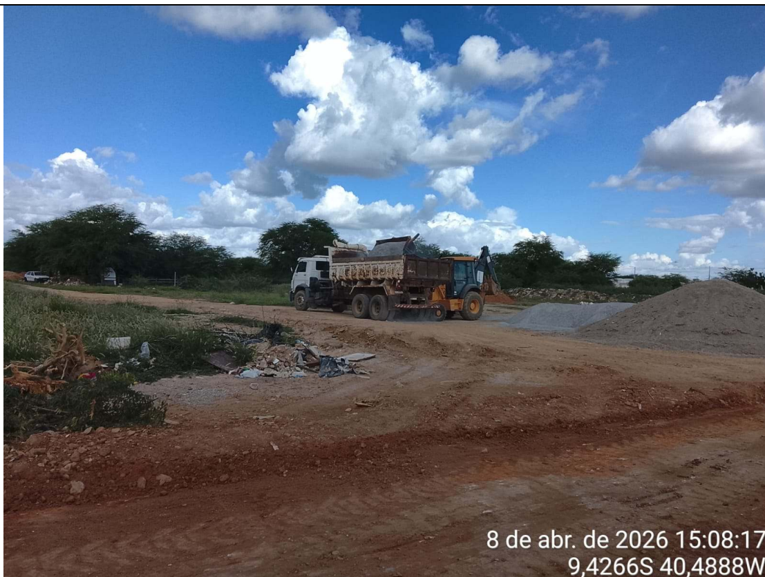
Foto 35: Carga de material para execução de solo brita na Rua Projetada 3.

CT-052/2025 – PAVIMENTAÇÃO DE VIAS EM CONCRETO USINADO POLIDO ESTAMPA-DO EM DIVERSOS LOGRADOUROS NO MUNICÍPIO DE JUAZEIRO - BAHIA.