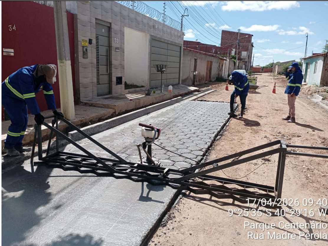
Foto 73: Execução de piso sextavado moldado in loco na Rua Madre Pérola.

CT-052/2025 – PAVIMENTAÇÃO DE VIAS EM CONCRETO USINADO POLIDO ESTAMPA-DO EM DIVERSOS LOGRADOUROS NO MUNICÍPIO DE JUAZEIRO - BAHIA.