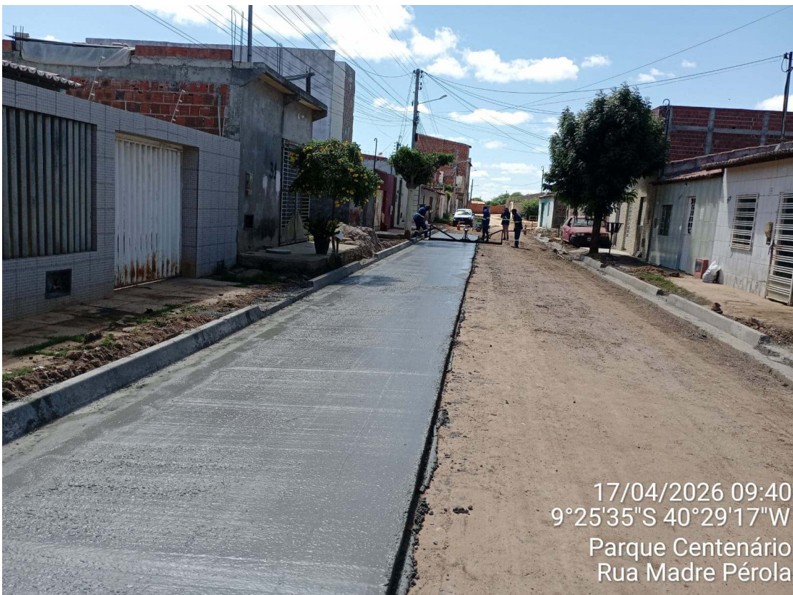
Foto 72: Execução de piso sextavado moldado in loco na Rua Madre Pérola.

Assinado por 2 pessoas: Patrick Fróis Andrade e TÉCIO MATUZALEN MARTINS FAUSTINO Para verificar a validade das assinaturas, acesse https://juazeiro.tdoc.com.br/verificacao/C15E-8D7F-9C4A-5083 e informe o código C15E-8D7F-9C4A-5083