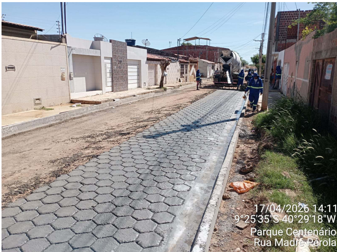
Foto 74: Execução de piso sextavado moldado in loco na Rua Madre Pérola.