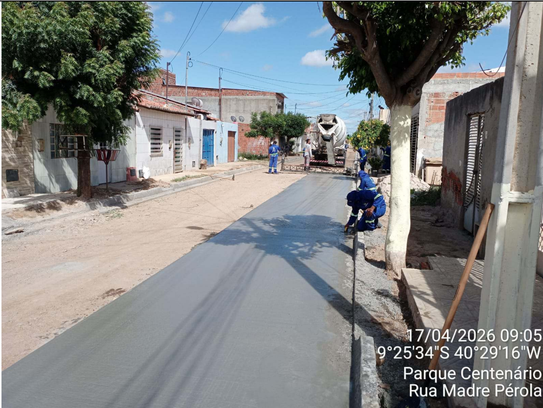
Foto 71: Execução de piso sextavado moldado in loco na Rua Madre Pérola.

CT-052/2025 – PAVIMENTAÇÃO DE VIAS EM CONCRETO USINADO POLIDO ESTAMPA-DO EM DIVERSOS LOGRADOUROS NO MUNICÍPIO DE JUAZEIRO - BAHIA.