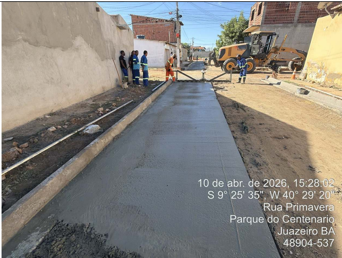
Foto 49: Execução de junta de dilatação em concreto moldado in loco.

CT-052/2025 – PAVIMENTAÇÃO DE VIAS EM CONCRETO USINADO POLIDO ESTAMPA-DO EM DIVERSOS LOGRADOUROS NO MUNICÍPIO DE JUAZEIRO - BAHIA.