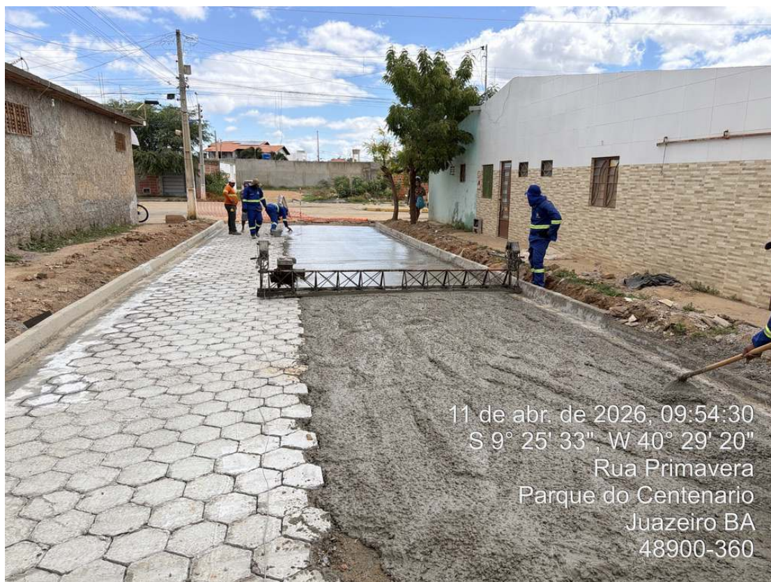
Foto 48: Adensamento com régua vibratória de concreto moldado in loco.

Assinado por 2 pessoas: Patrick Fróis Andrade e TÉCIO MATUZALEN MARTINS FAUSTINO Para verificar a validade das assinaturas, acesse https://juazeiro.tdoc.com.br/verificacao/CT15E-8D7F-9C4A-5083 e informe o código CT15E-8D7F-9C4A-5083