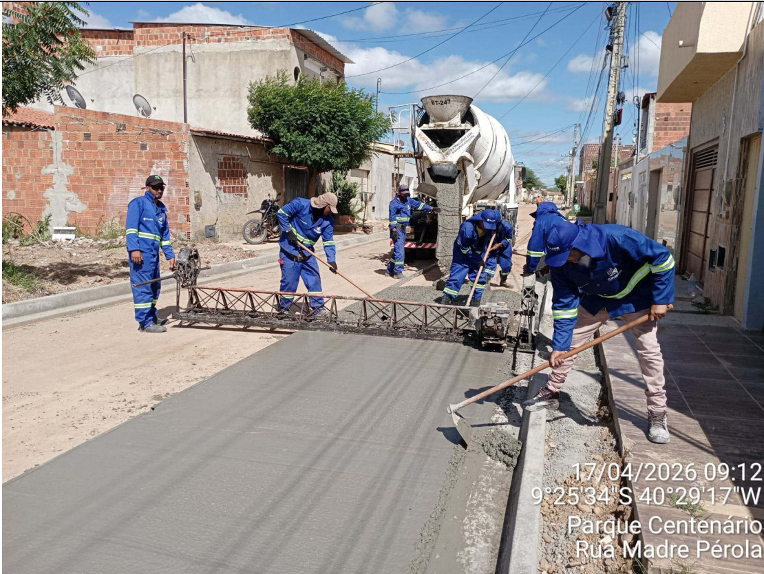
Foto 75: Execução de piso sextavado moldado in loco na Rua Madre Pérola.

CT-052/2025 – PAVIMENTAÇÃO DE VIAS EM CONCRETO USINADO POLIDO ESTAMPA-DO EM DIVERSOS LOGRADOUROS NO MUNICÍPIO DE JUAZEIRO - BAHIA.