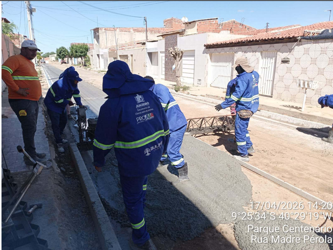
Foto 77: Execução de piso sextavado moldado in loco na Rua Madre Pérola.

CT-052/2025 – PAVIMENTAÇÃO DE VIAS EM CONCRETO USINADO POLIDO ESTAMPA-DO EM DIVERSOS LOGRADOUROS NO MUNICÍPIO DE JUAZEIRO - BAHIA.