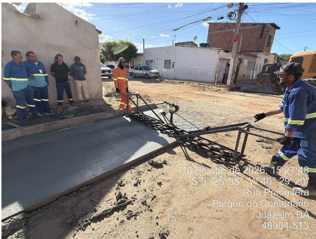
Foto 50: Execução de junta de dilatação em concreto moldado in loco.

Assinado por 2 pessoas: Patrick Fróis Andrade e TÉCIO MATUZALEN MARTINS FAUSTINO Para verificar a validade das assinaturas, acesse https://juazeiro.tdoc.com.br/verificacao/CT15E-8D7F-9C4A-5083 e informe o código CT15E-8D7F-9C4A-5083