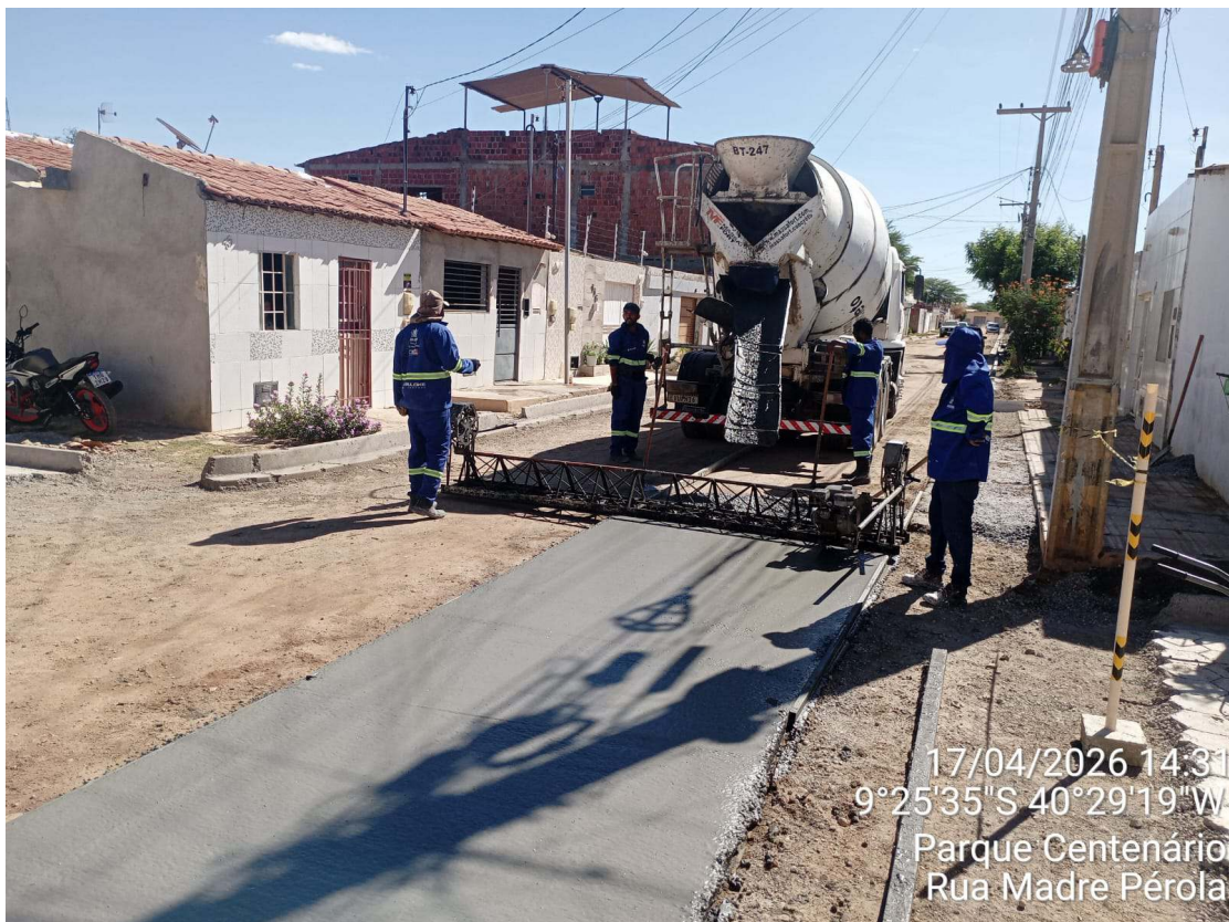
Foto 78: Execução de piso sextavado moldado in loco na Rua Madre Pérola.