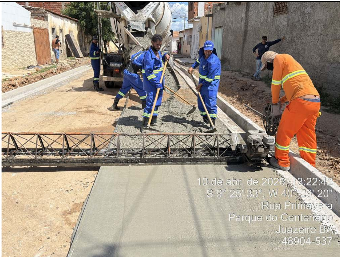
Foto 53: Adensamento com régua vibratória de concreto moldado in loco

CT-052/2025 – PAVIMENTAÇÃO DE VIAS EM CONCRETO USINADO POLIDO ESTAMPA-DO EM DIVERSOS LOGRADOUROS NO MUNICÍPIO DE JUAZEIRO - BAHIA.