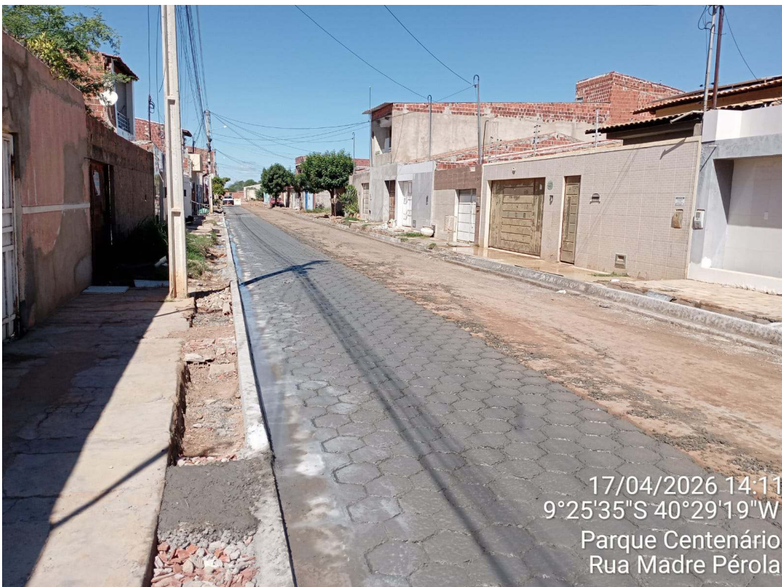
Foto 76: Execução de piso sextavado moldado in loco na Rua Madre Pérola.

Assinado por 2 pessoas: Patrick Fróis Andrade e TÉCIO MATUZALEN MARTINS FAUSTINO Para verificar a validade das assinaturas, acesse https://juazeiro.tdoc.com.br/verificacao/C15E-8D7F-9C4A-5083 e informe o código C15E-8D7F-9C4A-5083