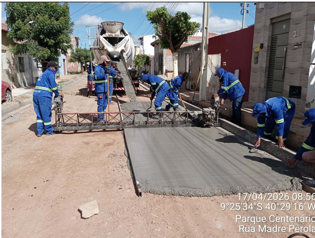
Foto 69: Execução de piso sextavado moldado in loco na Rua Madre Pérola.

CT-052/2025 – PAVIMENTAÇÃO DE VIAS EM CONCRETO USINADO POLIDO ESTAMPA-DO EM DIVERSOS LOGRADOUROS NO MUNICÍPIO DE JUAZEIRO - BAHIA.