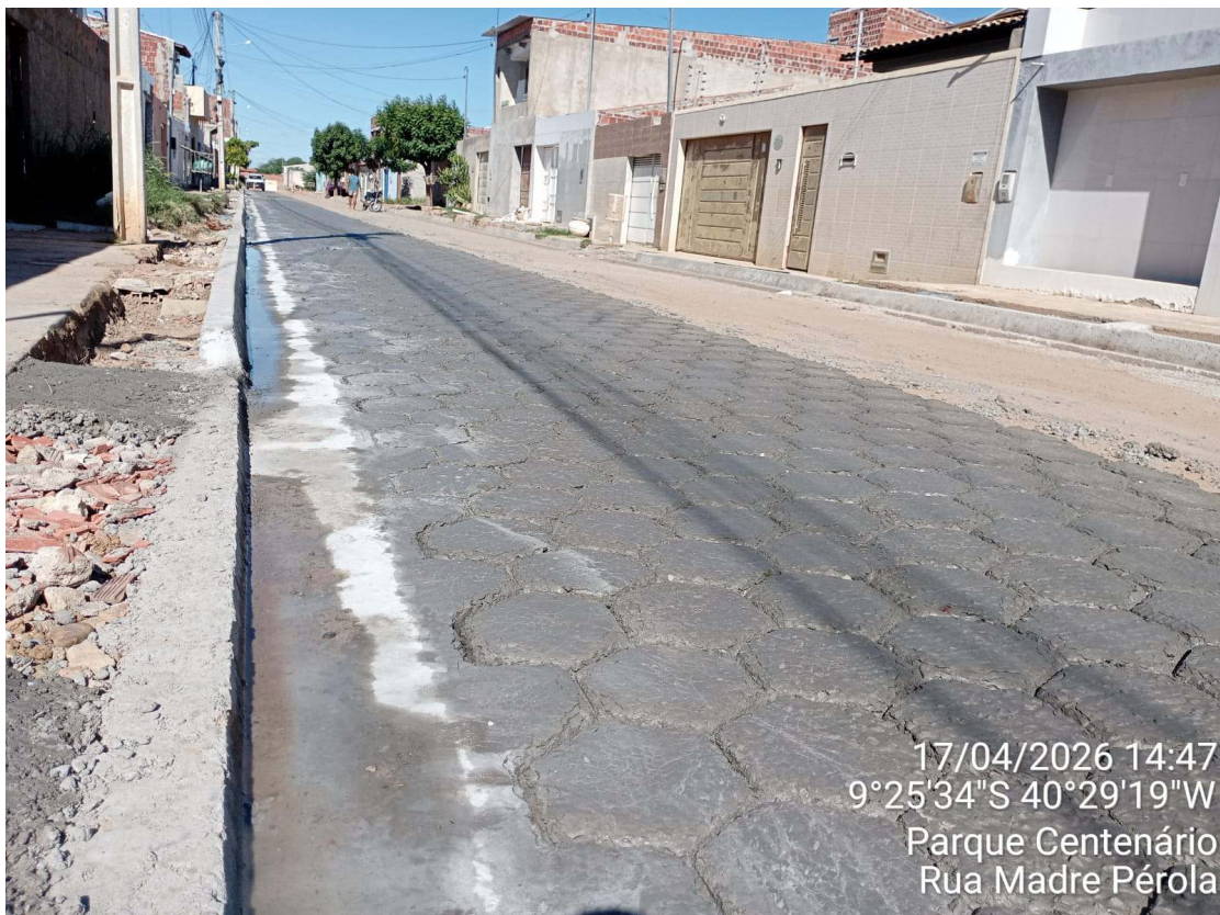
Foto 80: Execução de piso sextavado moldado in loco na Rua Madre Pérola.

Assinado por 2 pessoas: Patrick Fróis Andrade e TÉCIO MATUZALEN MARTINS FAUSTINO Para verificar a validade das assinaturas, acesse https://juazeiro.tdoc.com.br/verificacao/C15E-8D7F-9C4A-5083 e informe o código C15E-8D7F-9C4A-5083