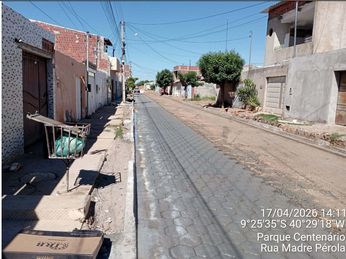
Foto 79: Execução de piso sextavado moldado in loco na Rua Madre Pérola.

CT-052/2025 – PAVIMENTAÇÃO DE VIAS EM CONCRETO USINADO POLIDO ESTAMPA-DO EM DIVERSOS LOGRADOUROS NO MUNICÍPIO DE JUAZEIRO - BAHIA.