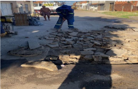
RUA SÃO JOÃO - MAN. PAVIMENTO ASFÁLTICO