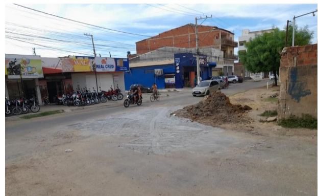
AV SÃO JOAO - MAN PAV ASFÁLTICO