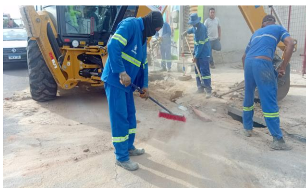
PRAÇA PEDRO PRIMO - BOTA FORA DE ENTULHO NA VIA