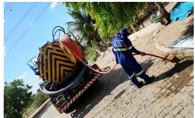
PRAIA DO RODEADOURO - SEWERJET