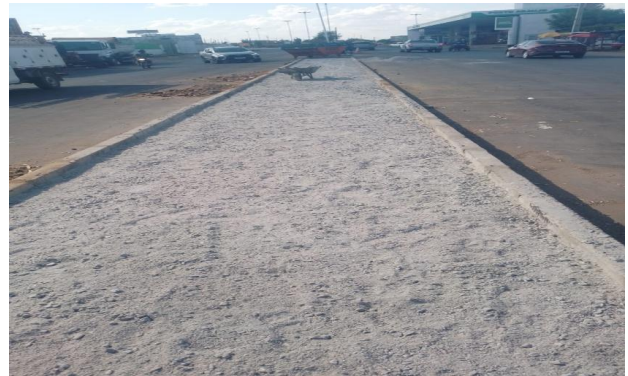
CEASA - BRITA GRADUADA SIMPLES