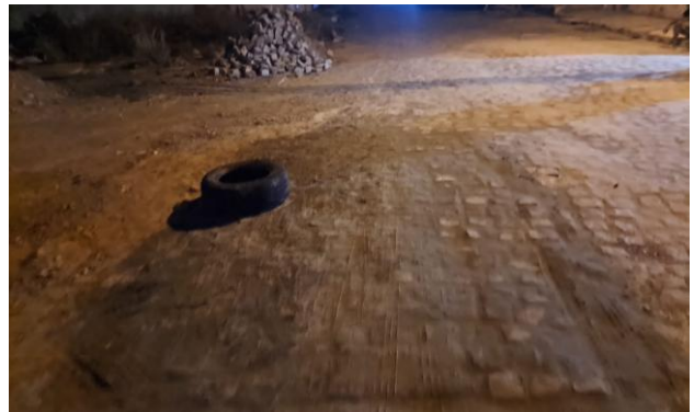
MANUTENÇÃO PAVIMENTO PARALELEPÍPEDO