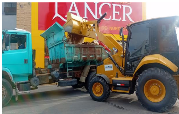
PRAÇA PEDRO PRIMO - BOTA FORA DE ENTULHO NA VIA