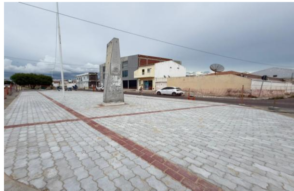
AV LUIS INÁCIO - INTERTRAVADO