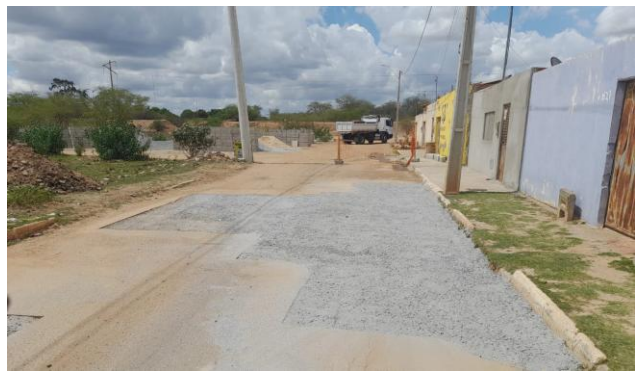
AV EDESIO SANTOS - BRITA GRADUADA SIMPLES