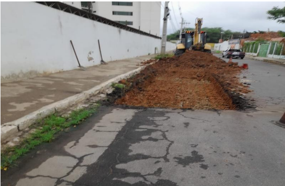
AV CARMELA DUTRA - ESCAVAÇÃO MECANIZADA