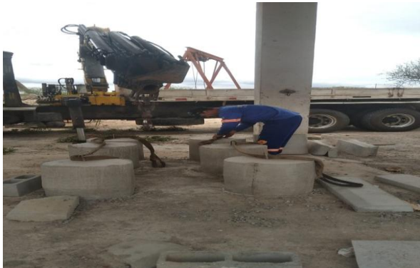
FORNECIMENTO DE MUNCK