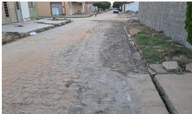
MANUTENÇÃO PAVIMENTO PARALELEPÍPEDO