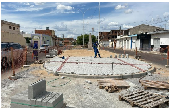
AV LUIS INÁCIO - INTERTRAVADO