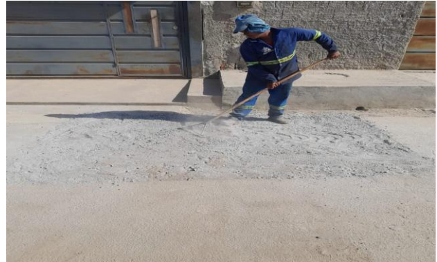
RUA SÃO JOÃO - MAN. PAVIMENTO ASFÁLTICO