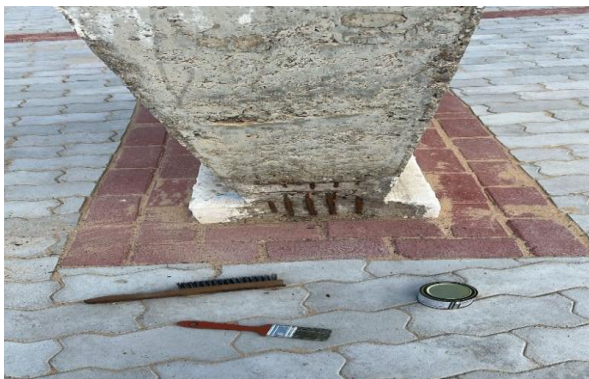
AV LUIS INÁCIO - CONCRETO ARMADO