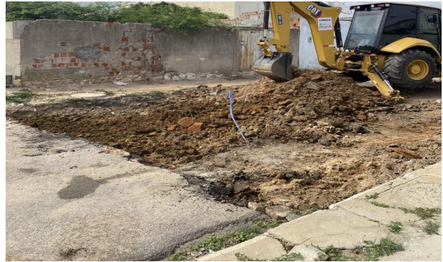
RUA SÃO FRANCISCO - ESCAVAÇÃO MECANIZADA