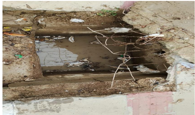
RUA G - DESOBSTRUÇÃO DE CAIXA