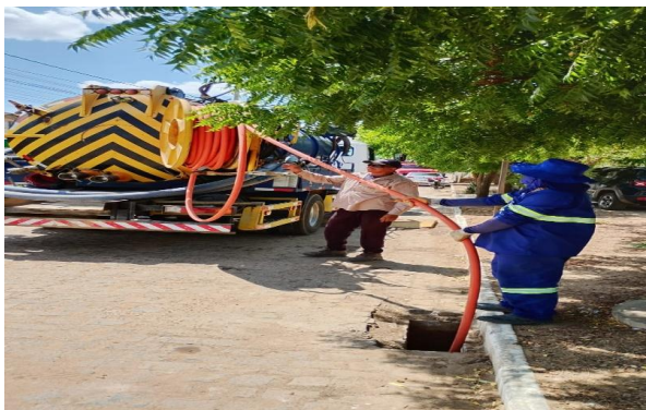
PRAIA DO RODEADOURO - SEWERJET