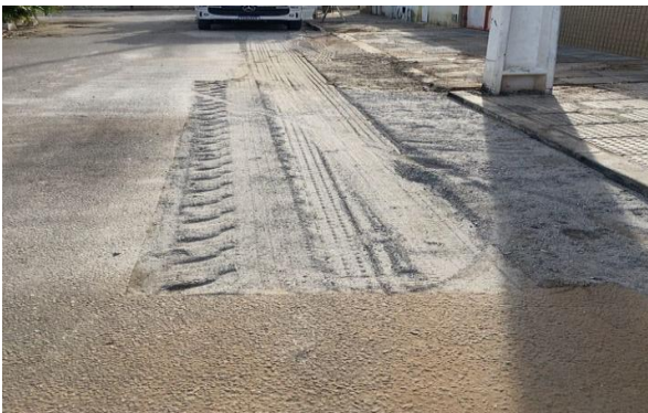
RUA DOM ÁVILA - BRITA GRADUADA SIMPLES