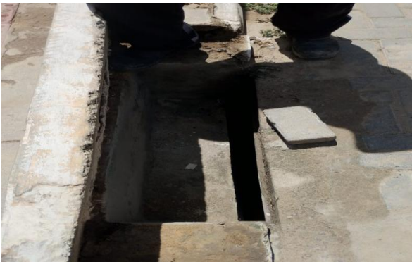
RUA G - DESOBSTRUÇÃO DE CAIXA