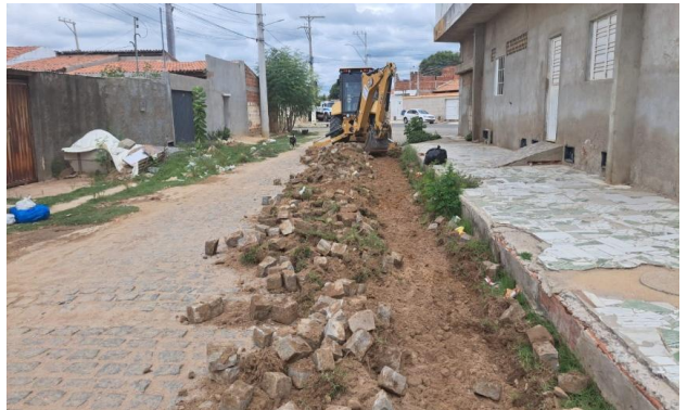
MANUTENÇÃO PAVIMENTO PARALELEPÍPEDO