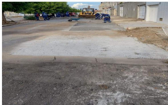
RUA DOM ÁVILA - BRITA GRADUADA SIMPLES