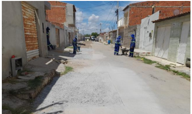
RUA SÃO FRANCISCO - BRITA GRADUADA SIMPLES