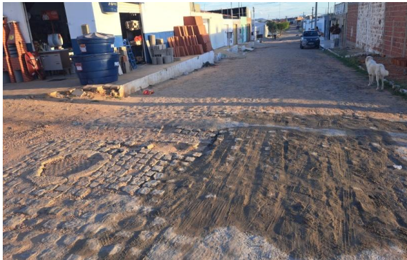
MANUTENÇÃO PAVIMENTO PARALELEPÍPEDO