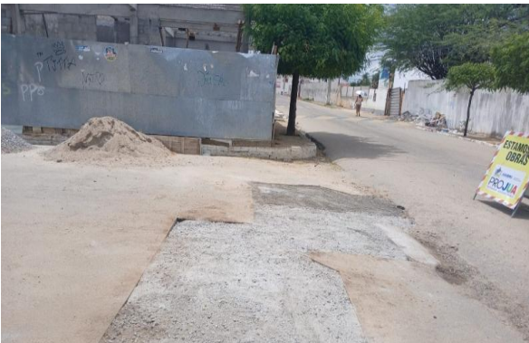
RUA DOM ÁVILA - BRITA GRADUADA SIMPLES