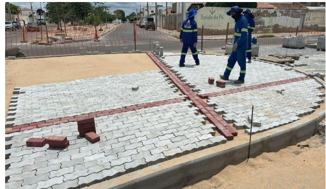
AV LUIS INÁCIO - INTERTRAVADO