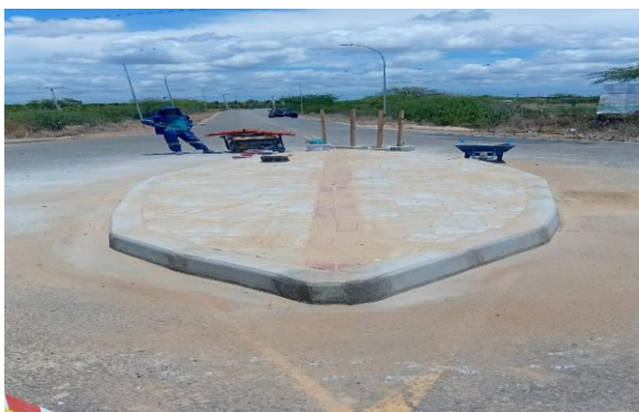
MANDACARU - INTERTRAVADO