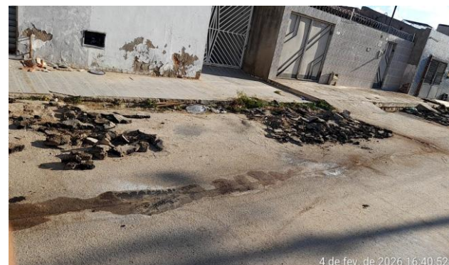
RUA SÃO JOÃO - MAN. PAVIMENTO ASFÁLTICO