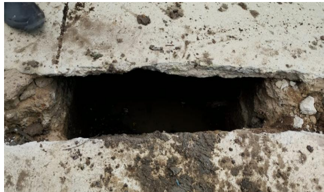
PRAIA DO RODEADOURO - DESOBSTRUÇÃO DE CAIXA