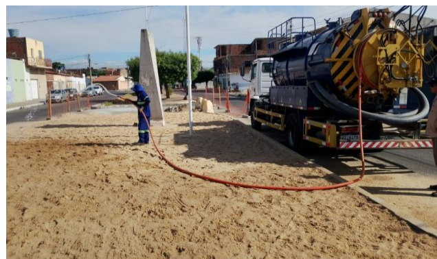
AV LUIS INÁCIO - ADENSAMENTO COM ÁGUA