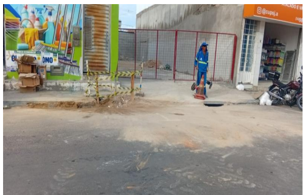
PRAÇA PEDRO PRIMO - BOTA FORA DE ENTULHO NA VIA