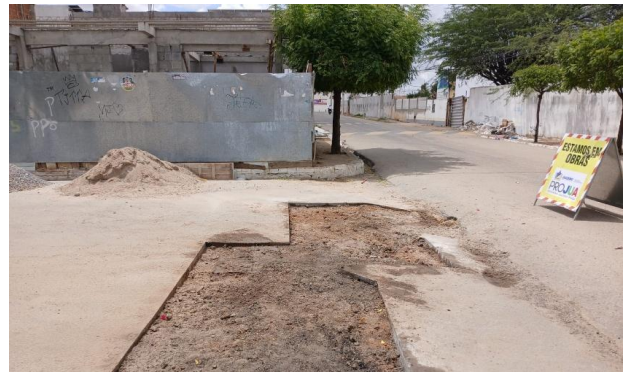
RUA DOM ÁVILA - MAN. PAVIMENTO ASFÁLTICO