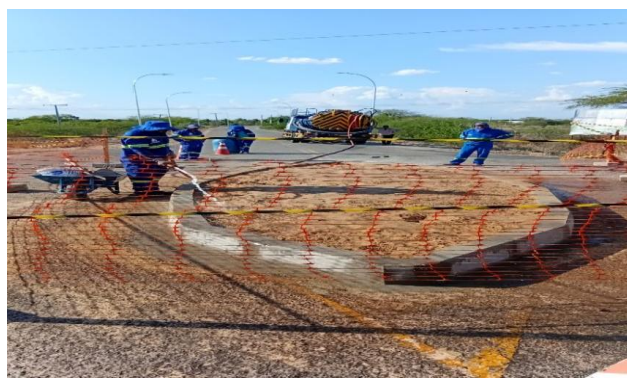
MANDACARU - ATERRO COM AREIA