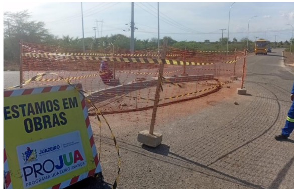
MANDACARU - ASSENTAMENTO DE MEIO FIO