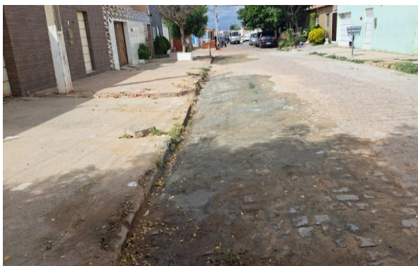
MANUTENÇÃO PAVIMENTO PARALELEPÍPEDO