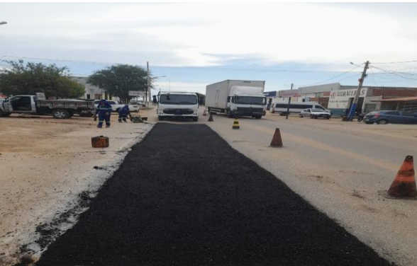
AV GIUSSEP MUCINI - MAN PAV ASFÁLTICO