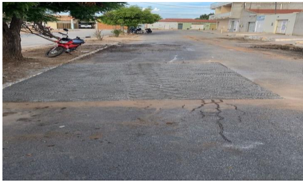
RUA DOM ÁVILA - BRITA GRADUADA SIMPLES