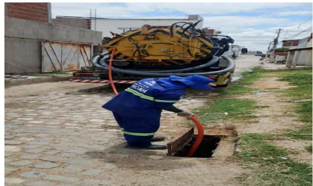
RUA M - SEWERJET