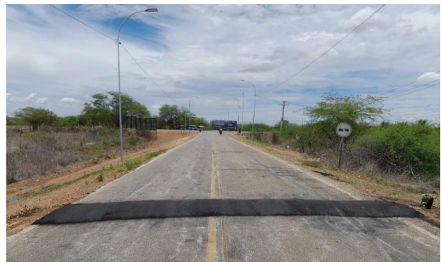
MANDACARU - MANUTENÇÃO PAV ASFÁLTICO