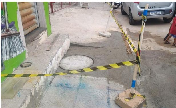
PRAÇA PEDRO PRIMO - ISOLAMENTO DE ÁREA