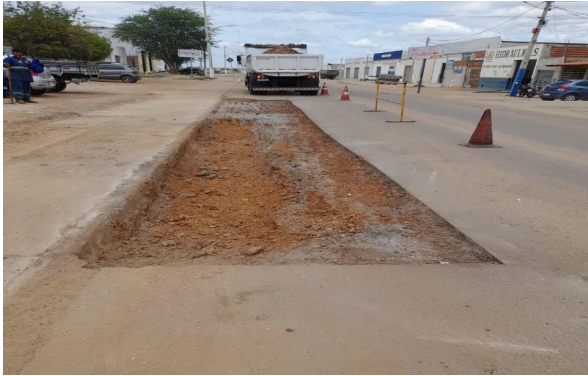
AV GIUSSEP MUCINI - MAN PAV ASFÁLTICO