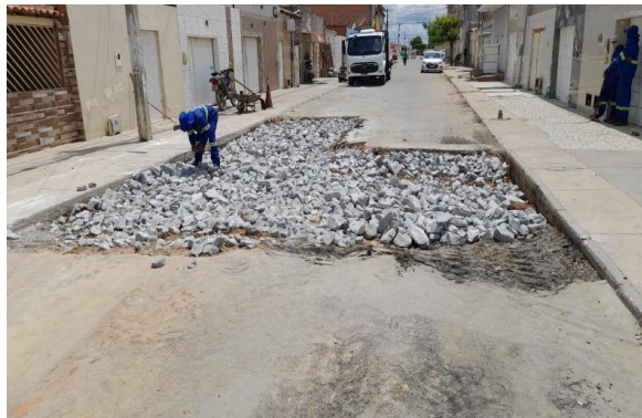
RUA BENTO GONÇALVES - REFORÇO SUB LEITO