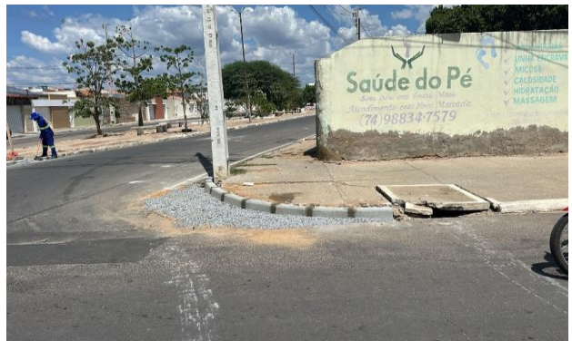
AV LUIS INÁCIO - ASSENTAMENTO DE MEIO FIO