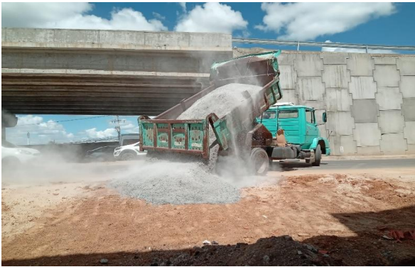
AV DUARTE CARNEIRO - BRITA GRADUADA SIMPLES