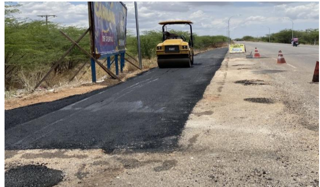
MANDACARU - MANUTENÇÃO PAV ASFÁLTICO