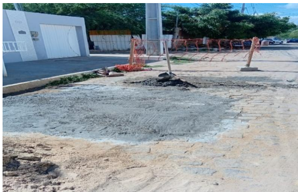
MANUTENÇÃO PAVIMENTO PARALELEPÍPEDO