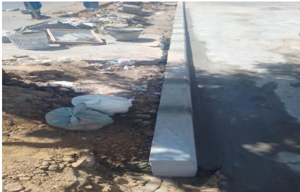
CEASA - ASSENTAMENTO DE MEIO FIO