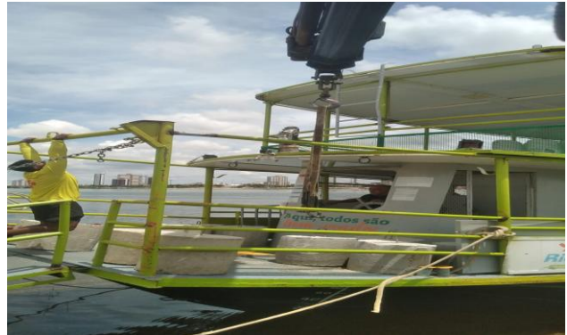
FORNECIMENTO DE MUNCK