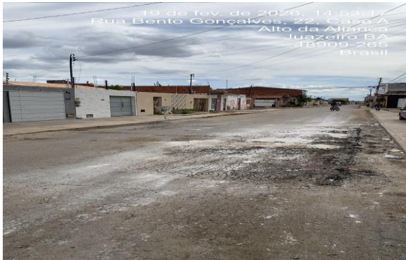
RUA BENTO GONÇALVES - MAN. PAV ASFÁLTICO