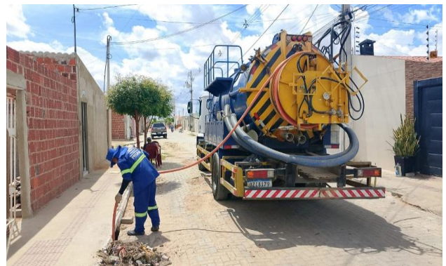
RUA A - SEWERJET