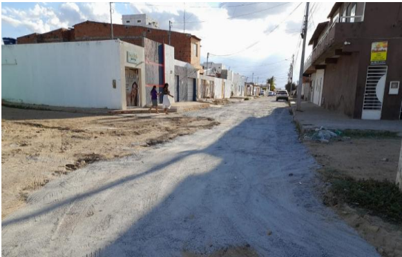
AV AMÉRICO TANURY - BRITA GRADUADA SIMPLES