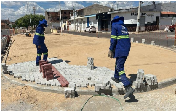
AV LUIS INÁCIO - INTERTRAVADO