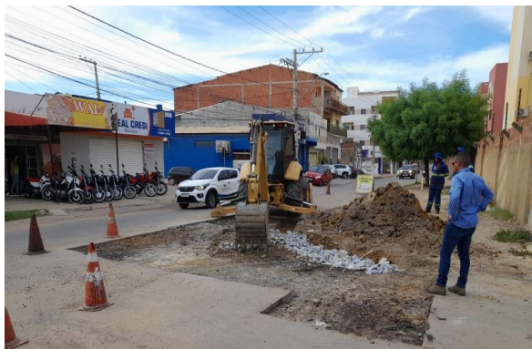
AV SÃO JOAO - MAN PAV ASFÁLTICO