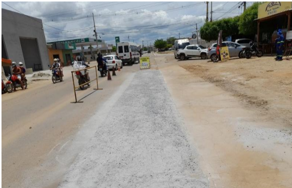
AV GIUSSEP MUCINI - MAN PAV ASFÁLTICO