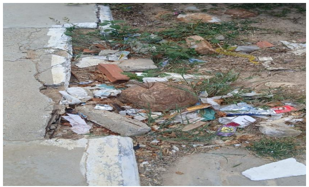
RUA E - DESOBSTRUÇÃO DE CAIXA