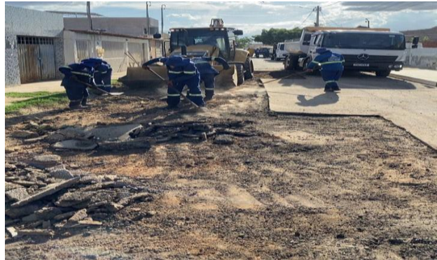
RUA SÃO JOÃO - MAN. PAVIMENTO ASFÁLTICO