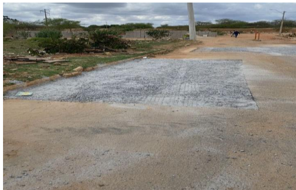
AV EDESIO SANTOS - BRITA GRADUADA SIMPLES