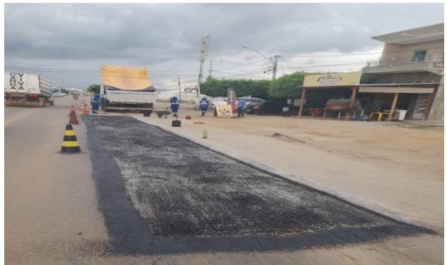
AV GIUSSEP MUCINI - MAN PAV ASFÁLTICO