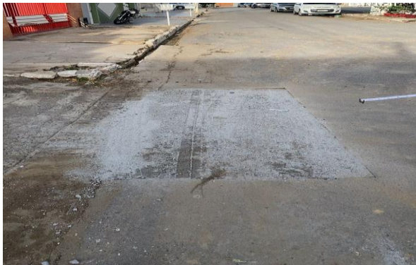
RUA DOM ÁVILA - BRITA GRADUADA SIMPLES