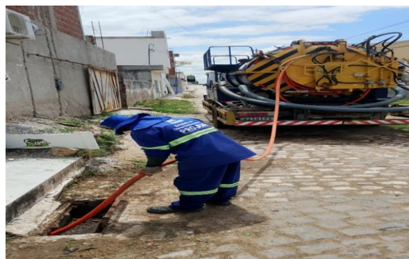
RUA M - SEWERJET