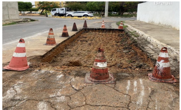
AV CARMELA DUTRA - ISOLAMENTO DE ÁREA