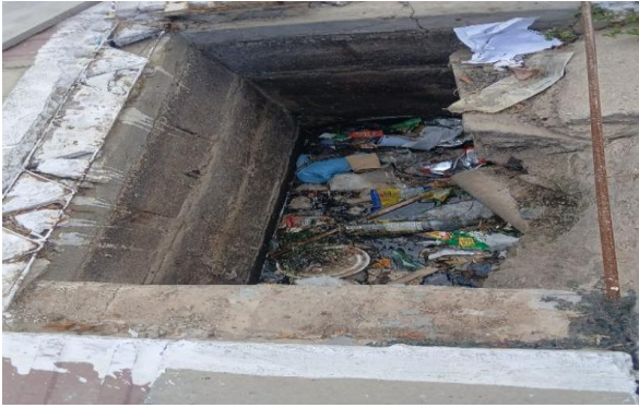
RUA E - DESOBSTRUÇÃO DE CAIXA