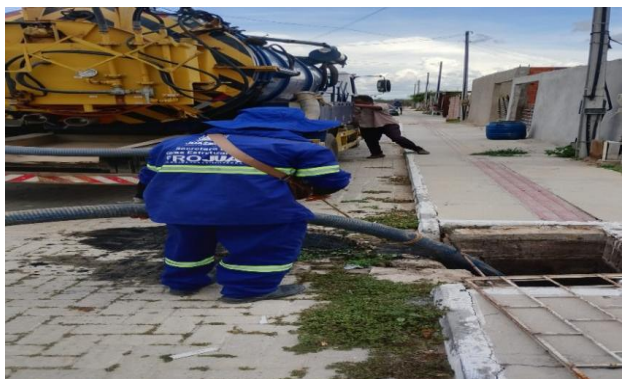
RUA E - SEWERJET