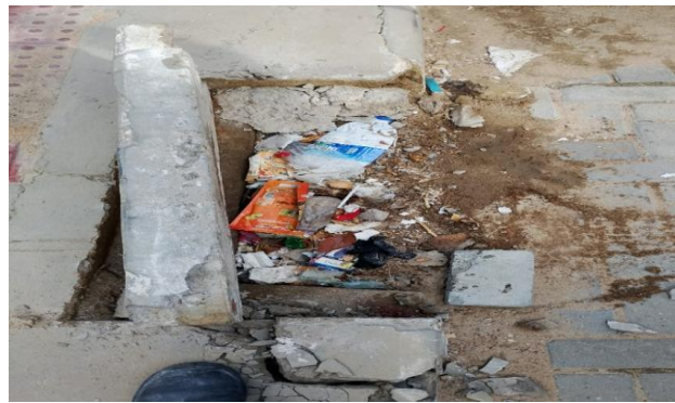
RUA F - DESOBSTRUÇÃO DE CAIXA