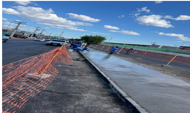
CEASA - CONCRETO USINADO