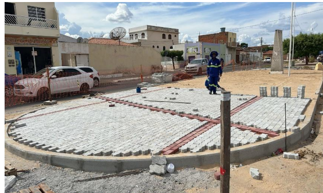
AV LUIS INÁCIO - INTERTRAVADO