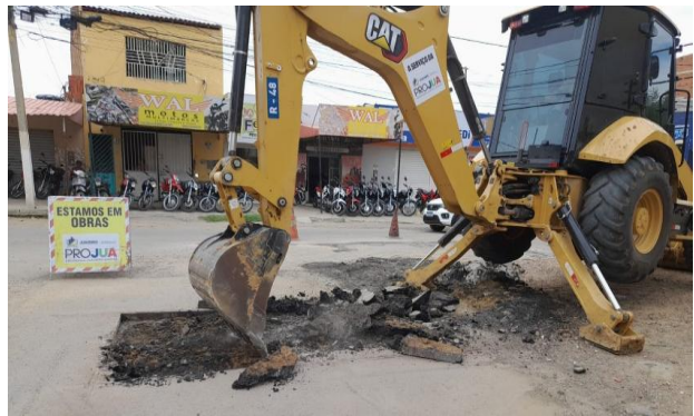
AV SÃO JOAO - MAN PAV ASFÁLTICO