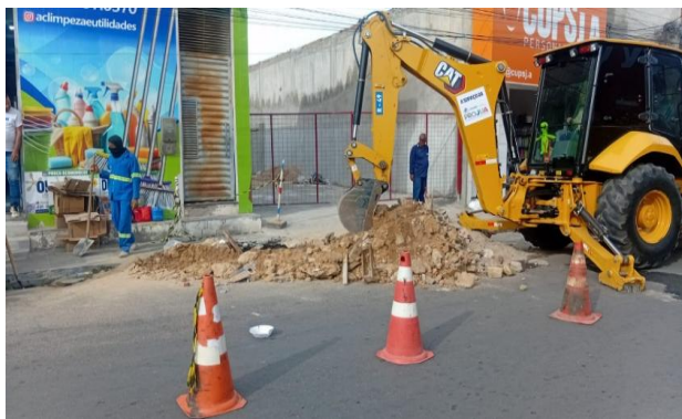
PRAÇA PEDRO PRIMO - BOTA FORA DE ENTULHO NA VIA