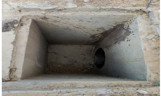
RUA A - DESOBSTRUÇÃO DE CAIXAS