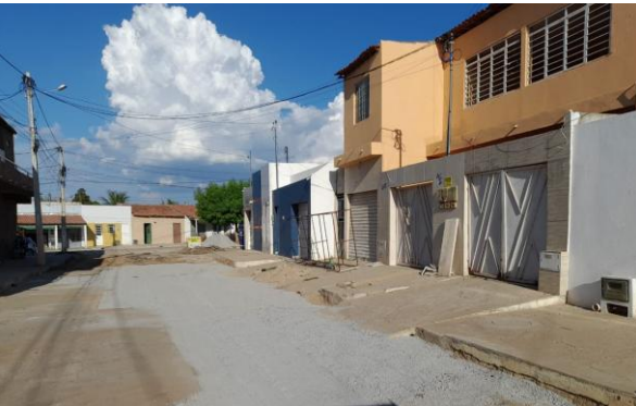
RUA SÃO FRANCISCO - BRITA GRADUADA SIMPLES