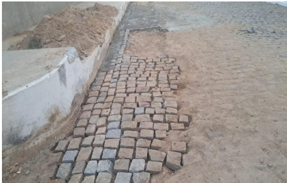
MANUTENÇÃO PAVIMENTO PARALELEPÍPEDO