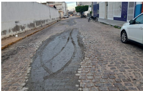
MANUTENÇÃO PAVIMENTO PARALELEPÍPEDO