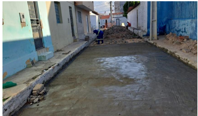
MANUTENÇÃO PAVIMENTO PARALELEPÍPEDO