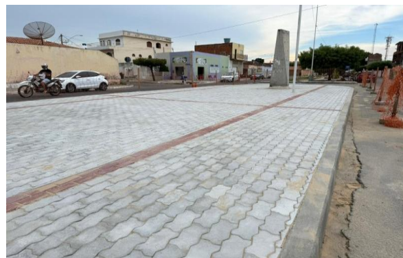
AV LUIS INÁCIO - INTERTRAVADO