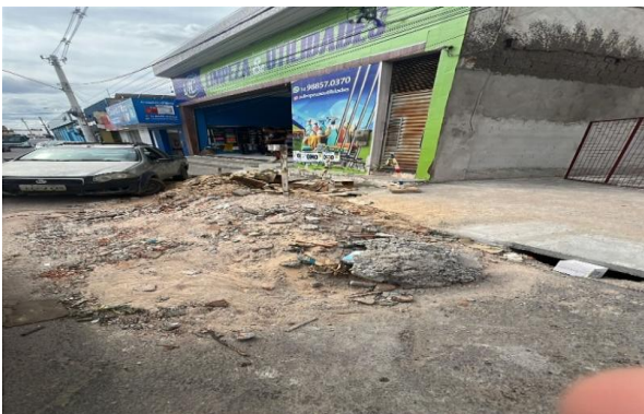
PRAÇA PEDRO PRIMO - BOTA FORA DE ENTULHO NA VIA