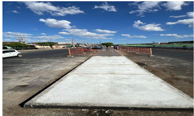
CEASA - CONCRETO USINADO