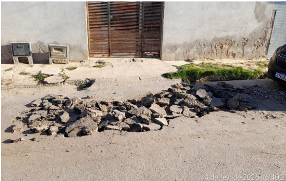
RUA SÃO JOÃO - MAN. PAVIMENTO ASFÁLTICO