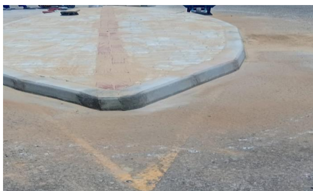
CEASA - INTERTRAVADO