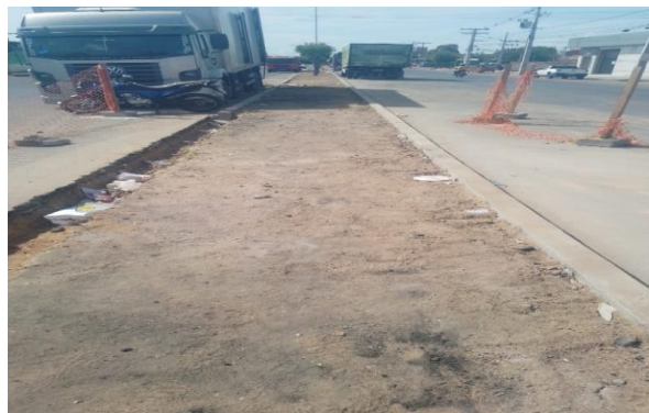
CEASA - REGULARIZAÇÃO