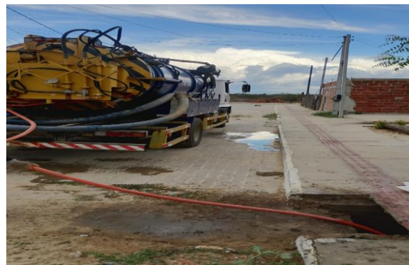
RUA E - SEWERJET