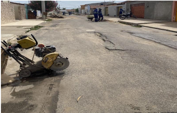
RUA SÃO FRANCISCO - MAN. PAVIMENTO ASFÁLTICO