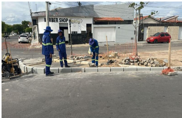
AV LUIS INÁCIO - ASSENTAMENTO DE MEIO FIO