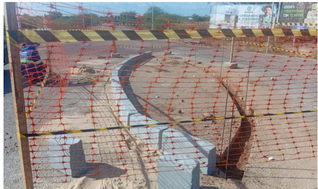
MANDACARU - ASSENTAMENTO DE MEIO FIO