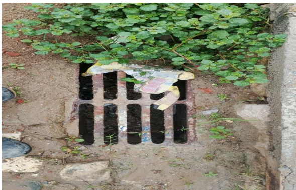
R. RIO DE JANEIRO - DESOBSTRUÇÃO DE CAIXA