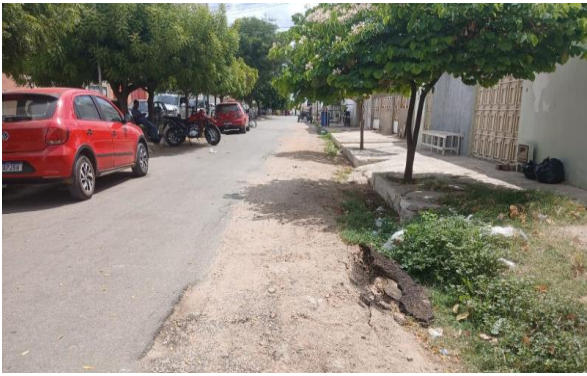
RUA DOM ÁVILA - MAN. PAVIMENTO ASFÁLTICO