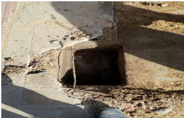
RUA F - DESOBSTRUÇÃO DE CAIXA