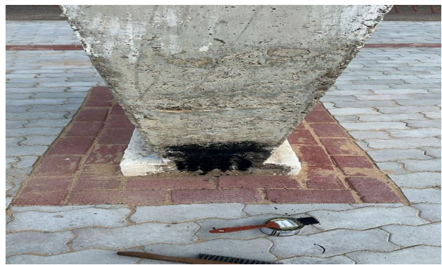
AV LUIS INÁCIO - ADENSAMENTO COM ÁGUA