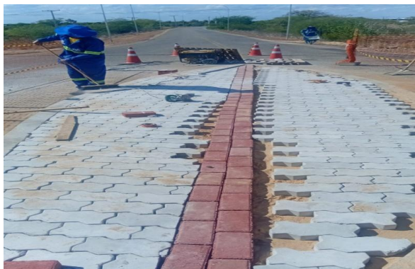
MANDACARU - INTERTRAVADO