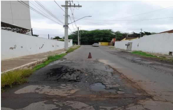
AV CARMELA DUTRA - MAN. PAV ASFÁLTICO