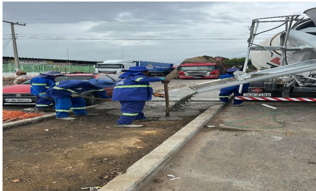
CEASA - CONCRETO USINADO