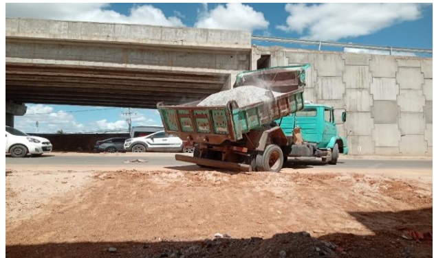
AV DUARTE CARNEIRO - BRITA GRADUADA SIMPLES