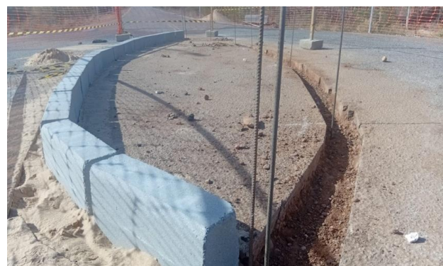
MANDACARU - ASSENTAMENTO DE MEIO FIO