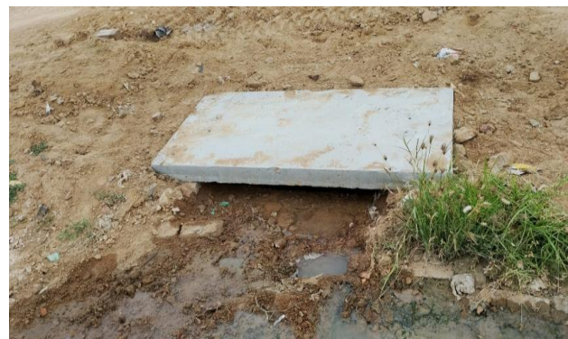
RES. DR HUMBERTO - TAMPA DE CONCRETO ARMADO