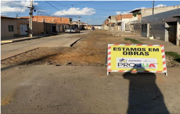
RUA SÃO JOÃO - MAN. PAVIMENTO ASFÁLTICO