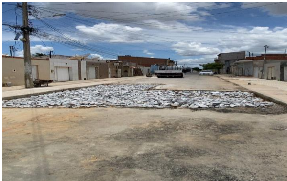
RUA BENTO GONÇALVES - COMPACTAÇÃO