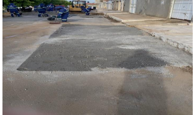
RUA DOM ÁVILA - BRITA GRADUADA SIMPLES