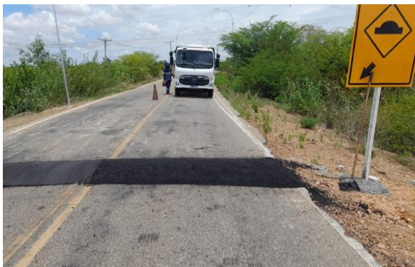
MANDACARU - MANUTENÇÃO PAV ASFÁLTICO