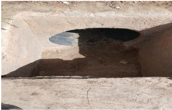
RUA M - DESOBSTRUÇÃO DE CAIXA