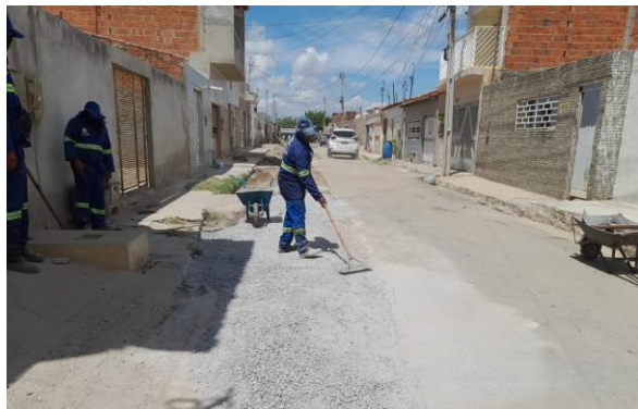
RUA SÃO FRANCISCO - BRITA GRADUADA SIMPLES