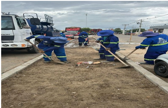
CEASA - PREPARAÇÃO DE TRECHO