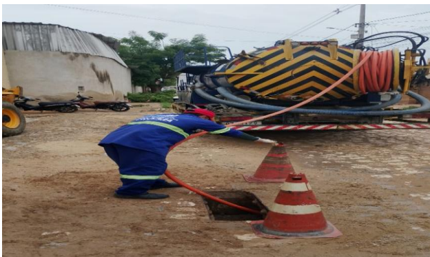
R. RIO DE JANEIRO - SEWERJET