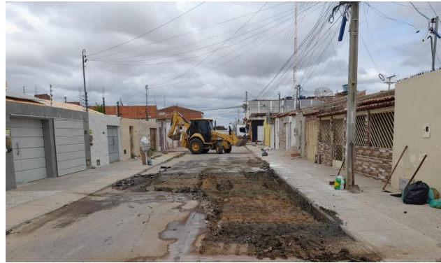
RUA BENTO GONÇALVES - ESCAVAÇÃO MECANIZADA