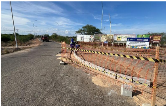
MANDACARU - ASSENTAMENTO DE MEIO FIO