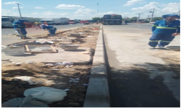
CEASA - ASSENTAMENTO DE MEIO FIO