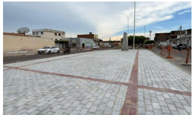
AV LUIS INÁCIO - INTERTRAVADO