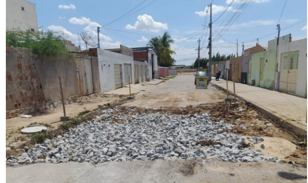
RUA SÃO FRANCISCO - REFORÇO SUB LEITO