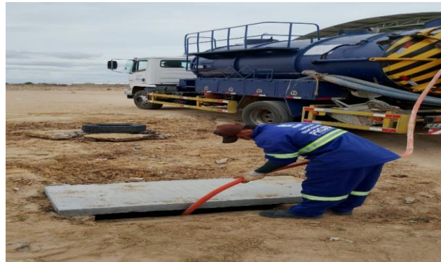
RES. DR HUMBERTO - SERVIÇO DE SEWERJET