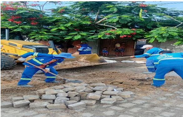
MANUTENÇÃO PAVIMENTO PARALELEPÍPEDO