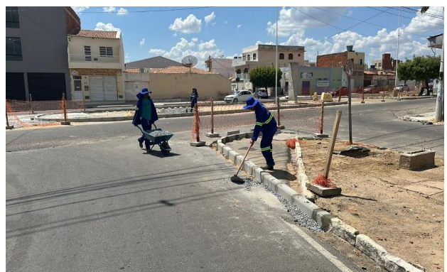
AV LUIS INÁCIO - ASSENTAMENTO DE MEIO FIO