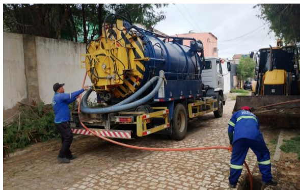
R. RIO DE JANEIRO - SEWERJET