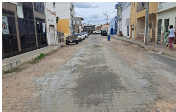
MANUTENÇÃO PAVIMENTO PARALELEPÍPEDO