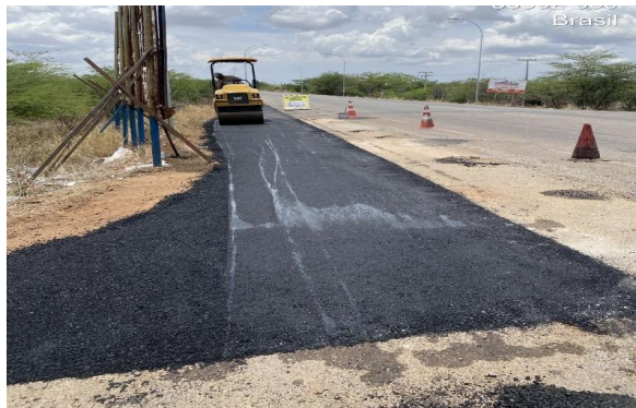
MANDACARU - MANUTENÇÃO PAV ASFÁLTICO