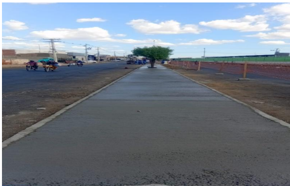
CEASA - CONCRETO USINADO