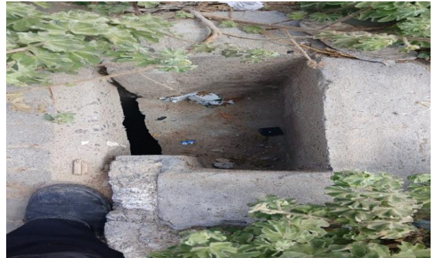
RUA M - DESOBSTRUÇÃO DE CAIXA