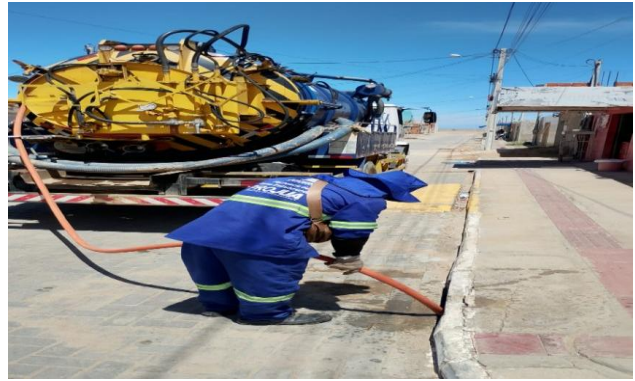
RUA I - SEWERJET