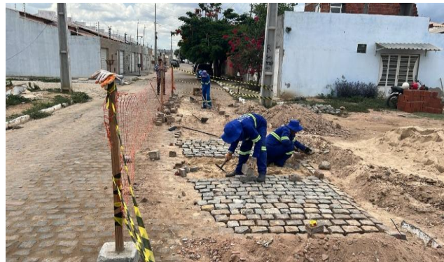
MANUTENÇÃO PAVIMENTO PARALELEPÍPEDO