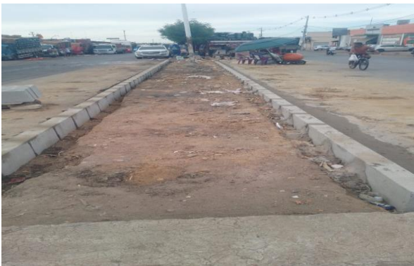
CEASA - ASSENTAMENTO DE MEIO FIO