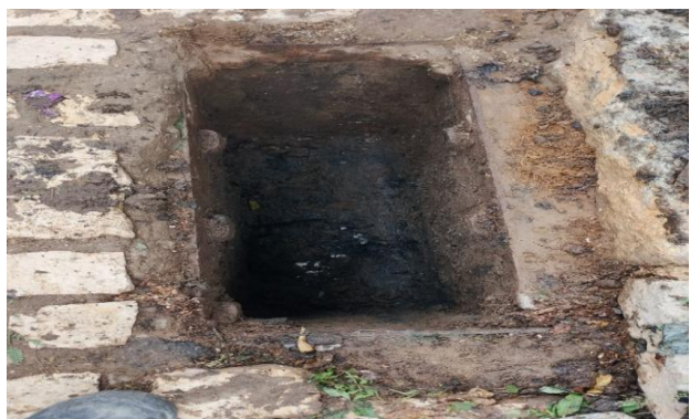
R. RIO DE JANEIRO - DESOBSTRUÇÃO DE CAIXA