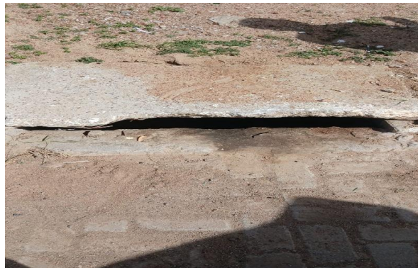
RUA M - DESOBSTRUÇÃO DE CAIXA