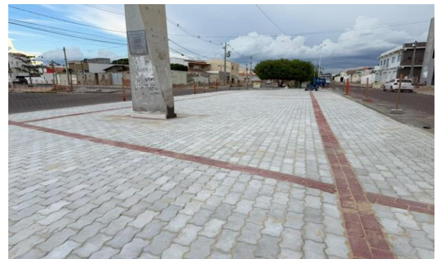
AV LUIS INÁCIO - INTERTRAVADO