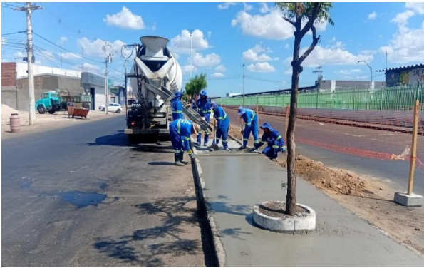
CEASA - CONCRETO USINADO