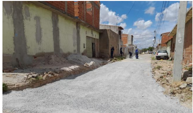
RUA SÃO FRANCISCO - BRITA GRADUADA SIMPLES