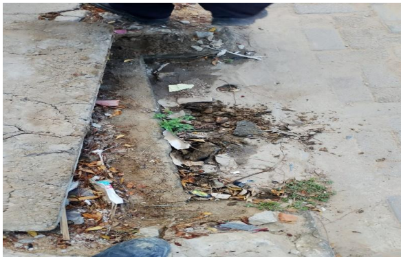
RUA G - DESOBSTRUÇÃO DE CAIXA