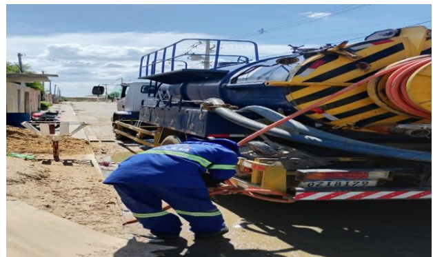
RUA G - SEWERJET