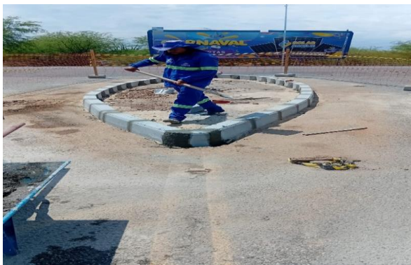
MANDACARU - ATERRO COM AREIA