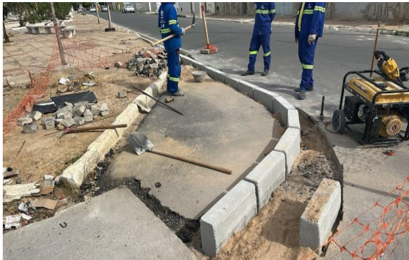
AV LUIS INÁCIO - CORTE DE ASFALTO