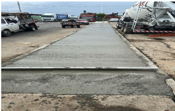
CEASA - ASSENTAMENTO DE MEIO FIO