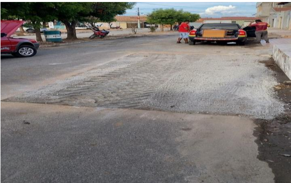
RUA DOM ÁVILA - BRITA GRADUADA SIMPLES