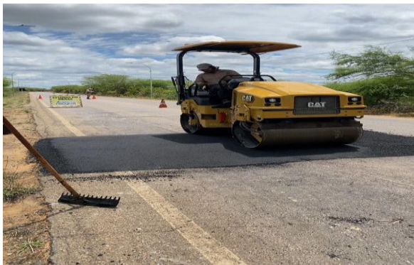
MANDACARU - MANUTENÇÃO PAV ASFÁLTICO