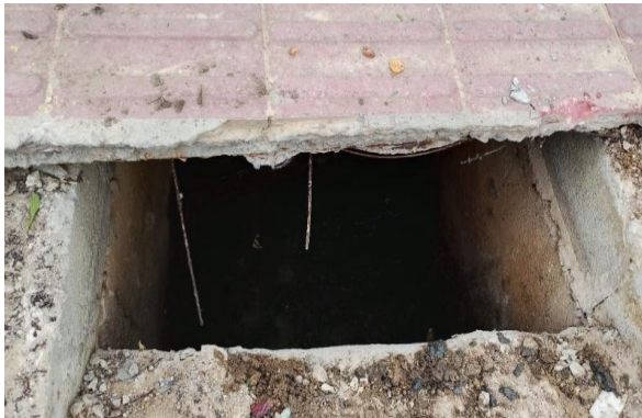
RUA E - DESOBSTRUÇÃO DE CAIXA