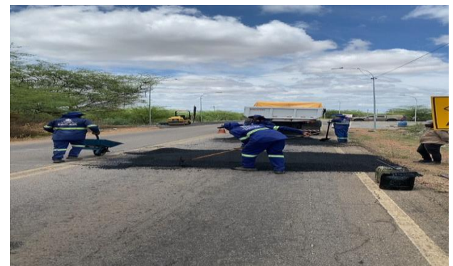
MANDACARU - MANUTENÇÃO PAV ASFÁLTICO