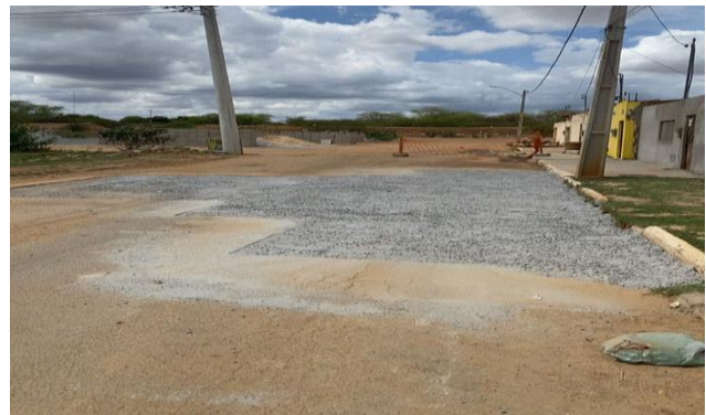
AV EDESIO SANTOS - BRITA GRADUADA SIMPLES