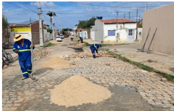
MANUTENÇÃO PAVIMENTO PARALELEPÍPEDO