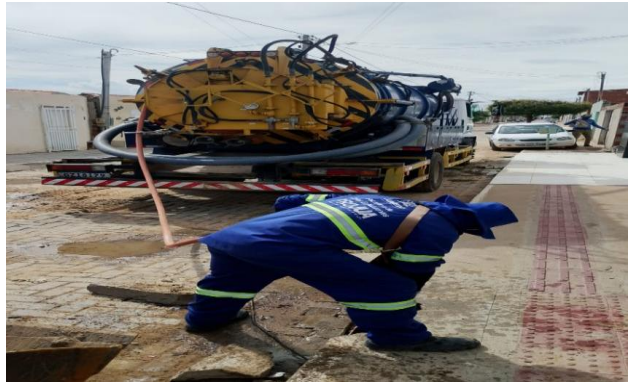
RUA F - SEWERJET