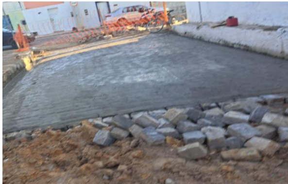
MANUTENÇÃO PAVIMENTO PARALELEPÍPEDO