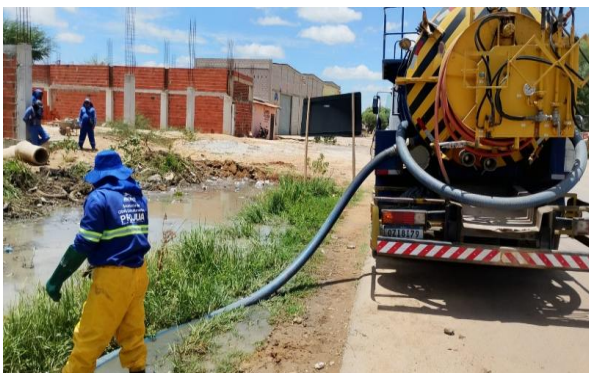
RUA G - SEWERJET