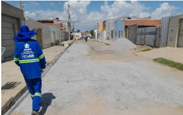
RUA SÃO FRANCISCO - BRITA GRADUADA SIMPLES