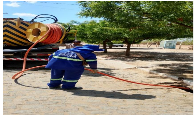
PRAIA DO RODEADOURO - SEWERJET