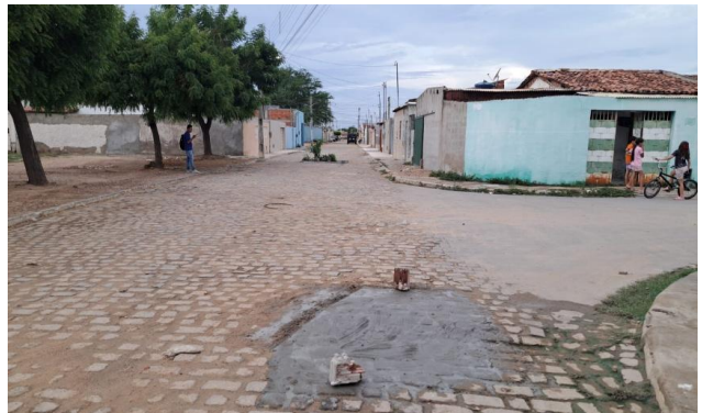
MANUTENÇÃO PAVIMENTO PARALELEPÍPEDO