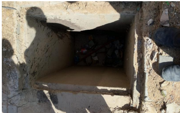
RUA A - DESOBSTRUÇÃO DE CAIXAS