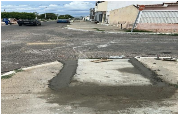
AV LUIS INÁCIO - CONCRETO SIMPLES