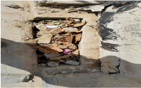
RUA A - DESOBSTRUÇÃO DE CAIXAS