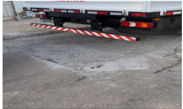
RUA DOM ÁVILA - BRITA GRADUADA SIMPLES