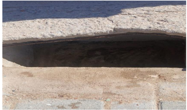
RUA I - DESOBSTRUÇÃO DE CAIXA