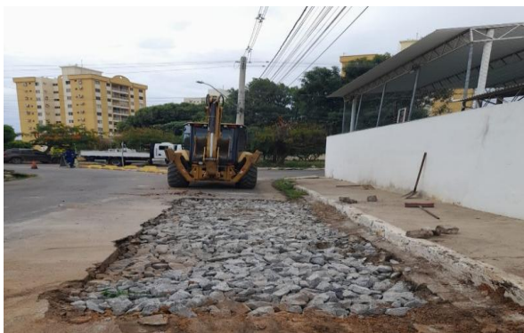
AV CARMELA DUTRA - REFORÇO SUB LEITO