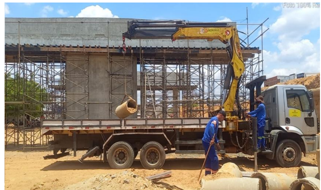
FORNECIMENTO DE MUNCK