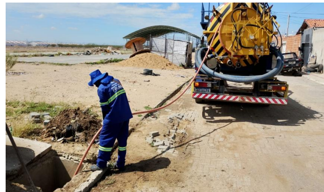
RUA G - SEWERJET