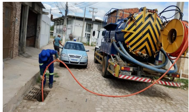
RUA M - SEWERJET