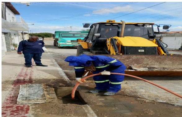
RUA F - SEWERJET