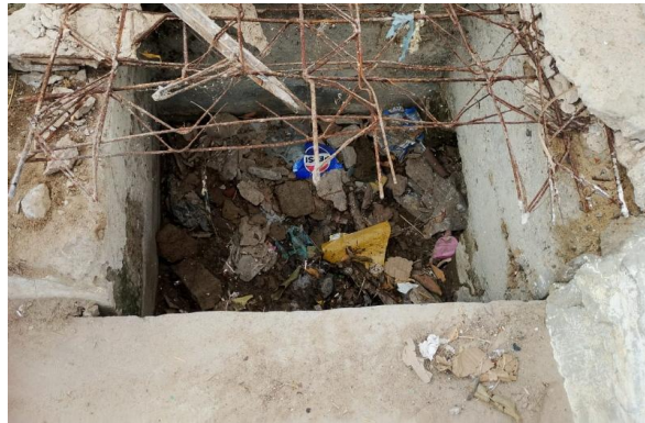
PRAIA DO RODEADOURO - DESOBSTRUÇÃO DE CAIXA