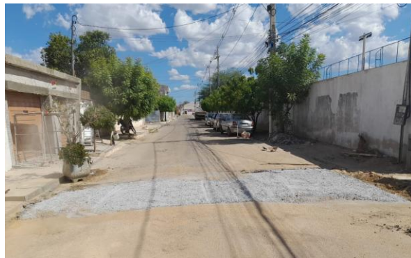
RUA SÃO FRANCISCO - BRITA GRADUADA SIMPLES