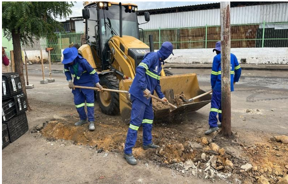
CEASA - BOTA FORA