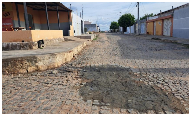
MANUTENÇÃO PAVIMENTO PARALELEPÍPEDO