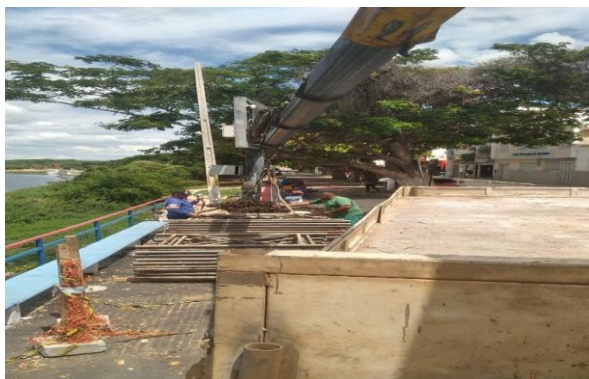
FORNECIMENTO DE MUNCK