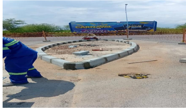
CEASA - ASSENTAMENTO DE MEIO FIO