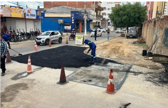
AV SÃO JOAO - MAN PAV ASFÁLTICO