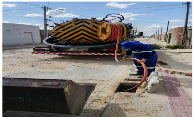
RUA A - SEWERJET