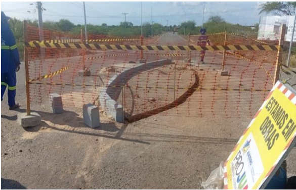
MANDACARU - ASSENTAMENTO DE MEIO FIO