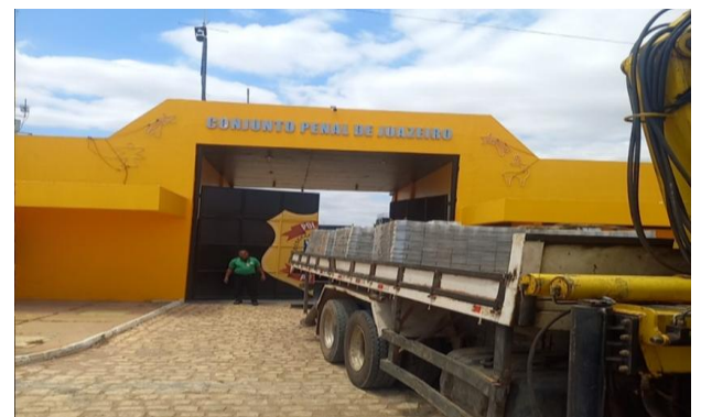
FORNECIMENTO DE MUNCK