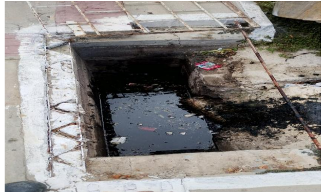
RUA E - DESOBSTRUÇÃO DE CAIXA