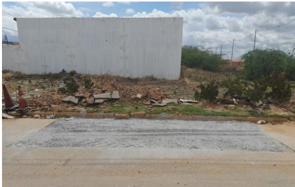
AV EDESIO SANTOS - BRITA GRADUADA SIMPLES