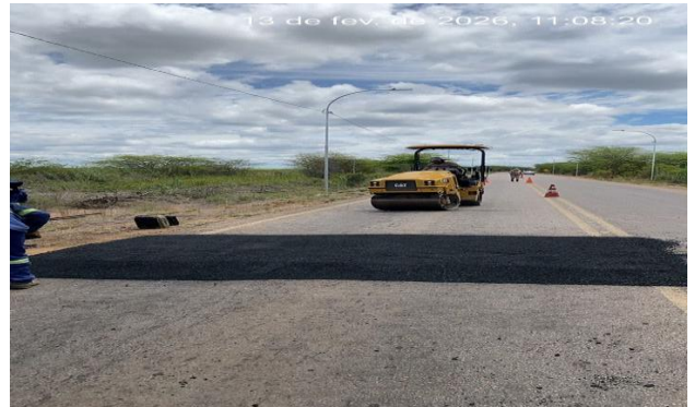
MANDACARU - MANUTENÇÃO PAV ASFÁLTICO