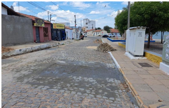
MANUTENÇÃO PAVIMENTO PARALELEPÍPEDO