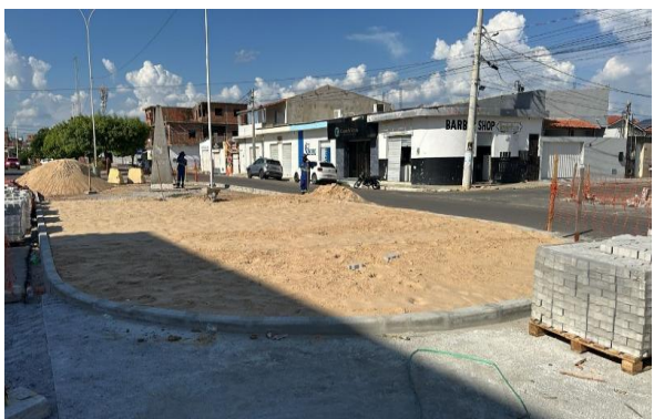
AV LUIS INÁCIO - CONCRETO ARMADO