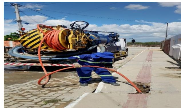
RUA F - SEWERJET