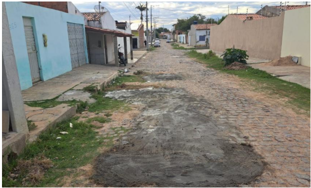
MANUTENÇÃO PAVIMENTO PARALELEPÍPEDO