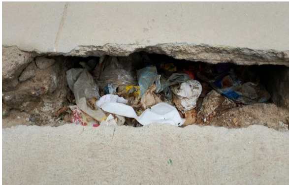
PRAIA DO RODEADOURO - DESOBSTRUÇÃO DE CAIXA