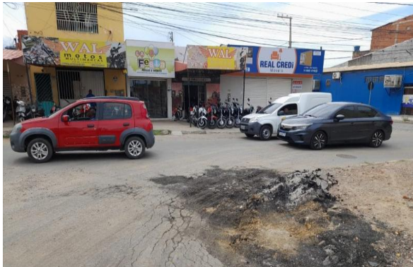
AV SÃO JOAO - MAN PAV ASFÁLTICO