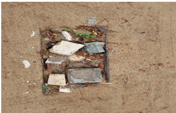
R. RIO DE JANEIRO - DESOBSTRUÇÃO DE CAIXA