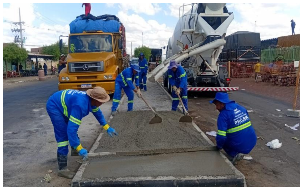
CEASA - CONCRETO USINADO