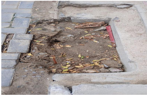
RES. DR HUMBERTO - DESOBSTRUÇÃO DE CAIXA