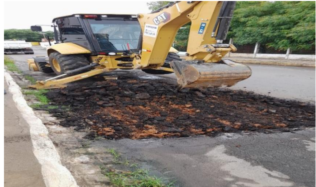
AV CARMELA DUTRA - ESCAVAÇÃO MECANIZADA