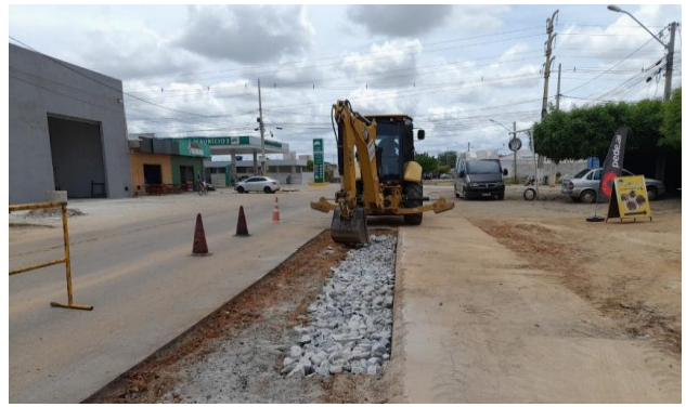
AV GIUSSEP MUCINI - MAN PAV ASFÁLTICO