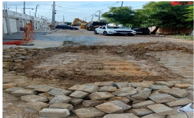
MANUTENÇÃO PAVIMENTO PARALELEPÍPEDO