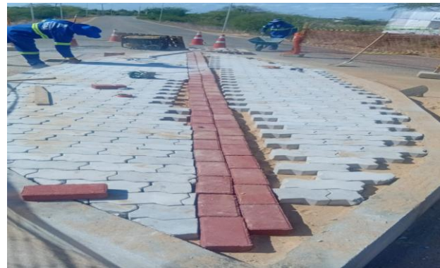
MANDACARU - INTERTRAVADO