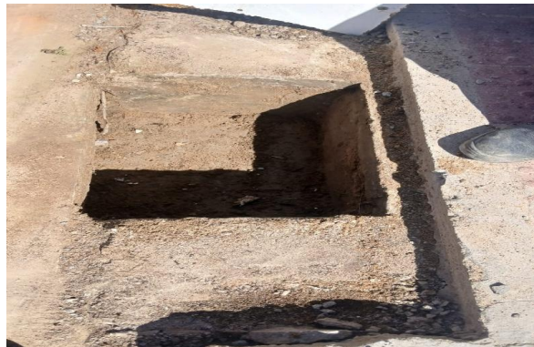
RUA I - DESOBSTRUÇÃO DE CAIXA