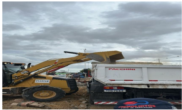
CEASA - BOTA FORA