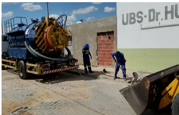
RUA A - SEWERJET