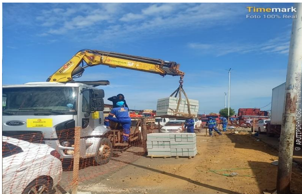
FORNECIMENTO DE MUNCK