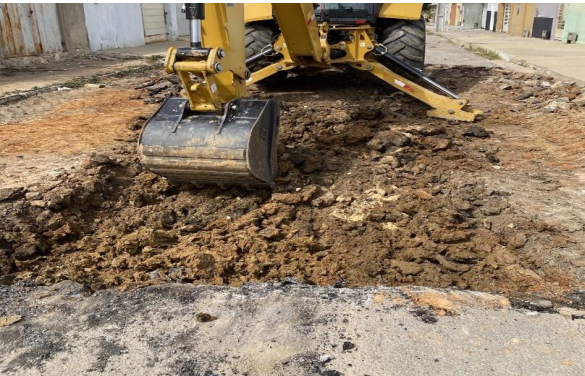
RUA SÃO FRANCISCO - ESCAVAÇÃO MECANIZADA