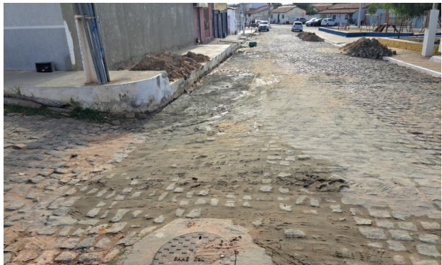
MANUTENÇÃO PAVIMENTO PARALELEPÍPEDO