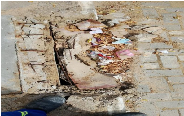
RUA F - DESOBSTRUÇÃO DE CAIXA