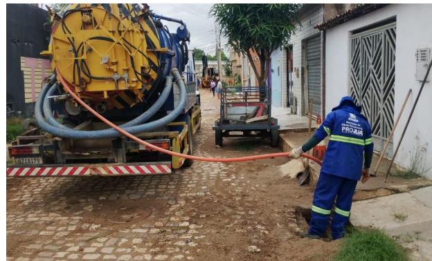
R. RIO DE JANEIRO - SEWERJET