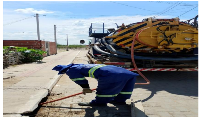
RUA I - SEWERJET