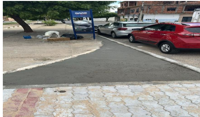
AV LUIS INÁCIO - CONCRETO SIMPLES