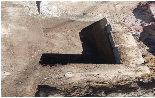
RUA I - DESOBSTRUÇÃO DE CAIXA