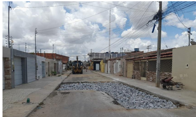
RUA BENTO GONÇALVES - REFORÇO SUB LEITO