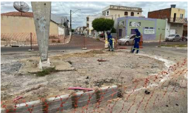
AV LUIS INÁCIO - ASSENTAMENTO DE MEIO FIO