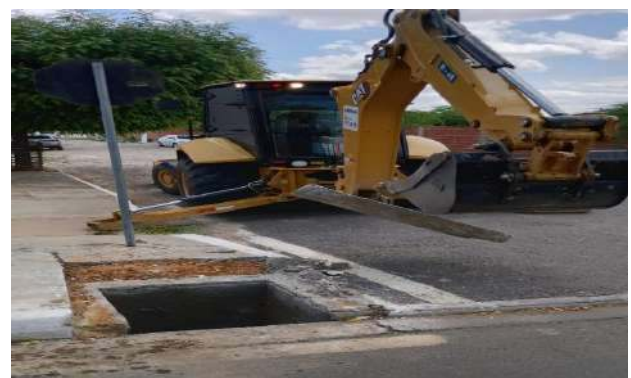
R SEVERO - DESOBSTRUÇÃO DE CAIXAS