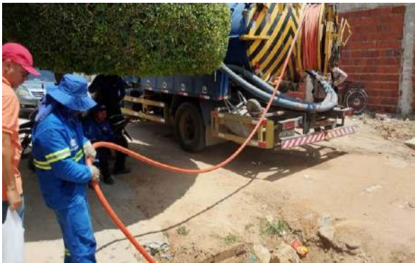
TRAVESSA DA VERDADE - SERVIÇO DE SEWERKET