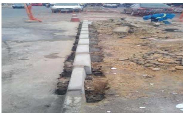
CEASA - ASSENTAMENTO DE MEIO FIO