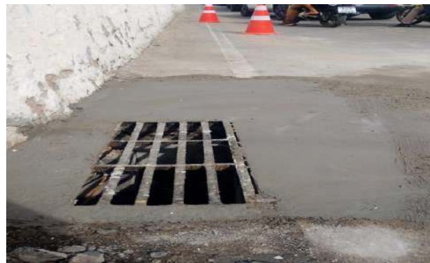
RUA JOSÉ PETITINGA - GRELHA DE FERRO ARTICULADA