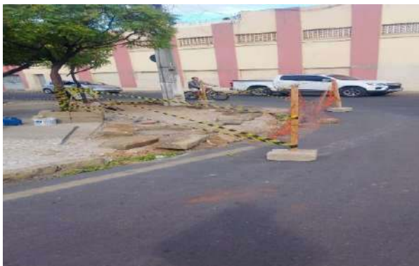
PRAÇA PEDRO PRIMO - ISOLAMENTO DE ÁREA