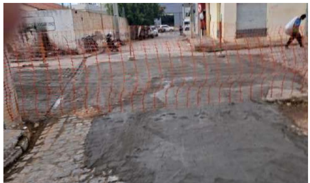
TRAV HILDETE LAMANTO - MAN. PAV. PARALELEPÍPEDO