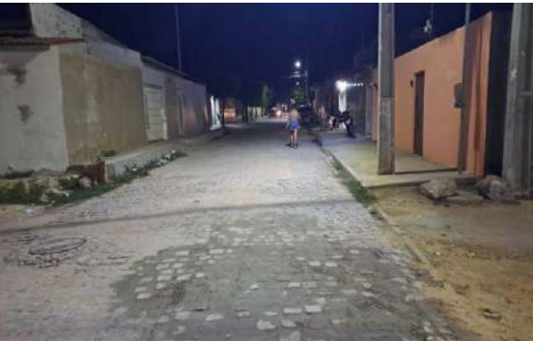
R BENTO GONÇALVES - MAN. PAV. PARALELEPÍPEDO