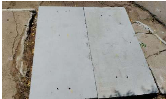
AV CRISTALINA - TAMPA DE CONCRETO ARMADO