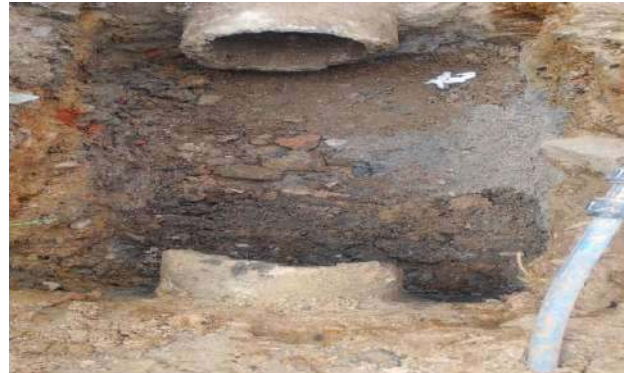
TRAV. FRANCISCO MARTINS - DESOBSTRUÇÃO DE CAIXA