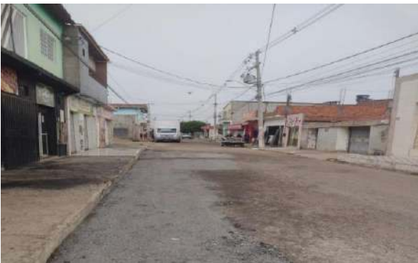
AV SÃO FRANCISCO - BRITA GRADUADA SIMPLES