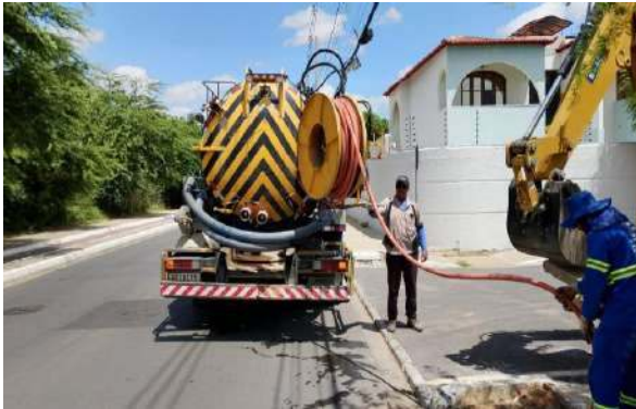
R SEVERO - SERVIÇO DE SEWERKET