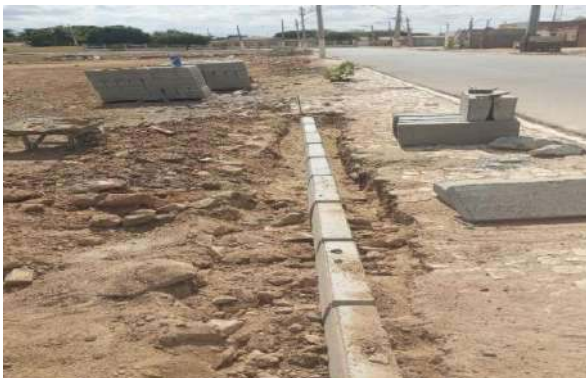
CARNAÍBA DO SERTÃO - ASSENTAMENTO DE MEIO FIO