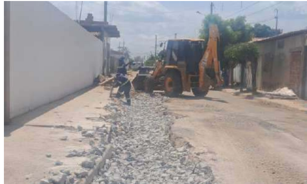
R DAS ALGAROBAS - REFORÇO DO SUB-LEITO