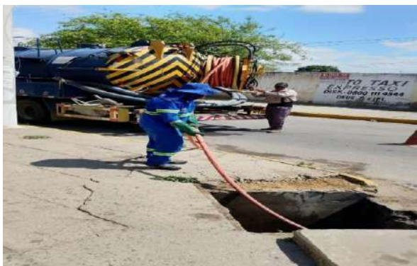
RUA DA PAZ - SERVIÇO DE SEWERKET