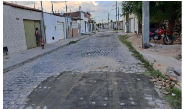
R BENTO GONÇALVES - MAN. PAV. PARALELEPÍPEDO