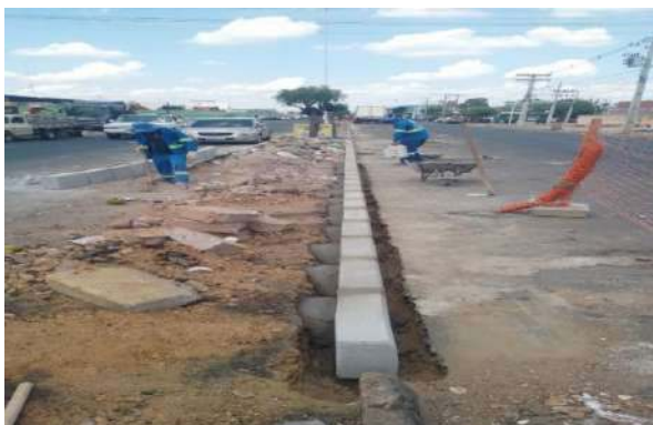
CEASA - ASSENTAMENTO DE MEIO FIO