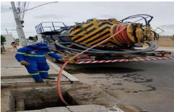
AV GIRASSOL - SERVIÇO DE SEWERJET