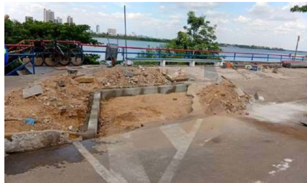
AV CARMELA DUTRA - ASSENTAMENTO DE MEIO FIO