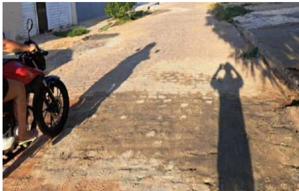
MANUT. PAV. PARALELEPÍPEDO - RUA H e RUA G