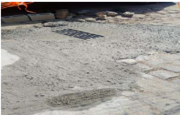
RUA DO COLISEU - GRELHA DE FEERO ARTICULADA