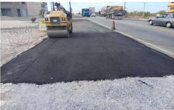
CARNAÍBA DO SERTÃO - MAN. PAVIMENTO ASFÁLTICO