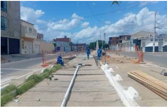
AV LUIS INÁCIO - ESCAVAÇÃO MANUAL