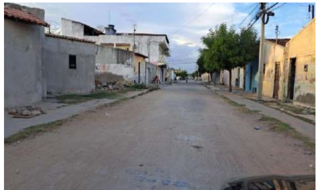
R MARQUES DE BARBACENA - MAN. PAV. PARALELEPÍPEDO