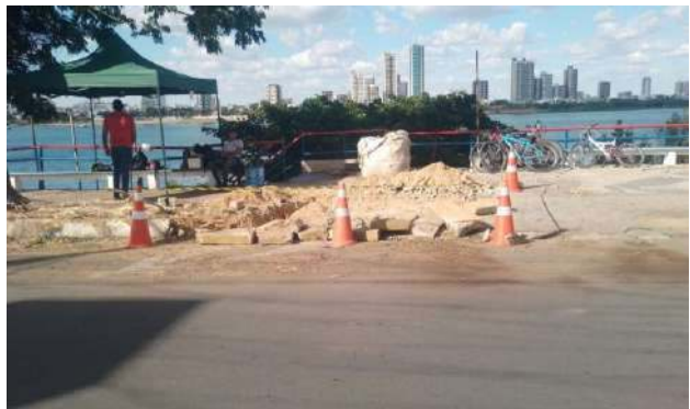
AV CARMELA DUTRA - ESCAVAÇÃO MANUAL