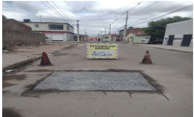
AV SÃO FRANCISCO - BRITA GRADUADA SIMPLES