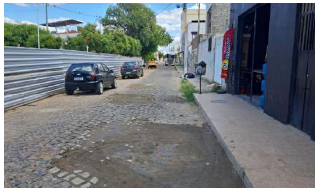
MANUT. PAV. PARALELEPÍPEDO - R HEMENEGILDO