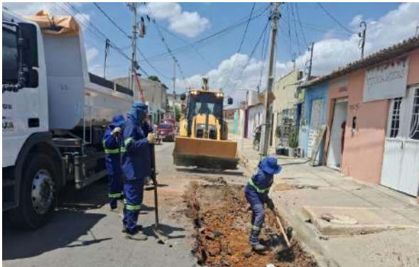
AV GIRASSOL - MAN. PAVIMENTO ASFÁLTICO