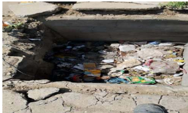
RUA DA PAZ - DESOBSTRUÇÃO DE CAIXAS