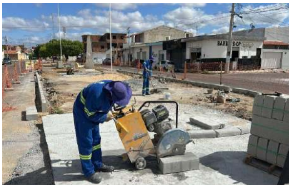
AV LUIZ INÁCIO - CORTE DE ASFALTO