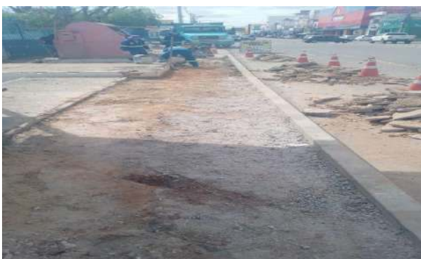
AV OSCAR RIBEIRO - REGULARIZAÇÃO DE TERRENO