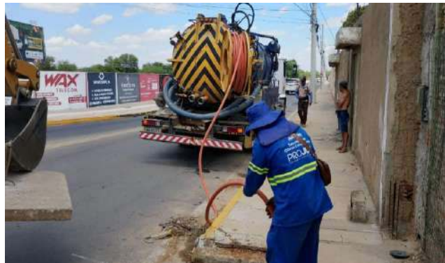
AV PEDRA DO LORD - DESOBSTRUÇÃO DE CAIXAS