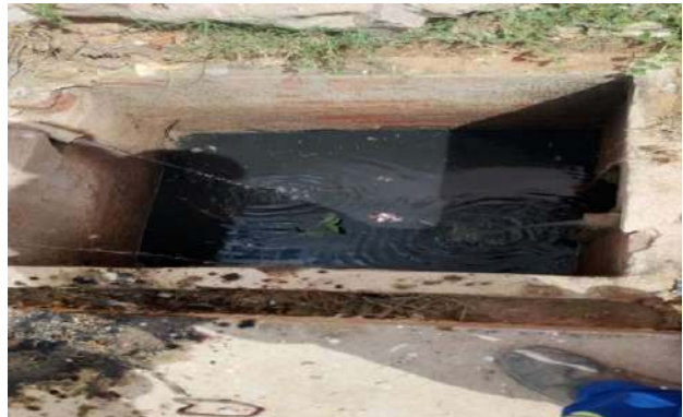
AV MALHADA DA AREIA - DESOBSTRUÇÃO DE CAIXAS