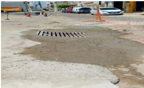
RUA DO COLISEU - GRELHA DE FERRO