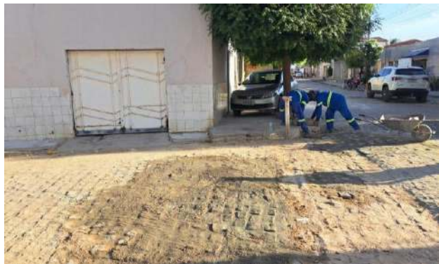
R BENTO GONÇALVES - MAN. PAV. PARALELEPÍPEDO