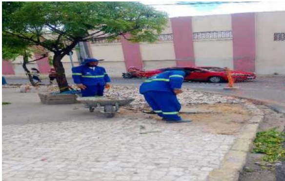
PRAÇA PEDRO PRIMO - DEMOLIÇÃO PASSEIO