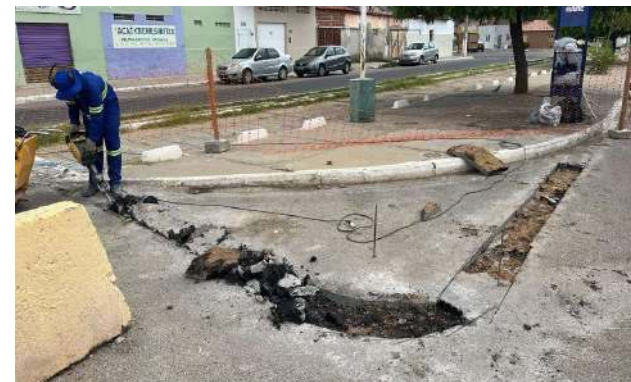
AV LUIZ INÁCIO - DEMOLIÇÃO ASFÁLTICA