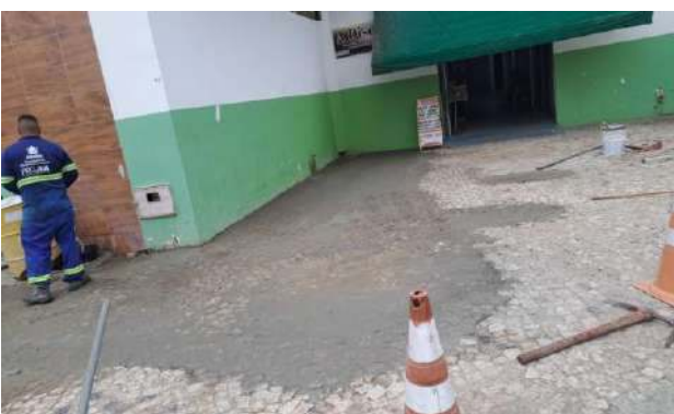
PRAÇA PEDRO PRIMO - MAN. PAV. PEDRA PORTUGUESA