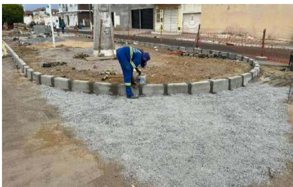
AV LUIZ INÁCIO - MEIO FIO