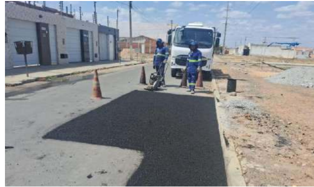
AV CRISTALINA - ESCAVAÇÃO MECANIZADA