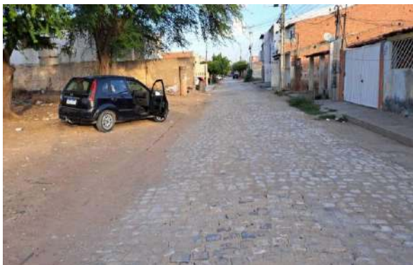
MANUTEN. PAV. PALELEPÍPEDO - RUA RIO DE JANEIRO