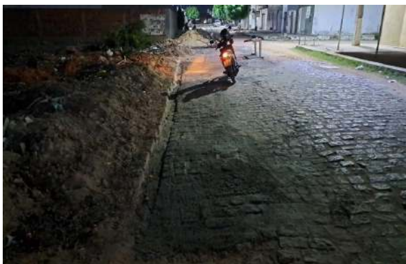
RUA PEROVAZ - MANUTENÇÃO PAV PARALELEPÍPEDO