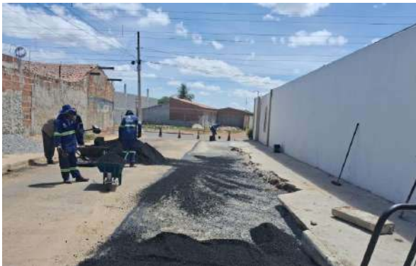
AV CRISTALINA - MANUTENÇÃO PAV ASFALTO