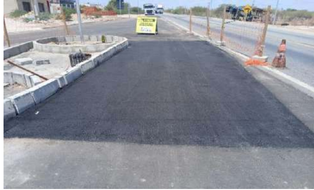
CARNAÍBA DO SERTÃO - MAN. PAVIMENTO ASFÁLTICO