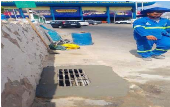
RUA DO PARAÍSO - GRELHA ARTICULADA DE FERRO