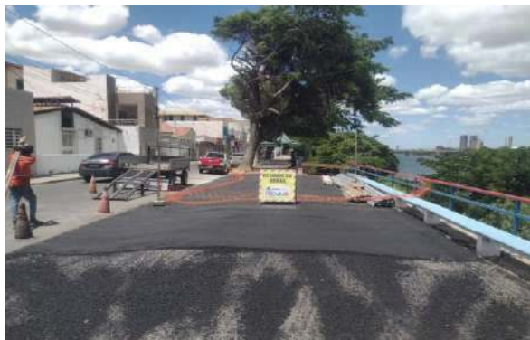
AV CARMELA DUTRA - MANUTENÇÃO PAV ASFALTO