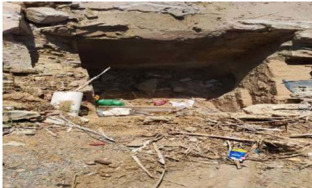
AV CRISTALINA - DESOBSTRUÇÃO DE CAIXAS