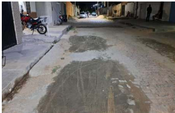
RUA PEROVAZ - MAN. PAVIMENTO PARALELEPÍPEDO