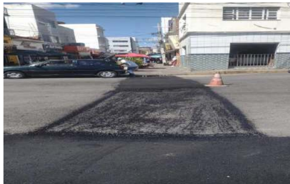
AV OSCAR RIBEIRO - MAN. PAVIMENTO ASFÁLTICO