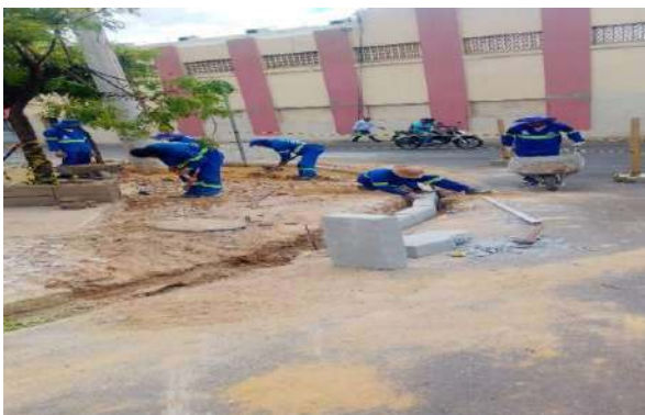
PRAÇA PEDRO PRIMO - ASSENTAMENTO DE MEIO FIO