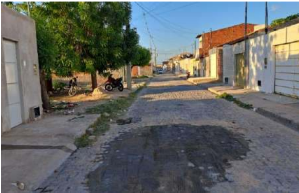
R BENTO GONÇALVES - MAN. PAV. PARALELEPÍPEDO