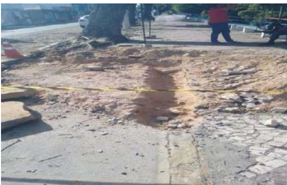
AV CARMELA DUTRA - ESCAVAÇÃO MANUAL