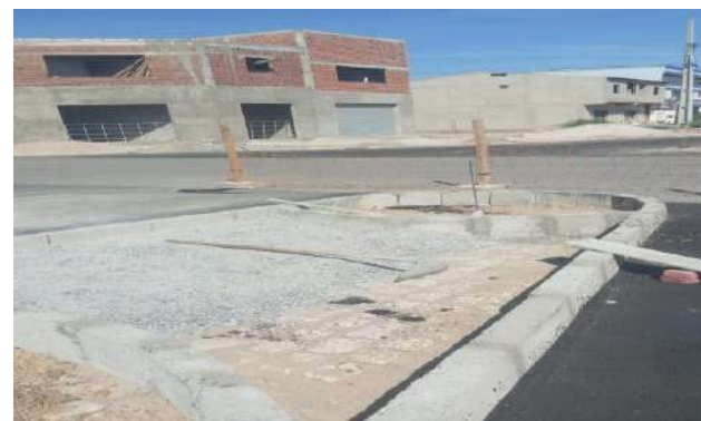
CARNAÍBA DO SERTÃO - ASSENTAMENTO DE MEIO FIO