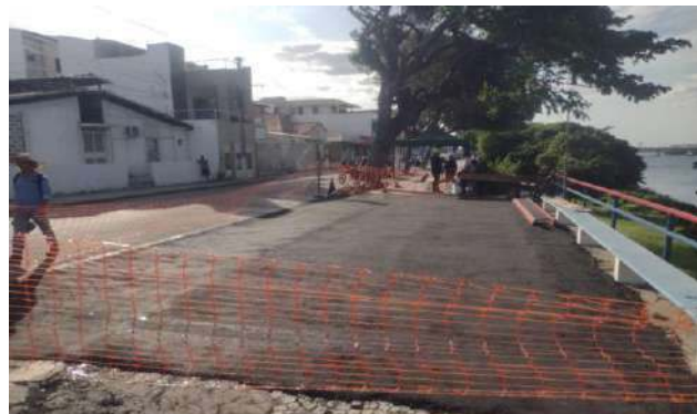
AV CARMELA DUTRA - MANUTENÇÃO PAV ASFALTO