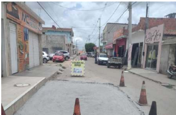
AV SÃO FRANCISCO - BRITA GRADUADA SIMPLES