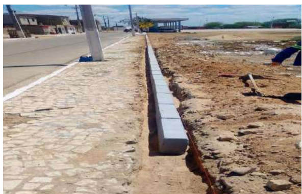
CARNAÍBA DO SERTÃO - ASSENTAMENTO DE MEIO FIO