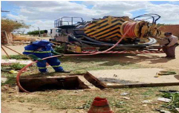
AV MALHADA DA AREIA - SERVIÇO DE SEWERKET