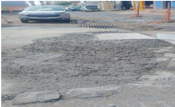
RUA DO COLISEU - TAMPA DE CONCRETO ARMADO