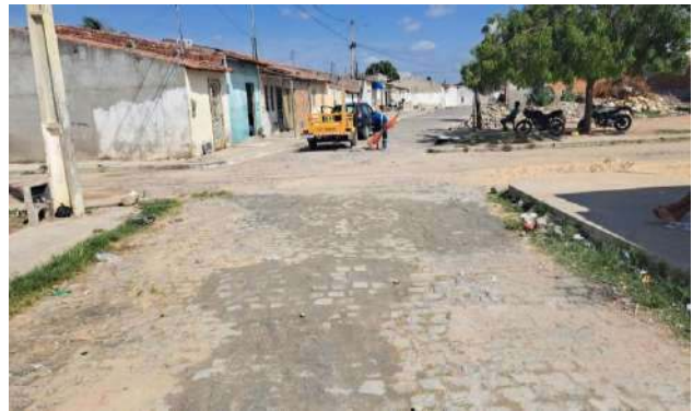
R MARQUES DE BARBACENA - MAN. PAV. PARALELEPÍPEDO