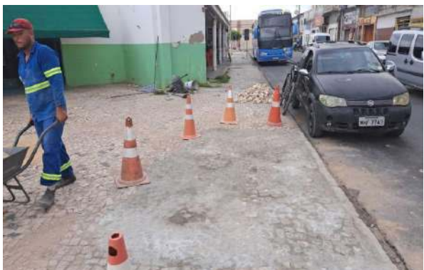
PRAÇA PEDRO PRIMO - MAN. PAV. PEDRA PORTUGUESA