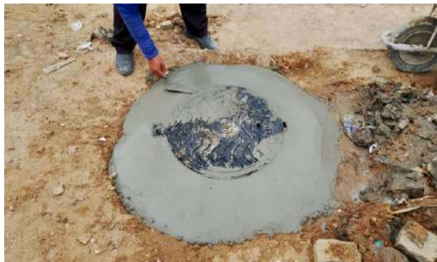
RES. SÃO FRANCISCO - TAMPÃO REDONDO ARTICULADO