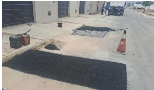
AV IRMÃ DULCE - MAN. PAVIMENTO ASFÁLTICO