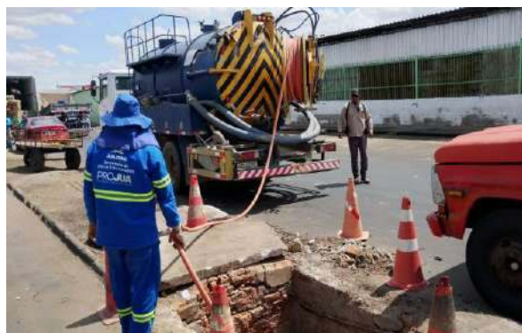
CEASA - SERVIÇO DE SEWERJET