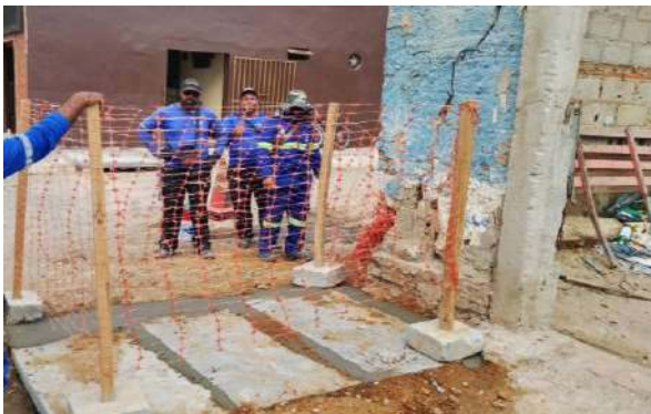
AV GIRASSOL - INSTALAÇÃO TAMPAS DE CONCRETO