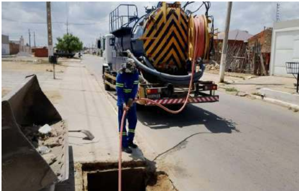
AV CRISTALINA - SERVIÇO DE SEWERJET