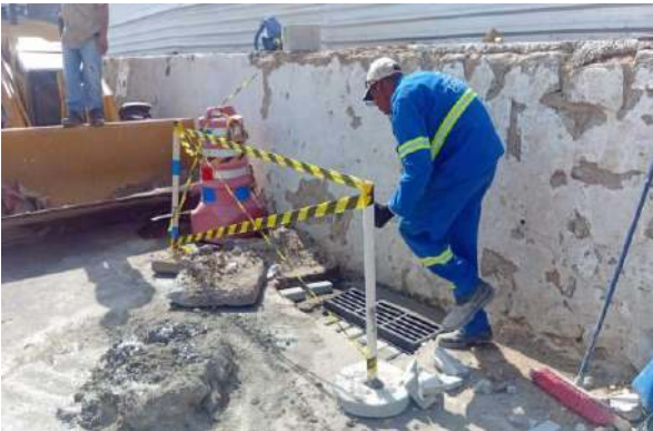
RUA DO PARAÍSO - GRELHA ARTICULADA DE FERRO