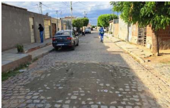
R BENTO GONÇALVES - MAN. PAV. PARALELEPÍPEDO