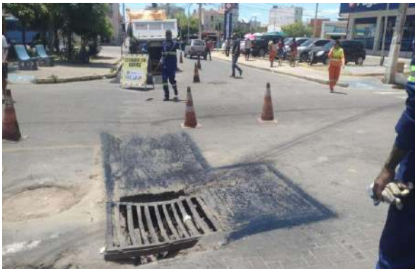
AV OSCAR RIBEIRO - MAN. PAVIMENTO ASFÁLTICO