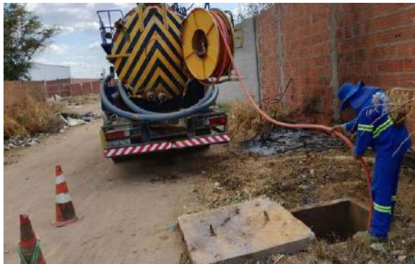
AV MALHADA DA AREIA - SERVIÇO DE SEWERKET