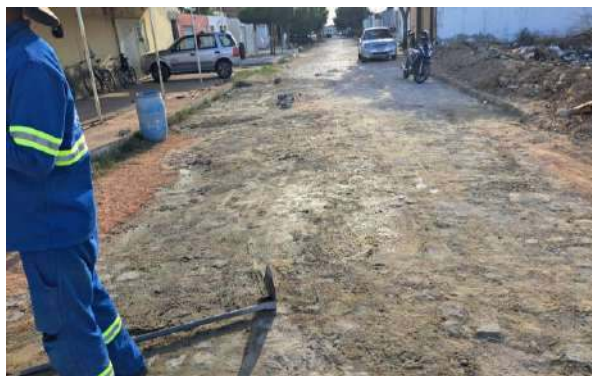
RUA PEROVAZ - MANUTENÇÃO PAV PARALELEPÍPEDO