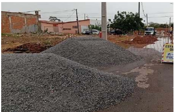
AV EDÉSIO SANTOS - MAN. PAVIMENTO ASFÁLTICO