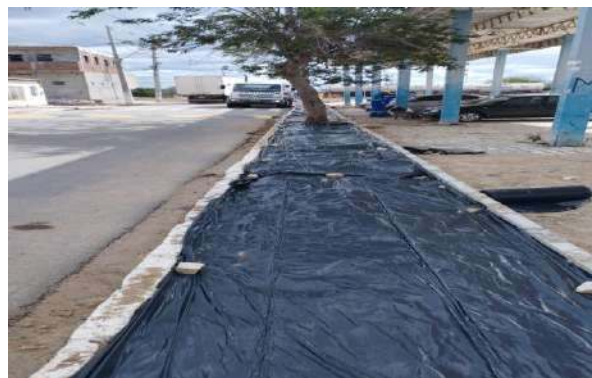
CARNAÍBA DO SERTÃO - LONA PARA CONCRETO