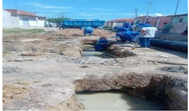
AV MIGUEL SILVA - ESCAVAÇÃO MECANIZADA