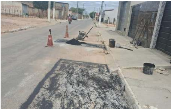
AV IRMÃ DULCE - MAN. PAVIMENTO ASFÁLTICO