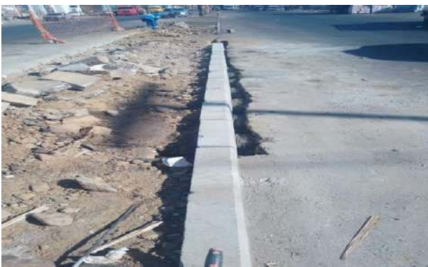
CEASA - MEIO FIO