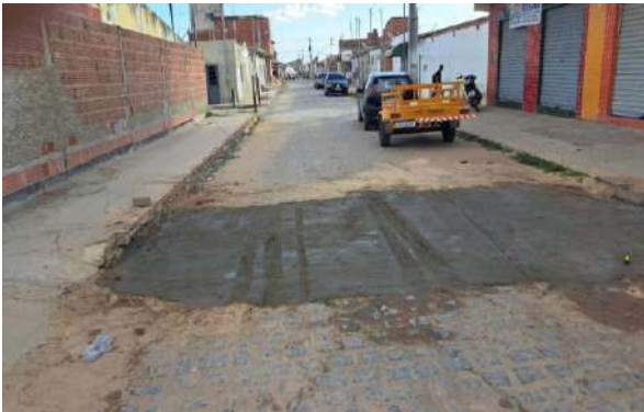
R BENTO GONÇALVES - MAN. PAV. PARALELEPÍPEDO