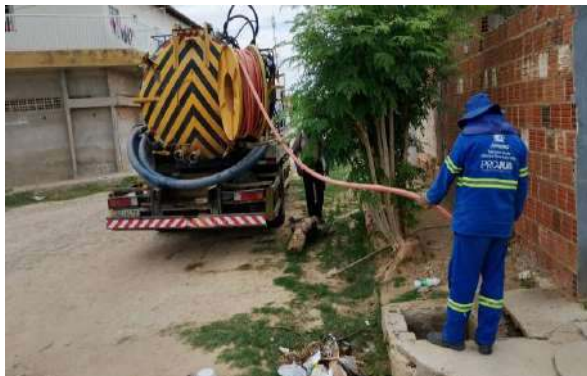
R SEBASTIÃO ALMEIDA - SERVIÇO DE SEWERKET