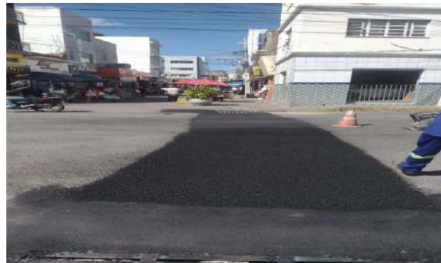
AV OSCAR RIBEIRO - MAN. PAVIMENTO ASFÁLTICO