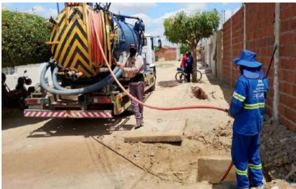
TRAVESSA DA VERDADE - SERVIÇO DE SEWERKET