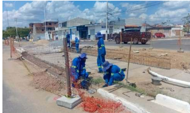
AV LUIS INÁCIO - FORMAS PARA CONCRETAGEM