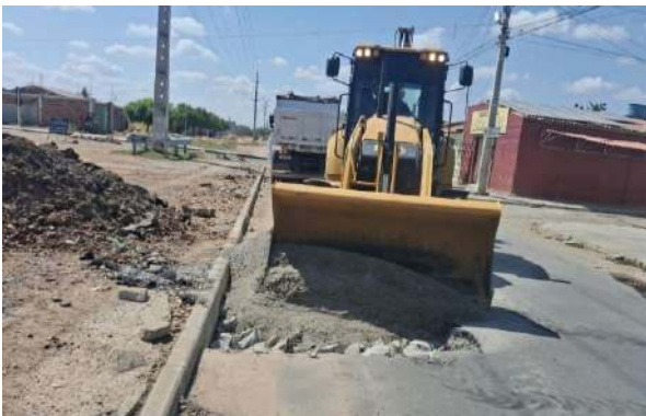
AV CRISTALINA - BRITA GRADUADA SIMPLES