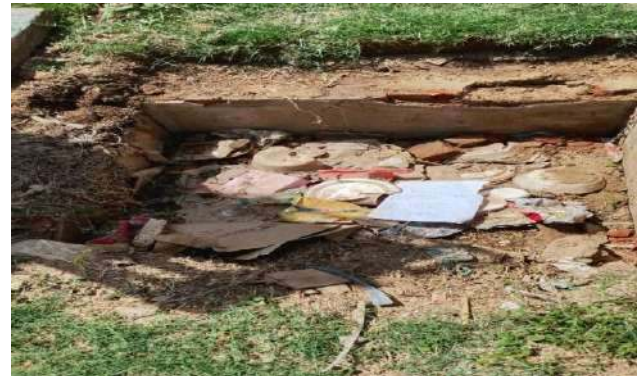
TRAVESSA DA VERDADE - DESOBSTRUÇÃO DE CAIXAS