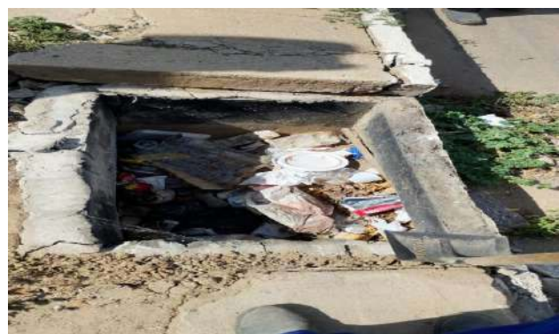
R SEVERO - DESOBSTRUÇÃO DE CAIXAS