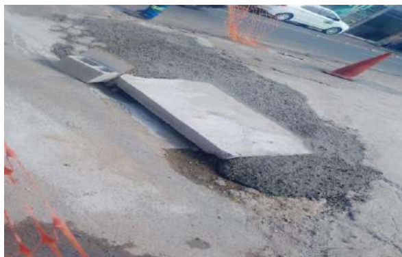
RUA DO COLISEU - TAMPA DE CONCRETO ARMADO