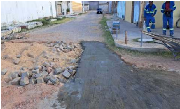
RUA PEROVAZ - MANUTENÇÃO PAV PARALELEPÍPEDO