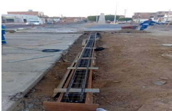
AV LUIS INÁCIO - FORMAS PARA CONCRETAGEM