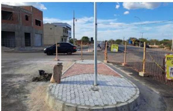
CARNAÍBA DO SERTÃO - MAN. PAVIMENTO INTERTRAVADO