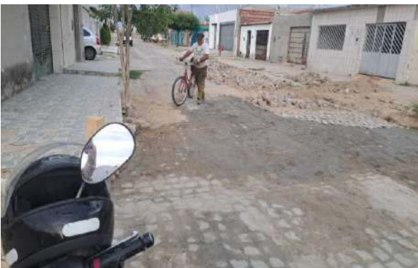
TRAV HILDETE LAMANTO - MAN. PAV. PARALELEPÍPEDO