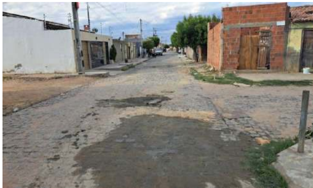
R BENTO GONÇALVES - MAN. PAV. PARALELEPÍPEDO