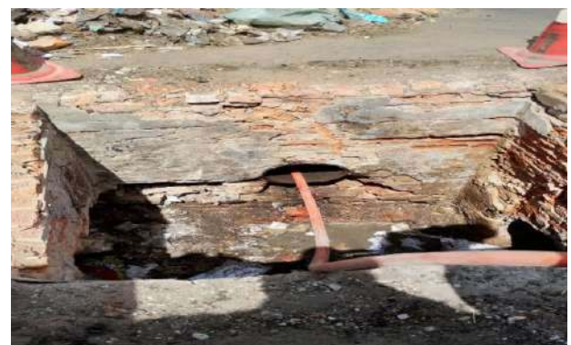
CEASA - DESOBSTRUÇÃO DE CAIXAS