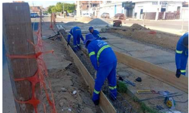
AV LUIS INÁCIO - FORMAS PARA CONCRETAGEM