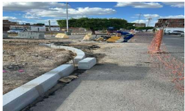
AV LUIZ INÁCIO - MEIO FIO