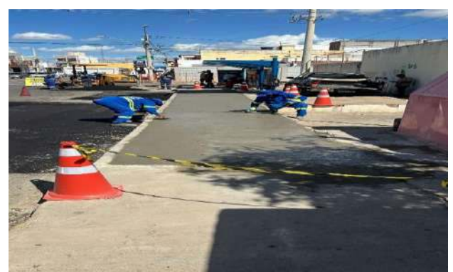
AV OSCAR RIBEIRO - CONCRETO USINADO