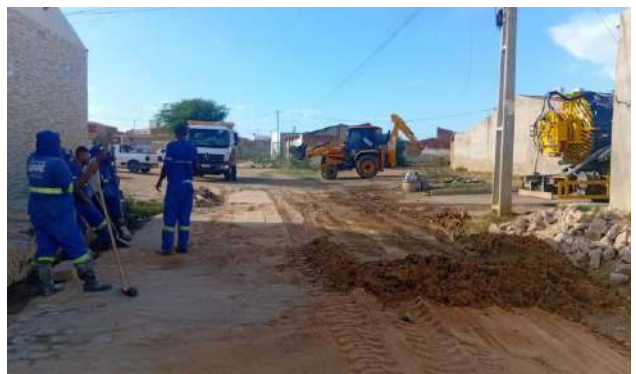
AV MIGUEL SILVA - ATERRO COM AREIA