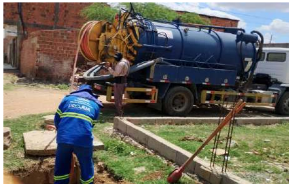
TRAVESSA DA VERDADE - SERVIÇO DE SEWERKET