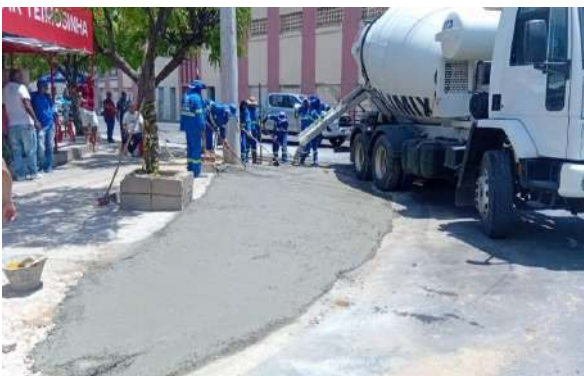
PRAÇA PEDRO PRIMO - CONCRETO USINADO