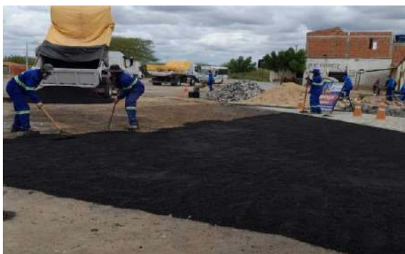
AV EDÉSIO SANTOS - MAN. PAVIMENTO ASFÁLTICO