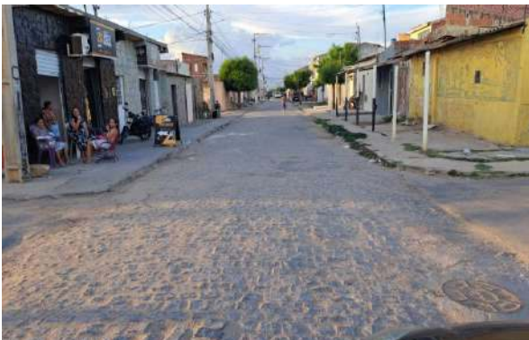
R MARQUES DE BARBACENA - MAN. PAV. PARALELEPÍPEDO