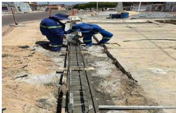
AV LUIS INÁCIO - CONCRETO ARMADO