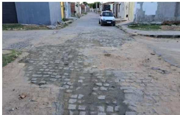
R BENTO GONÇALVES - MAN. PAV. PARALELEPÍPEDO