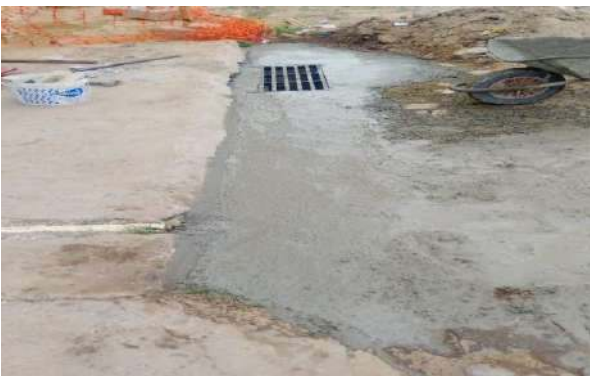
TRAV. FRANCISCO MARTINS - INSTALAÇÃO DE GRELHA