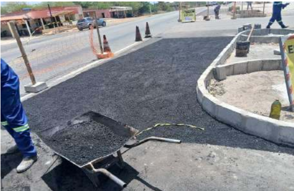
CARNAÍBA DO SERTÃO - MAN. PAVIMENTO ASFÁLTICO