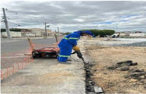
AV LUIS INÁCIO - DEMOLIÇÃO ASFÁLTICA