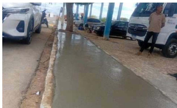
CARNAÍBA DO SERTÃO - CONCRETO USINADO