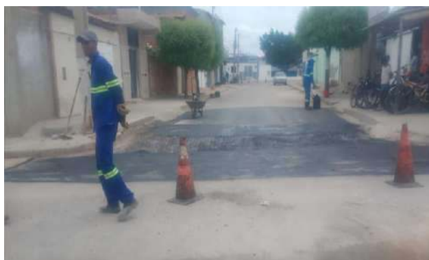
R JOSÉ ANCHEITA - MAN. PAVIMENTO ASFÁLTICO