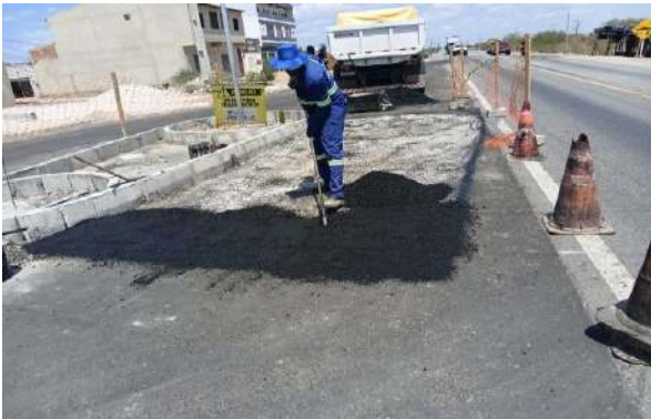
CARNAÍBA DO SERTÃO - MAN. PAVIMENTO ASFÁLTICO