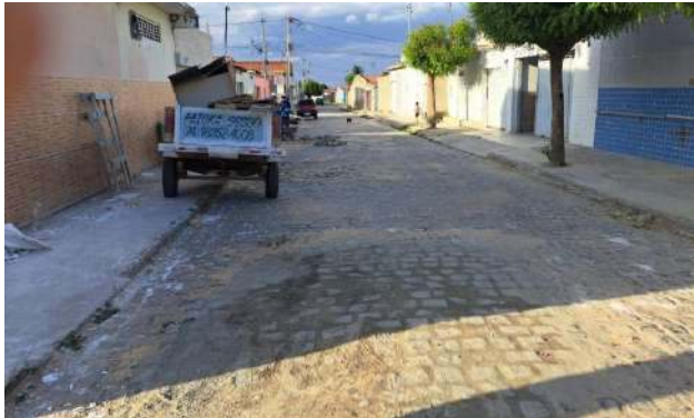
R BENTO GONÇALVES - MAN. PAV. PARALELEPÍPEDO