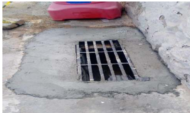
RUA DO PARAÍSO - GRELHA ARTICULADA DE FERRO