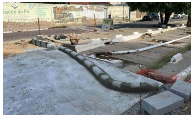
AV CRISTALINA - MANUTENÇÃO PAV ASFALTO