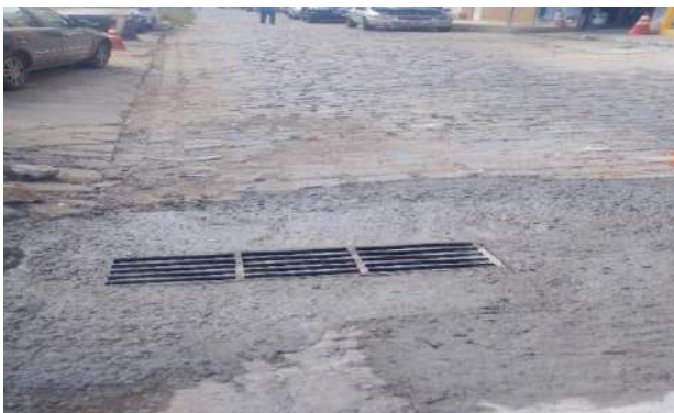
RUA DO COLISEU - GRELHA DE FEERO ARTICULADA