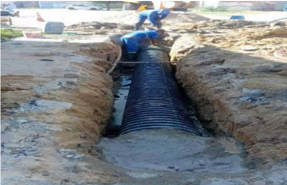
AV MIGUEL SILVA - ASSENTAMENTO DE TUBO 450MM