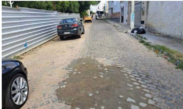
MANUT. PAV. PARALELEPÍPEDO - R HEMENEGILDO