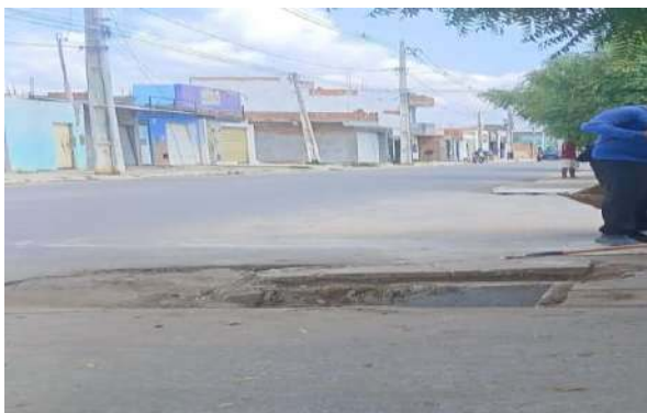
AV CRISTALINA - SUBSTITUIÇÃO TAMPA QUEBRADA