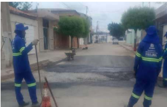
R JOSÉ ANCHEITA - MAN. PAVIMENTO ASFÁLTICO