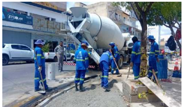
PRAÇA PEDRO PRIMO - CONCRETO USINADO