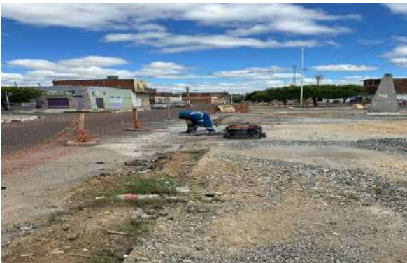
AV LUIS INÁCIO - DEMOLIÇÃO ASFÁLTICA