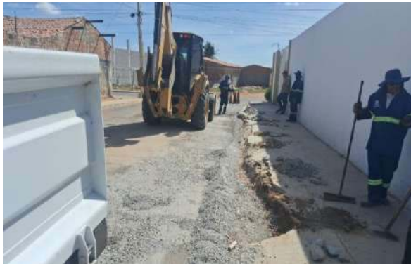
AV CRISTALINA - BRITA GRADUADA SIMPLES