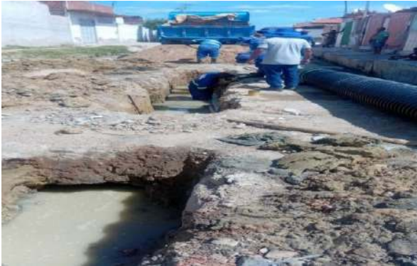
AV MIGUEL SILVA - ESCAVAÇÃO MECANIZADA