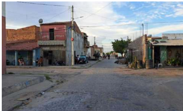
MANUTEN. PAV. PALELEPÍPEDO - RUA RIO DE JANEIRO