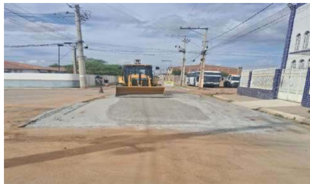
AV EDÉSIO SANTOS - BRITA GRADUADA SIMPLES