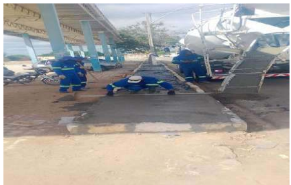
CARNAÍBA DO SERTÃO - CONCRETO USINADO