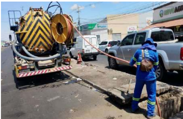
CEASA - SERVIÇO DE SEWERJET