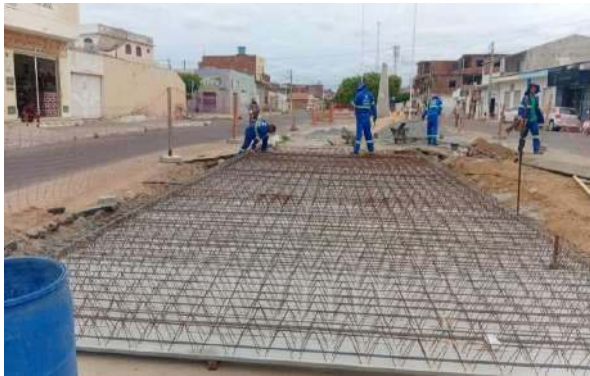
AV LUIS INÁCIO - ARMAÇÃO DA LAJE