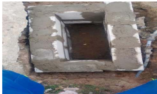
TRAV. FRANCISCO MARTINS - ALVENARIA DE BLOCO