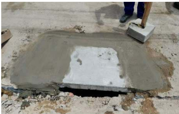
PRAÇA PEDRO PRIMO - TAMPA DE CONCRETO ARMADO