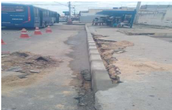
AV OSCAR RIBEIRO - ASSENTAMENTO DE MEIO FIO