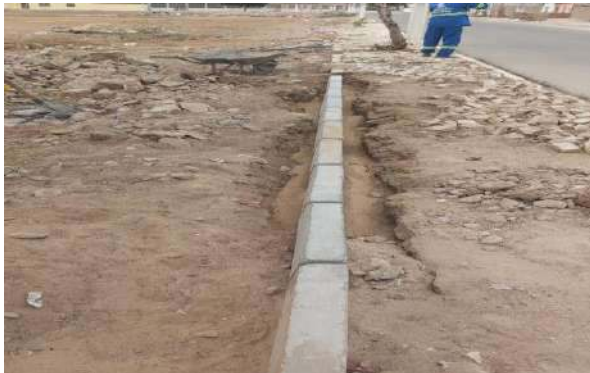
CARNAÍBA DO SERTÃO - ASSENTAMENTO DE MEIO FIO