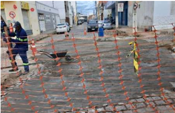
TRAV HILDETE LAMANTO - MAN. PAV. PARALELEPÍPEDO