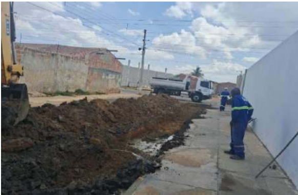
R DAS ALGAROBAS - ESCAVAÇÃO MECANIZADA