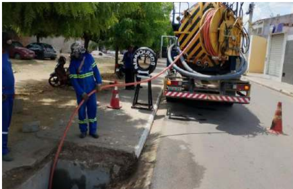
AV CRISTALINA - SERVIÇO DE SEWERJET