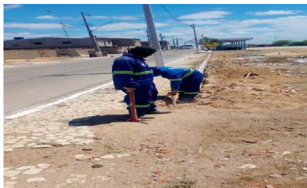
CARNAÍBA DO SERTÃO - ASSENTAMENTO DE MEIO FIO