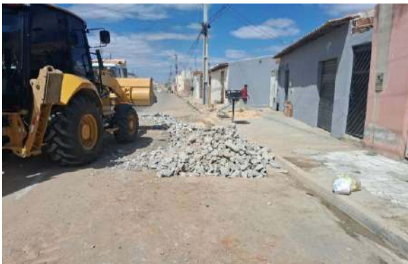
AV GIRASSOL - REFORÇO DE SUBLEITO