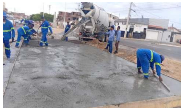
AV LUIS INÁCIO - CONCRETO ARMADO LAJE