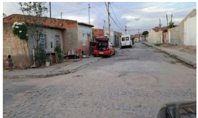
R MARQUES DE BARBACENA - MAN. PAV. PARALELEPÍPEDO