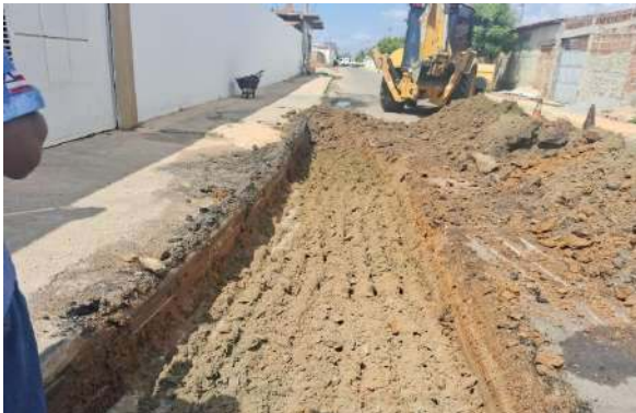
R DAS ALGAROBAS - ESCAVAÇÃO MECANIZADA