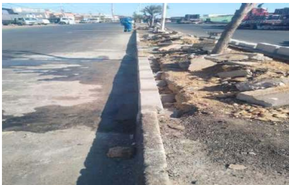
CEASA - ASSENTAMENTO DE MEIO FIO