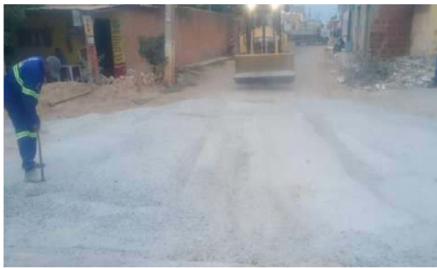
R JOSÉ ANCHEITA - MAN. PAVIMENTO ASFÁLTICO