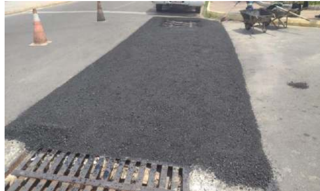
AV OSCAR RIBEIRO - MAN. PAVIMENTO ASFÁLTICO