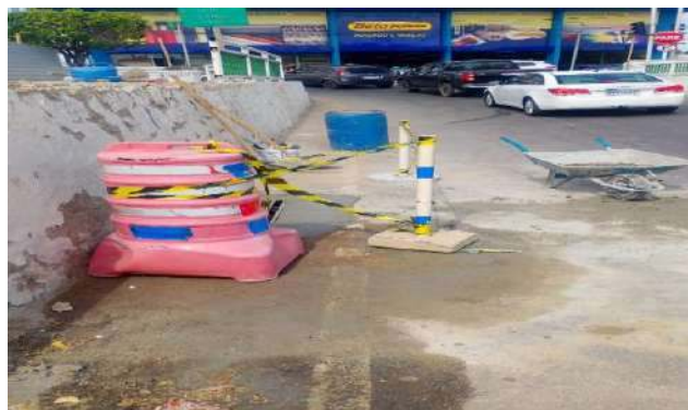
RUA DO PARAÍSO - GRELHA ARTICULADA DE FERRO