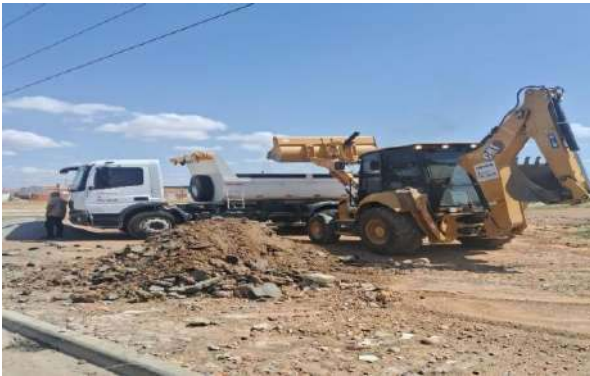
AV CRISTALINA - MAN. PAVIMENTO ASFÁLTICO