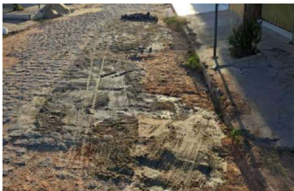
MANUT. PAV. PARALELEPÍPEDO - RUA H e RUA G