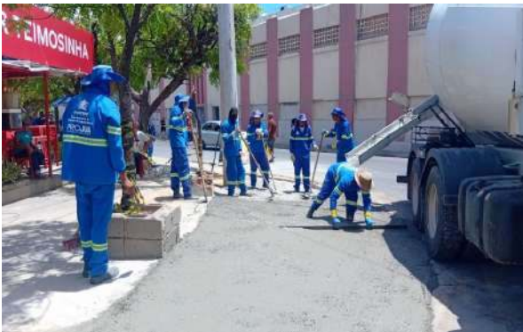
PRAÇA PEDRO PRIMO - CONCRETO USINADO