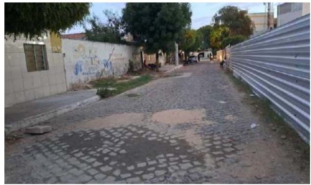
MANUT. PAV. PARALELEPÍPEDO - R HEMENEGILDO