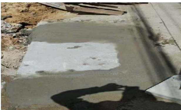
PRAÇA PEDRO PRIMO - TAMPA DE CONCRETO ARMADO