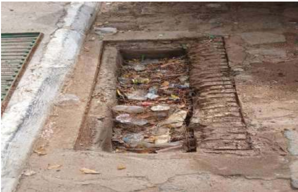
RES. SÃO FRANCISCO - DESOBSTRUÇÃO DE CAIXA