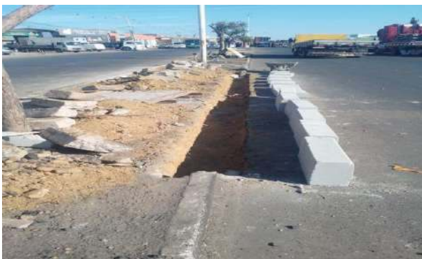
CEASA - ASSENTAMENTO DE MEIO FIO