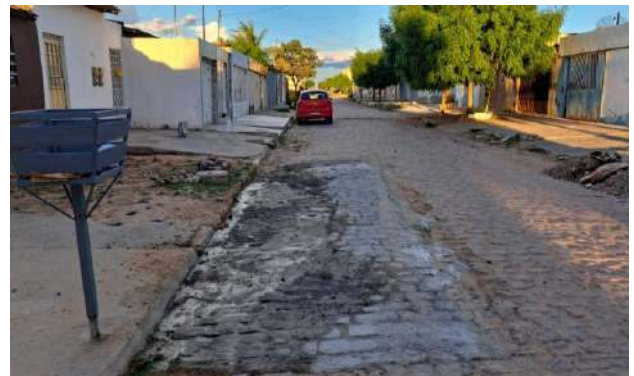
RUA PEROVAZ - MAN. PAVIMENTO PARALELEPÍPEDO