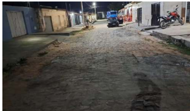
RUA PEROVAZ - MAN. PAVIMENTO PARALELEPÍPEDO