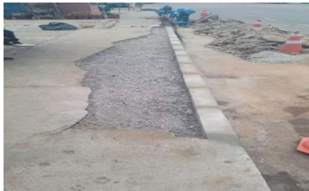
AV OSCAR RIBEIRO - ASSENTAMENTO DE MEIO FIO