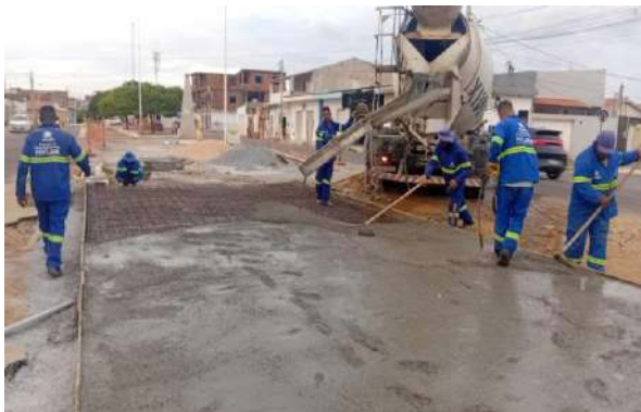
AV LUIS INÁCIO - CONCRETO ARMADO LAJE