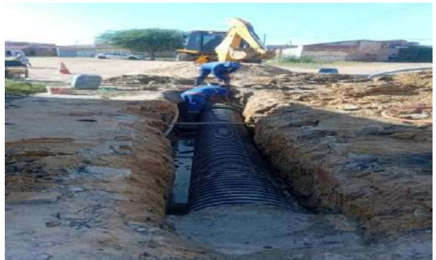
AV MIGUEL SILVA - ASSENTAMENTO DE TUBO 450MM