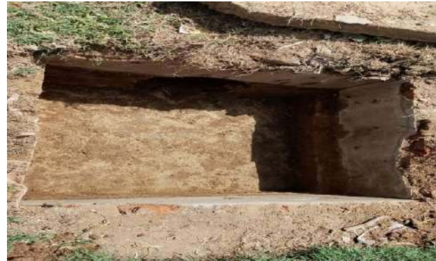
TRAVESSA DA VERDADE - DESOBSTRUÇÃO DE CAIXAS