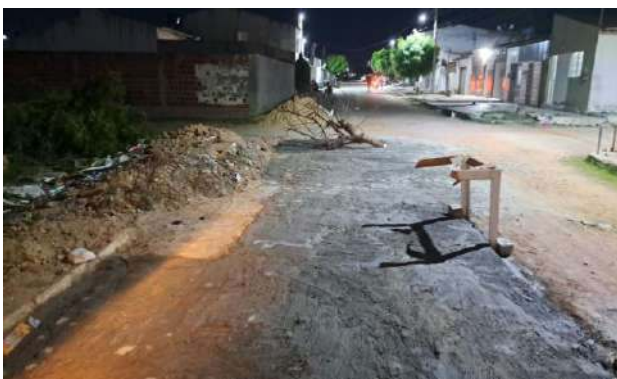
RUA PEROVAZ - MANUTENÇÃO PAV PARALELEPÍPEDO