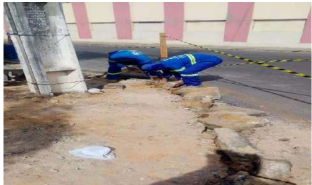
PRAÇA PEDRO PRIMO - DEMOLIÇÃO DE MEIO FIO