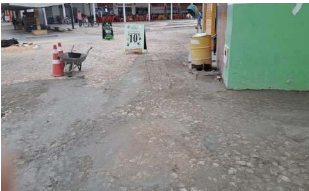
PRAÇA PEDRO PRIMO - MAN. PAV. PEDRA PORTUGUESA