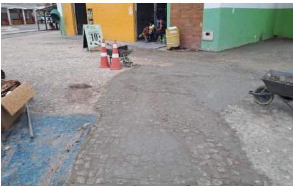
PRAÇA PEDRO PRIMO - MAN. PAV. PEDRA PORTUGUESA