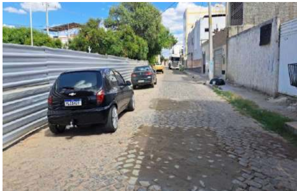
MANUT. PAV. PARALELEPÍPEDO - R HEMENEGILDO