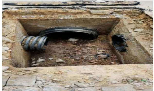
R SEBASTIÃO ALMEIDA - DESOBSTRUÇÃO DE CAIXAS