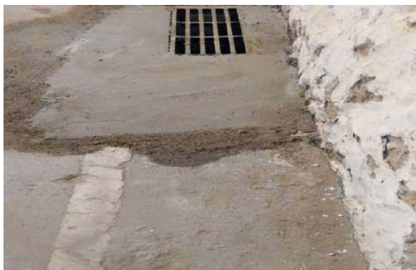
RUA JOSÉ PETITINGA - GRELHA DE FERRO ARTICULADA