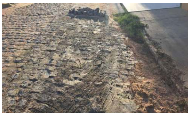
MANUT. PAV. PARALELEPÍPEDO - RUA H e RUA G