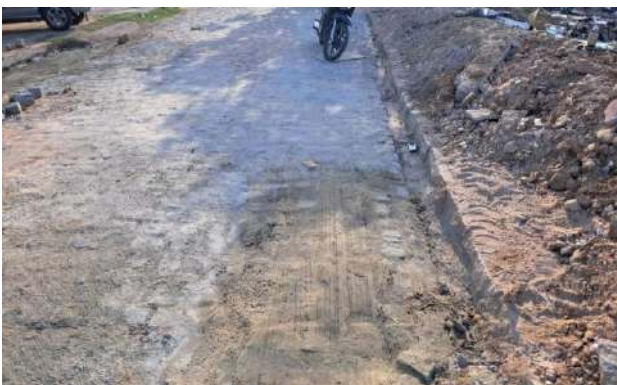
RUA PEROVAZ - MANUTENÇÃO PAV PARALELEPÍPEDO