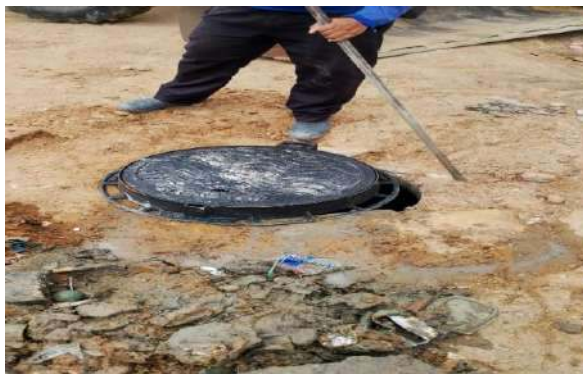
RES. SÃO FRANCISCO - TAMPÃO REDONDO ARTICULADO