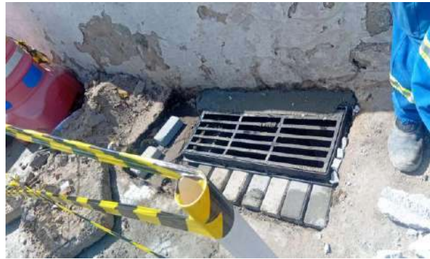
RUA DO PARAÍSO - GRELHA ARTICULADA DE FERRO