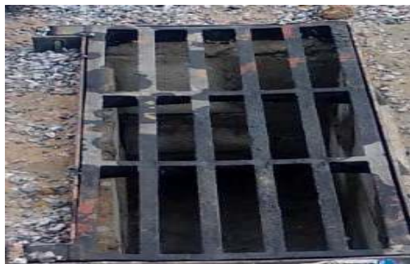
RUA JOSÉ PETITINGA - GRELHA DE FERRO ARTICULADA