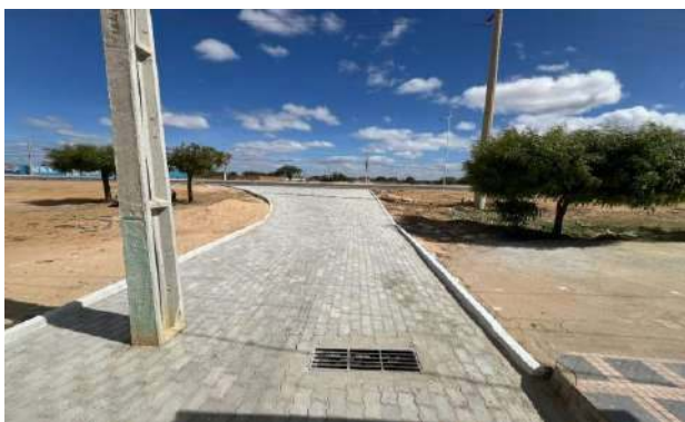
BA210 - MANUTENÇÃO PAV INTERTRAVADO