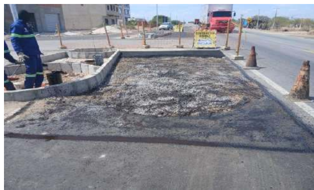
CARNAÍBA DO SERTÃO - MAN. PAVIMENTO ASFÁLTICO