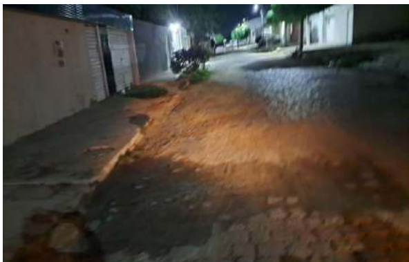
RUA PEROVAZ - MANUTENÇÃO PAV PARALELEPÍPEDO