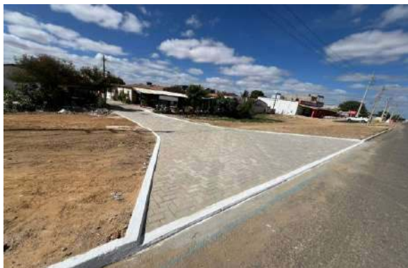
BA210 - MANUTENÇÃO PAV INTERTRAVADO