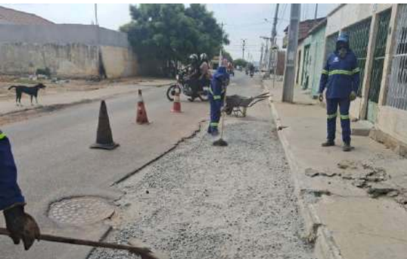
AV CRISTALINA - MAN. PAVIMENTO ASFÁLTICO