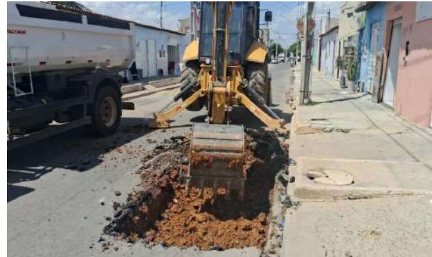
AV GIRASSOL - ESCAVAÇÃO MECANIZADA