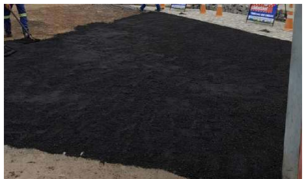
AV EDÉSIO SANTOS - MAN. PAVIMENTO ASFÁLTICO