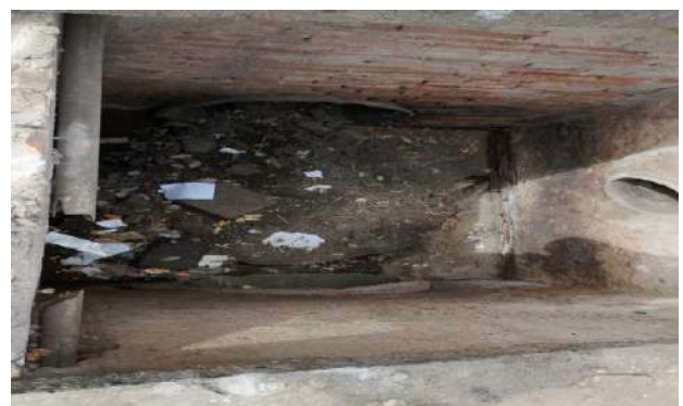
CEASA - DESOBSTRUÇÃO DE CAIXAS