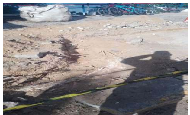
AV CARMELA DUTRA - ESCAVAÇÃO MANUAL