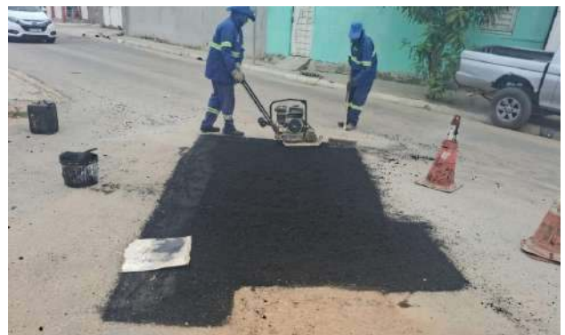
AV IRMÃ DULCE - MAN. PAVIMENTO ASFÁLTICO