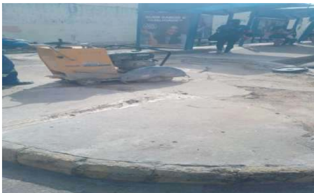
AV OSCAR RIBEIRO - CORTE DE PASSEIO