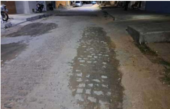
RUA PEROVAZ - MAN. PAVIMENTO PARALELEPÍPEDO