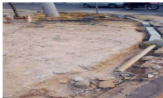
PRAÇA PEDRO PRIMO - ASSENTAMENTO DE MEIO FIO