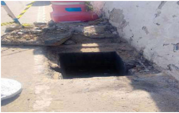
RUA DO PARAÍSO - GRELHA ARTICULADA DE FERRO