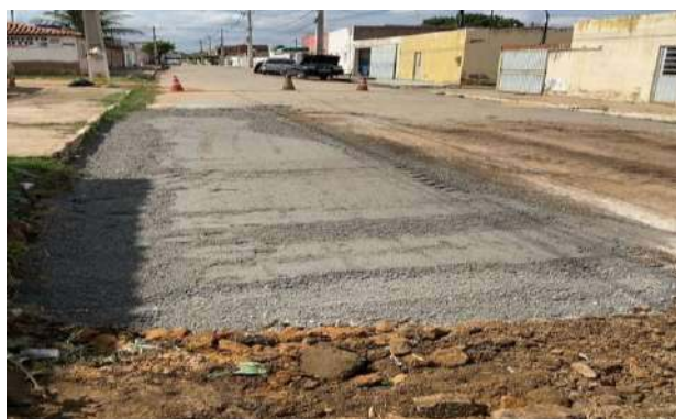
AV EDÉSIO SANTOS - BRITA GRADUADA SIMPLES