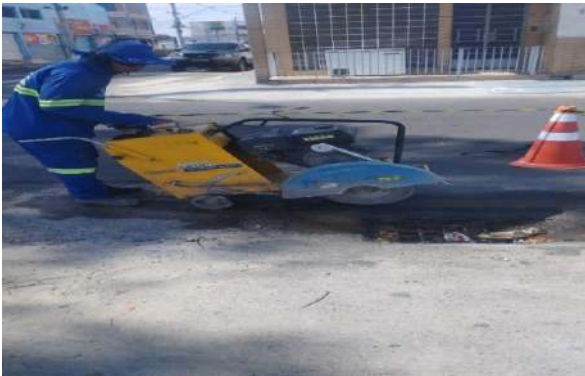
AV CARMELA DUTRA - CORTE DE ASFALTO