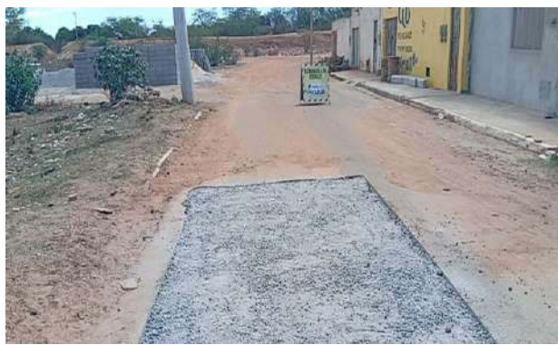
AV EDÉSIO SANTOS - BRITA GRADUADA SIMPLES