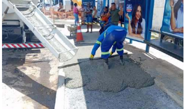
AV OSCAR RIBEIRO - CONCRETO USINADO