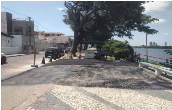
AV CARMELA DUTRA - MANUTENÇÃO PAV ASFALTO