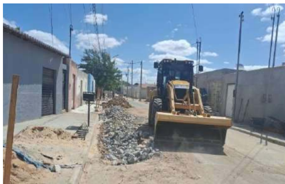
AV GIRASSOL - REFORÇO SUB LEITO