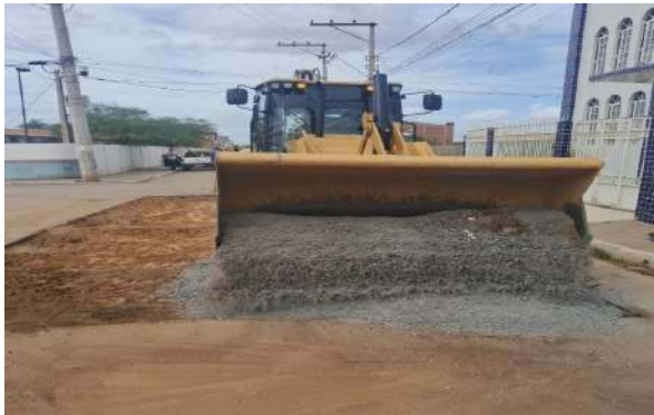
AV EDÉSIO SANTOS - MAN. PAVIMENTO ASFÁLTICO