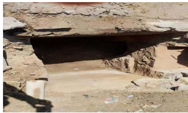
AV CRISTALINA - DESOBSTRUÇÃO DE CAIXAS