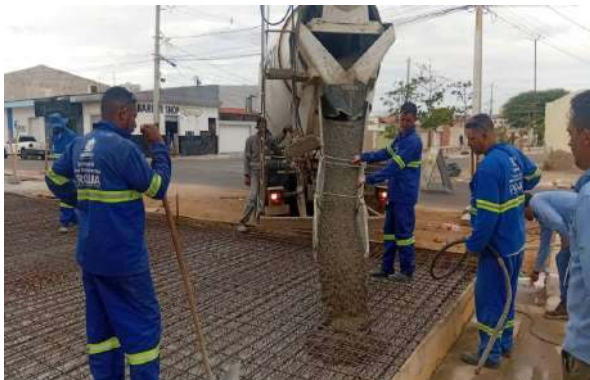
AV LUIS INÁCIO - CONCRETO ARMADO LAJE