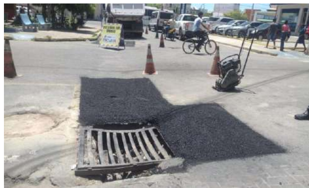
AV OSCAR RIBEIRO - MAN. PAVIMENTO ASFÁLTICO