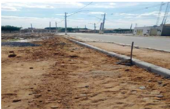
CARNAÍBA DO SERTÃO - ASSENTAMENTO DE MEIO FIO