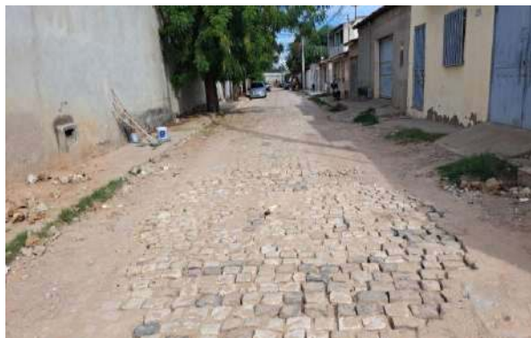
MANUTEN. PAV. PALELEPÍPEDO - RUA RIO DE JANEIRO