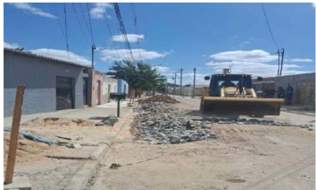
AV GIRASSOL - REFORÇO DE SUBLEITO