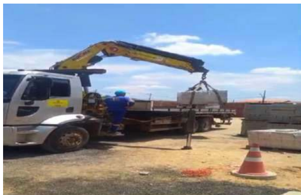
DOM JOSÉ RODRIGUES - SERVIÇO DE MUNCK