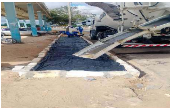
CARNAÍBA DO SERTÃO - LONA PARA CONCRETO