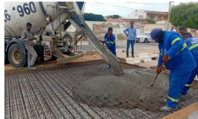
AV LUIS INÁCIO - CONCRETO ARMADO LAJE