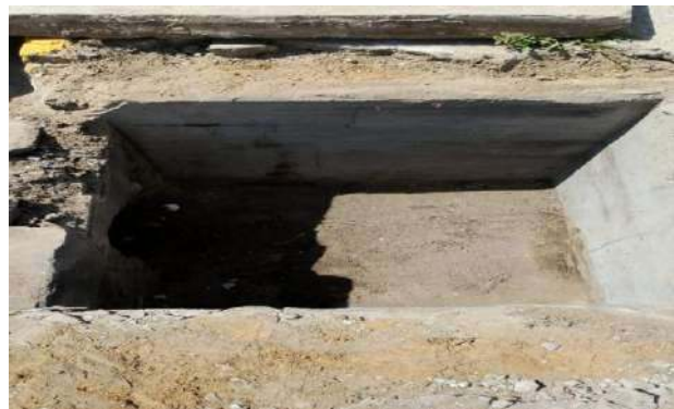
RUA DA PAZ - DESOBSTRUÇÃO DE CAIXAS