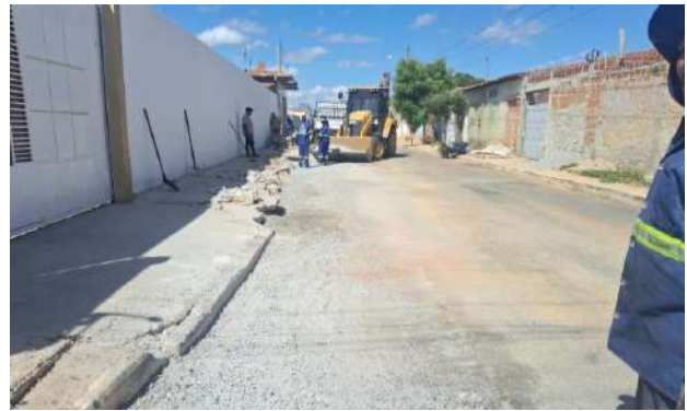
AV CRISTALINA - BRITA GRADUADA SIMPLES