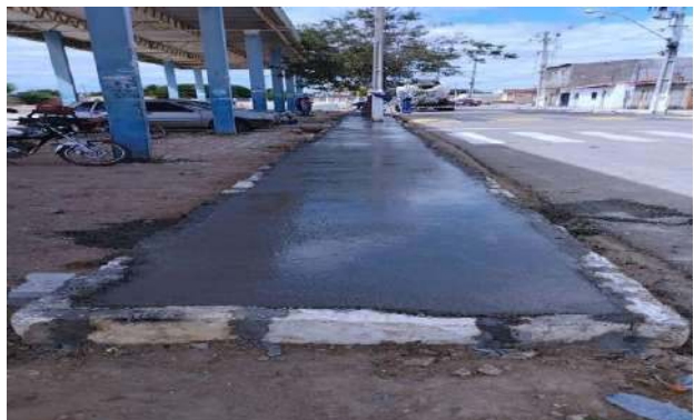
CARNAÍBA DO SERTÃO - CONCRETO USINADO