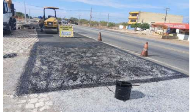
CARNAÍBA DO SERTÃO - MAN. PAVIMENTO ASFÁLTICO