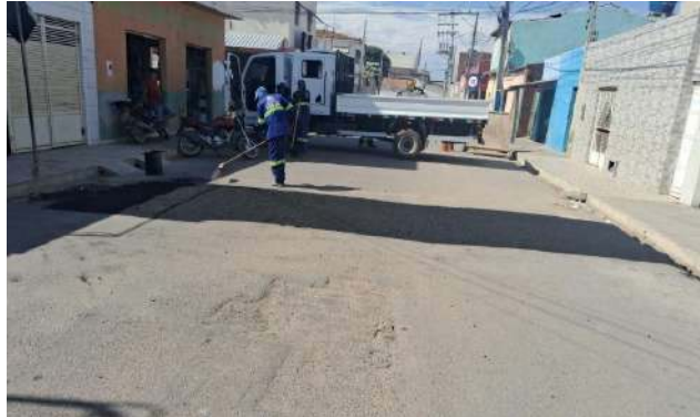
AV CRISTALINA - BRITA GRADUADA SIMPLES