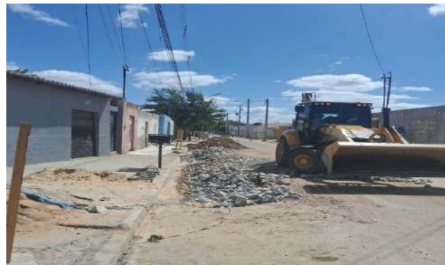
AV GIRASSOL - REFORÇO SUB LEITO