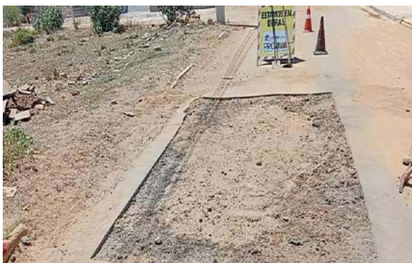
AV EDÉSIO SANTOS - MAN. PAVIMENTO ASFÁLTICO