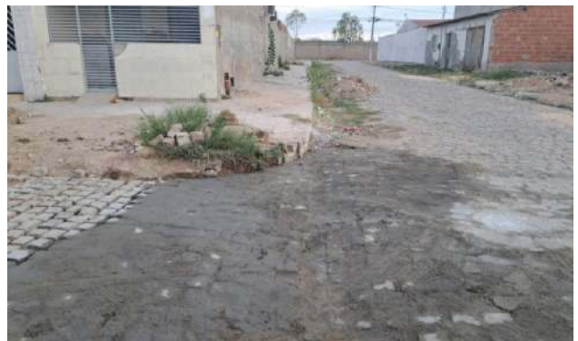
TRAV HILDETE LAMANTO - MAN. PAV. PARALELEPÍPEDO