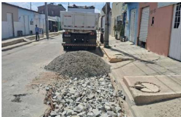
AV GIRASSOL - BRITA GRADUADA SIMPLES