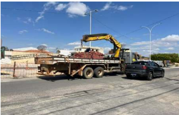
AV LUIS INÁCIO - SERVIÇO DE MUNCK