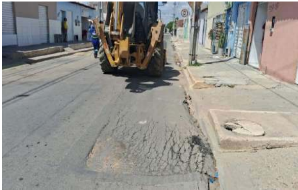
AV GIRASSOL - MAN. PAVIMENTO ASFÁLTICO