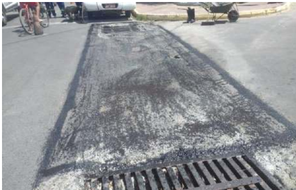
AV OSCAR RIBEIRO - MAN. PAVIMENTO ASFÁLTICO