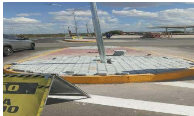
CARNAÍBA DO SERTÃO - MAN. PAV. INTERTRAVADO