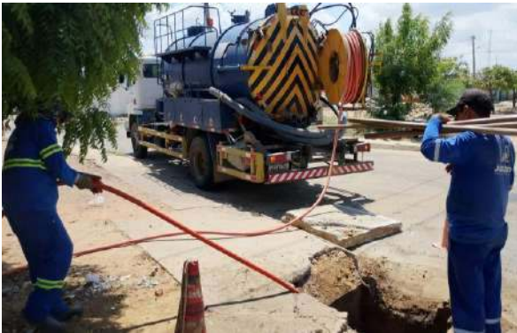
AV CRISTALINA - SERVIÇO DE SEWERJET