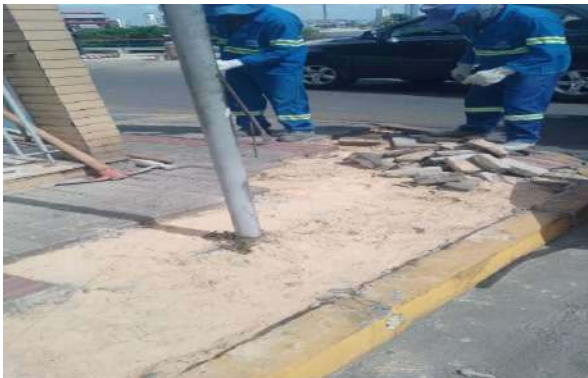
AV CARMELA DUTRA - AJUSTE MEIO FIO