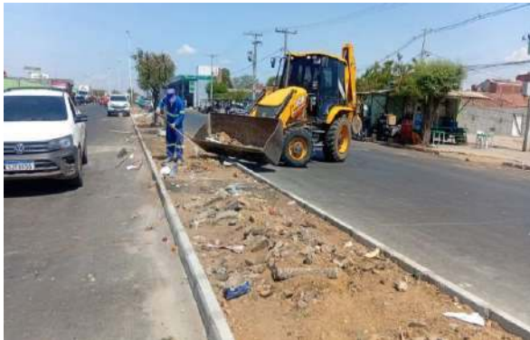
CEASA - BOTA FORA