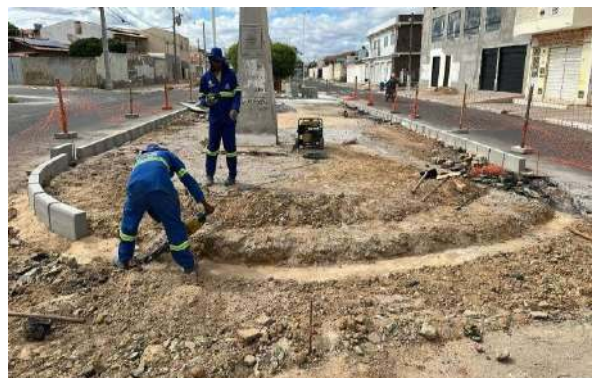
AV LUIZ INÁCIO - ESCAVAÇÃO MANUAL