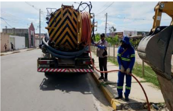
AV PEDRA DO LORD - SERVIÇO DE SEWERKET