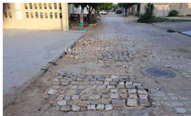
MANUTEN. PAV. PALELEPÍPEDO - RUA RIO DE JANEIRO