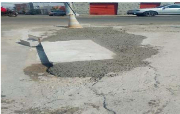
RUA DO COLISEU - TAMPA DE CONCRETO ARMADO