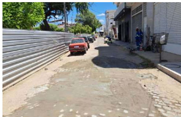
MANUT. PAV. PARALELEPÍPEDO - R HEMENEGILDO