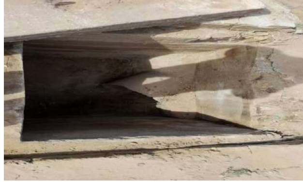
AV CRISTALINA - DESOBSTRUÇÃO DE CAIXAS