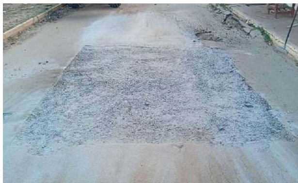
AV EDÉSIO SANTOS - BRITA GRADUADA SIMPLES