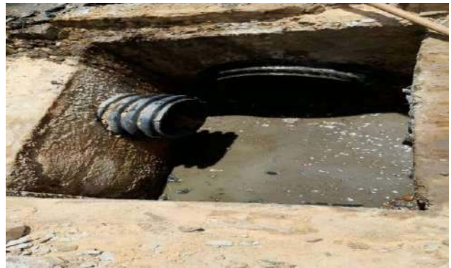
R SEBASTIÃO ALMEIDA - DESOBSTRUÇÃO DE CAIXAS