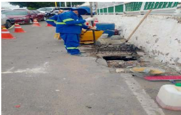
RUA JOSÉ PETITINGA - GRELHA DE FERRO ARTICULADA