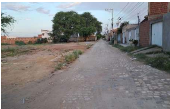
MANUTEN. PAV. PALELEPÍPEDO - RUA RIO DE JANEIRO