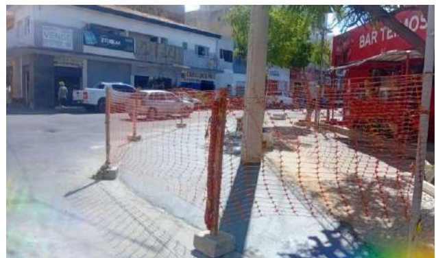
PRAÇA PEDRO PRIMO - ISOLAMENTO DE ÁREA