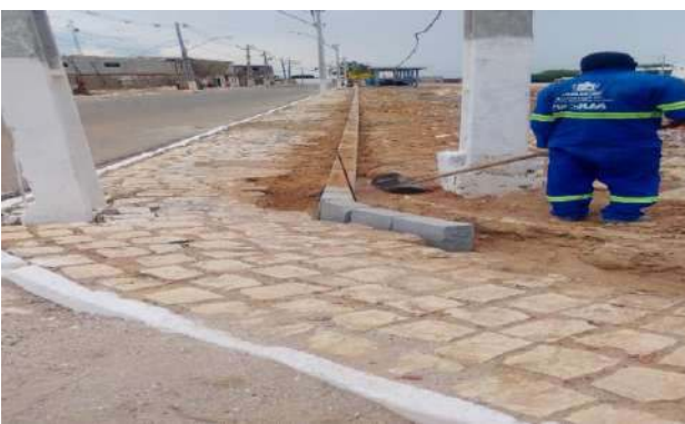
CARNAÍBA DO SERTÃO - MEIO FIO