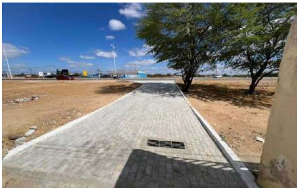
BA210 - MANUTENÇÃO PAV INTERTRAVADO