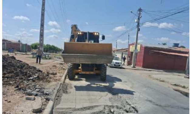
AV CRISTALINA - ESCAVAÇÃO MECANIZADA