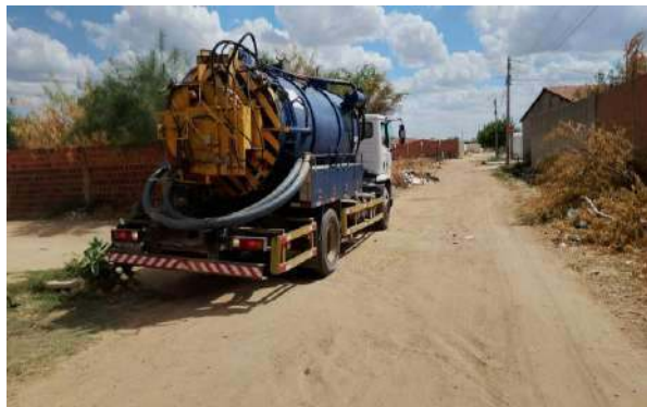
AV MALHADA DA AREIA - SERVIÇO DE SEWERKET