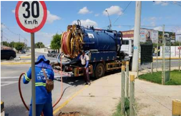
AV PEDRA DO LORD - SERVIÇO DE SEWERKET