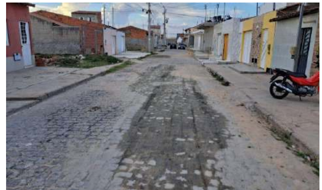
R BENTO GONÇALVES - MAN. PAV. PARALELEPÍPEDO