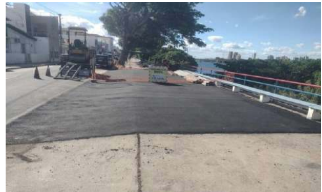
AV CARMELA DUTRA - MANUTENÇÃO PAV ASFALTO