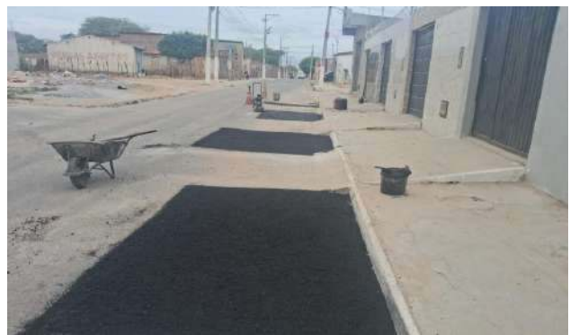
AV IRMÃ DULCE - MAN. PAVIMENTO ASFÁLTICO