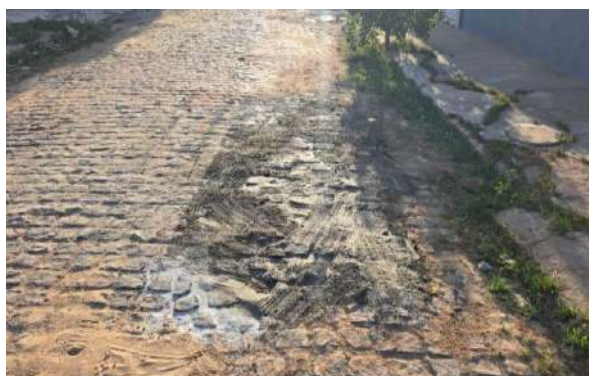
MANUT. PAV. PARALELEPÍPEDO - RUA H e RUA G