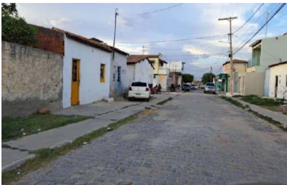
R MARQUES DE BARBACENA - MAN. PAV. PARALELEPÍPEDO