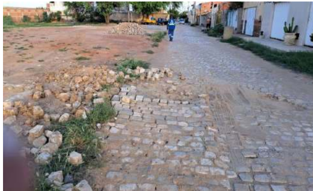
MANUTEN. PAV. PALELEPÍPEDO - RUA RIO DE JANEIRO