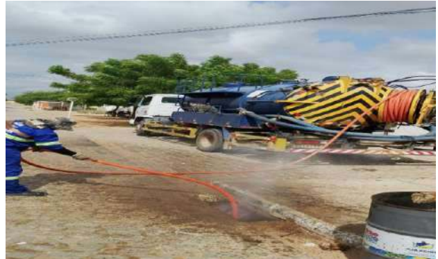
RES. SÃO FRANCISCO - SEWERJET