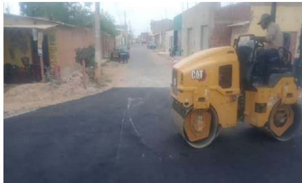
R JOSÉ ANCHEITA - MAN. PAVIMENTO ASFÁLTICO