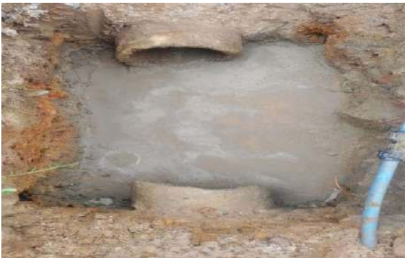
TRAV. FRANCISCO MARTINS - CONCRETO SIMPLES