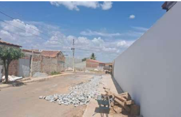
R DAS ALGAROBAS - REFORÇO SUB-LEITO