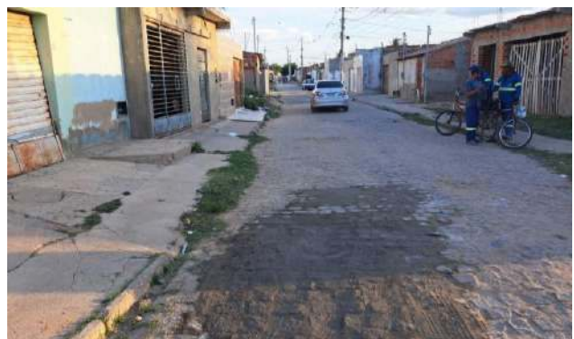
R BENTO GONÇALVES - MAN. PAV. PARALELEPÍPEDO