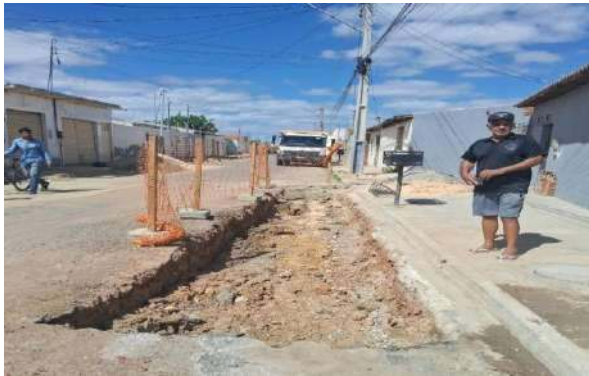
AV GIRASSOL - ESCAVAÇÃO MECANIZADA