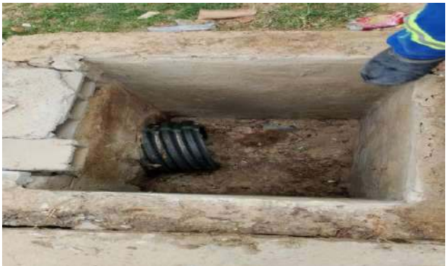
R SEBASTIÃO ALMEIDA - DESOBSTRUÇÃO DE CAIXAS