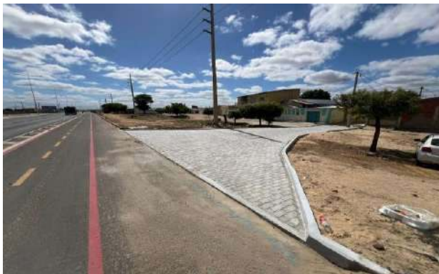
BA210 - MANUTENÇÃO PAV INTERTRAVADO