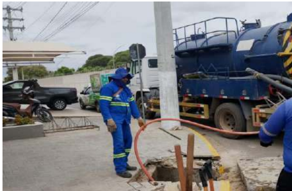
AV GIRASSOL - SERVIÇO DE SEWERJET