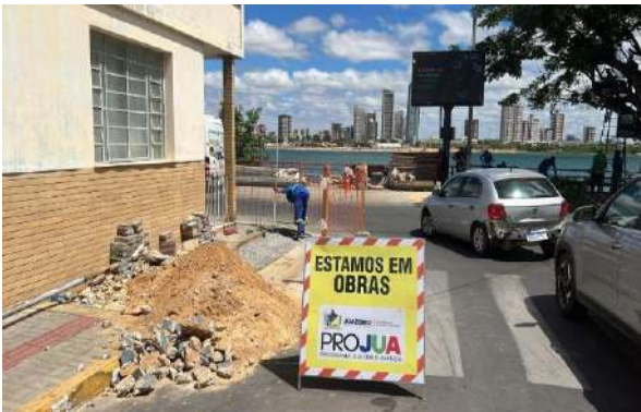
AV CARMELA DUTRA - SINALIZAÇÃO