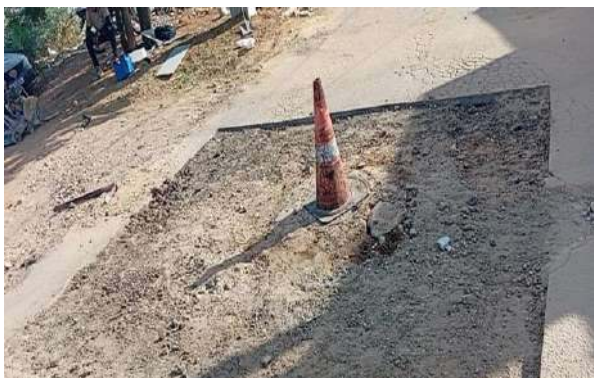
AV EDÉSIO SANTOS - MAN. PAVIMENTO ASFÁLTICO