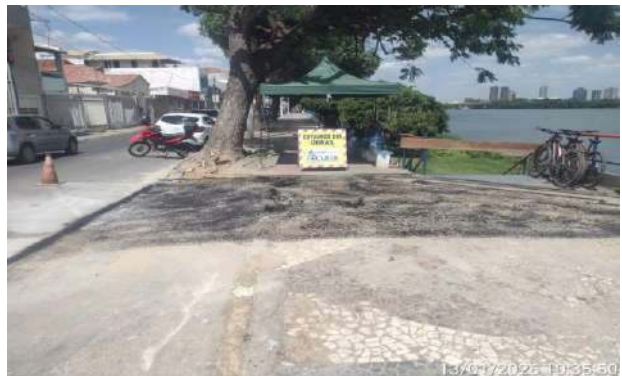
AV CARMELA DUTRA - MANUTENÇÃO PAV ASFALTO