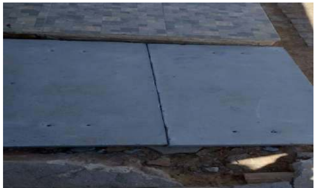
AV GIRASSOL - INSTALAÇÃO TAMPAS DE CONCRETO