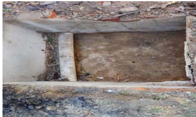
AV MALHADA DA AREIA - DESOBSTRUÇÃO DE CAIXAS