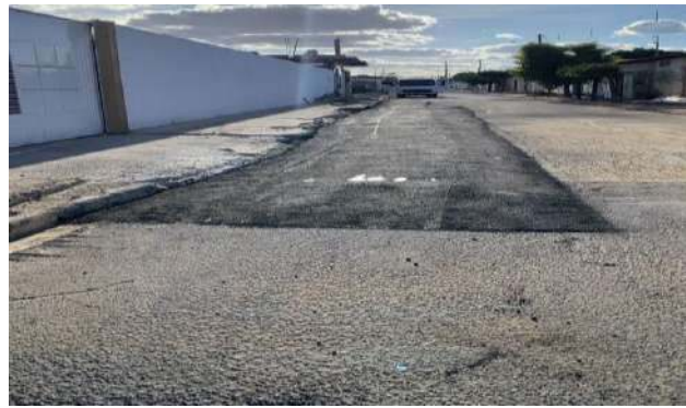
AV CRISTALINA - MANUTENÇÃO PAV ASFALTO