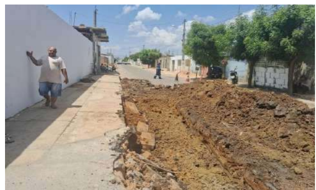
R DAS ALGAROBAS - ESCAVAÇÃO MECANIZADA