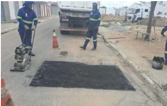
AV IRMÃ DULCE - MAN. PAVIMENTO ASFÁLTICO