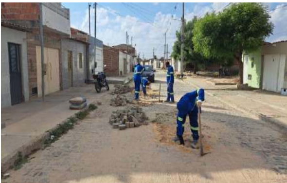
R BENTO GONÇALVES - MAN. PAV. PARALELEPÍPEDO