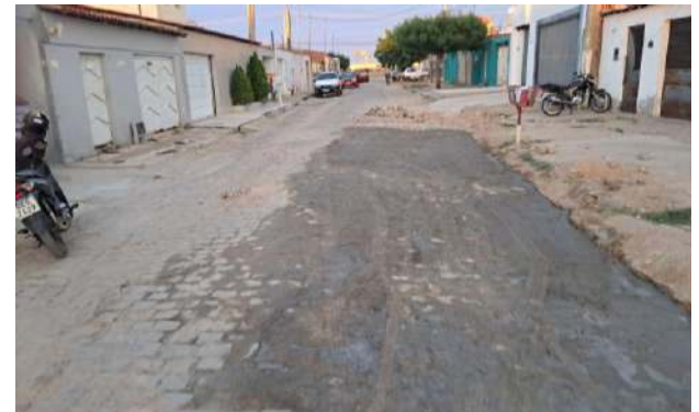
TRAV HILDETE LAMANTO - MAN. PAV. PARALELEPÍPEDO