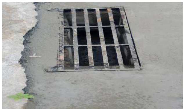
TRAV. FRANCISCO MARTINS - INSTALAÇÃO DE GRELHA