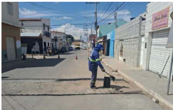
AV CRISTALINA - BRITA GRADUADA SIMPLES