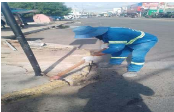
AV OSCAR RIBEIRO - DEMOLIÇÃO DE PISO