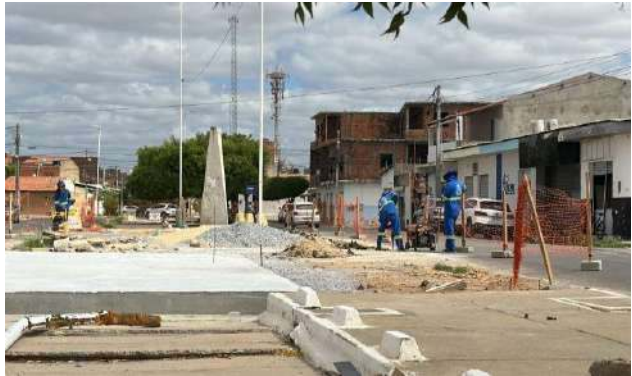
AV LUIS INÁCIO - DEMOLIÇÃO ASFÁLTICA