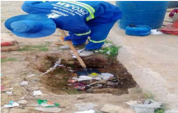
TRAV. FRANCISCO MARTINS - DESOBSTRUÇÃO DE CAIXA