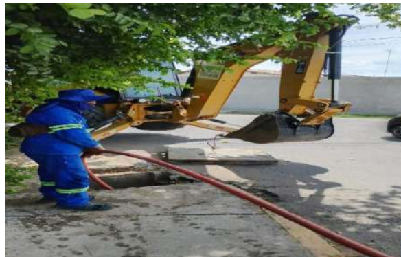
AV PEDRA DO LORD - SERVIÇO DE SEWERKET