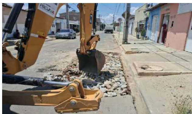
AV GIRASSOL - REFORÇO SUB LEITO