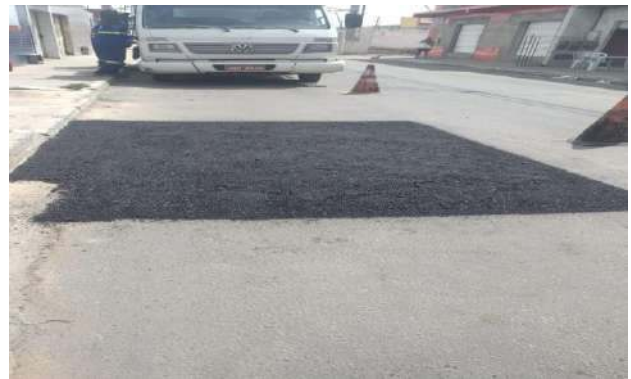
AV GIRASSOL - MAN. PAVIMENTO ASFÁLTICO