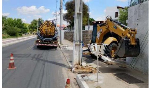
R SEVERO - DESOBSTRUÇÃO DE CAIXAS