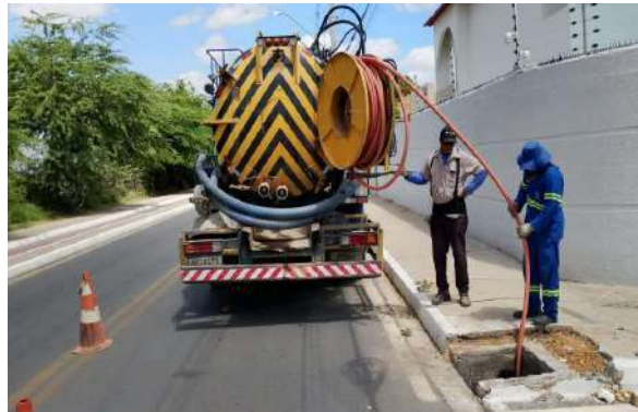
R SEVERO - SERVIÇO DE SEWERKET