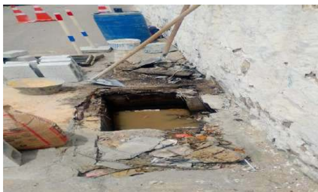
RUA JOSÉ PETITINGA - GRELHA DE FERRO ARTICULADA