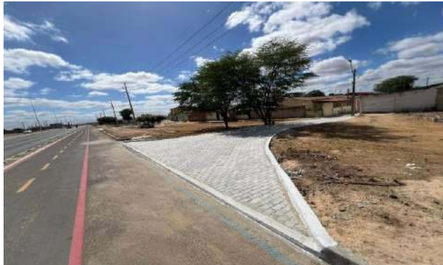
BA210 - MANUTENÇÃO PAV INTERTRAVADO