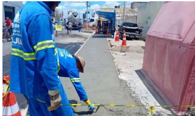
AV OSCAR RIBEIRO - CONCRETO USINADO