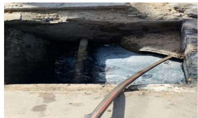
RUA DA PAZ - DESOBSTRUÇÃO DE CAIXAS