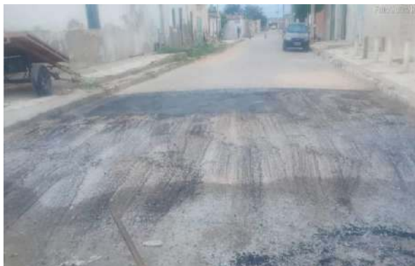
R JOSÉ ANCHEITA - MAN. PAVIMENTO ASFÁLTICO