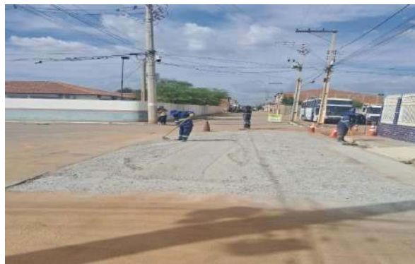
AV EDÉSIO SANTOS - MAN. PAVIMENTO ASFÁLTICO