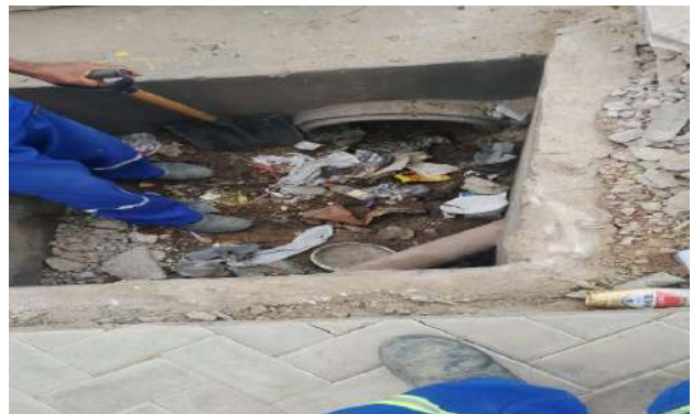
AV GIRASSOL - DESOBSTRUÇÃO DE CAIXAS