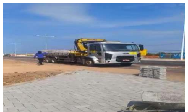
DOM JOSÉ RODRIGUES - SERVIÇO DE MUNCK