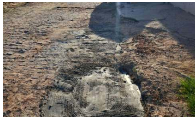
MANUT. PAV. PARALELEPÍPEDO - RUA H e RUA G