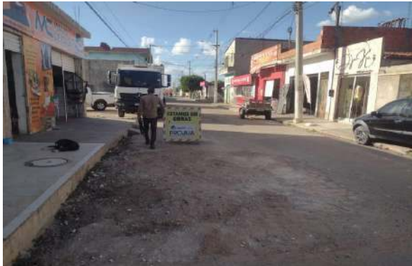
AV SÃO FRANCISCO - MAN. PAV ASFÁLTICO