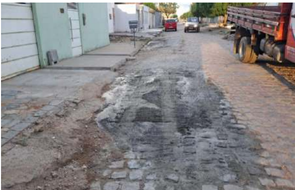
RUA PEROVAZ - MAN. PAVIMENTO PARALELEPÍPEDO