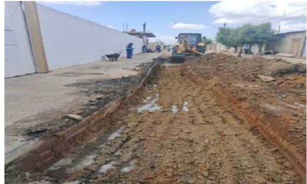
R DAS ALGAROBAS - ESCAVAÇÃO MECANIZADA