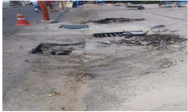
AV CARMELA DUTRA - DESOBSTRUÇÃO DE CAIXAS