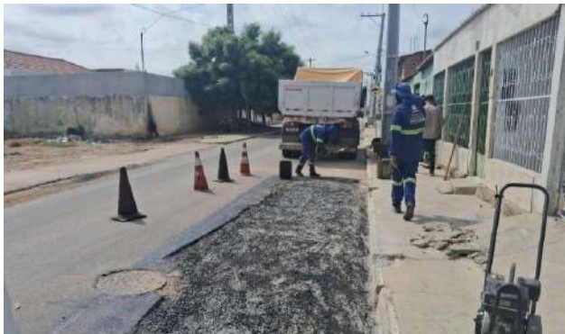
AV CRISTALINA - MAN. PAVIMENTO ASFÁLTICO