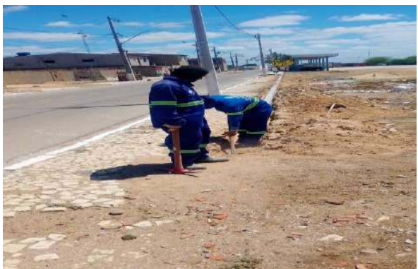
CARNAÍBA DO SERTÃO - MEIO FIO