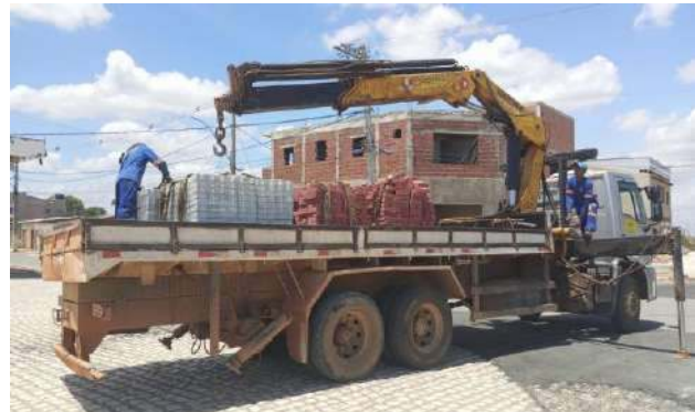
CARNAÍBA DO SERTÃO - SERVIÇO DE MUNCCK