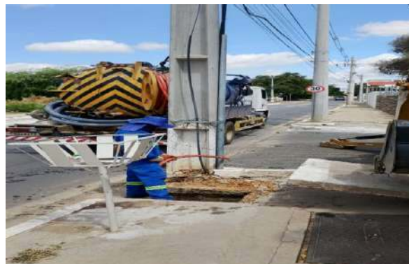
R SEVERO - SERVIÇO DE SEWERKET