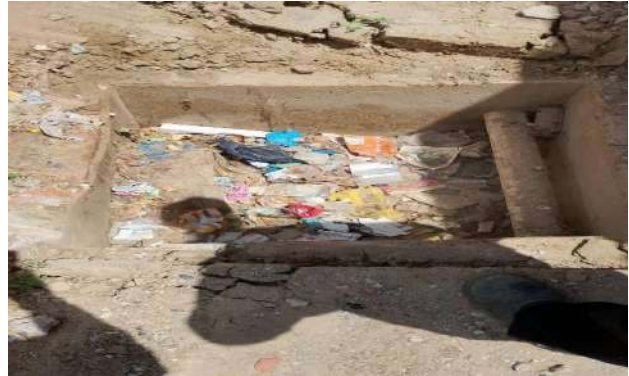
TRAVESSA DA VERDADE - DESOBSTRUÇÃO DE CAIXAS