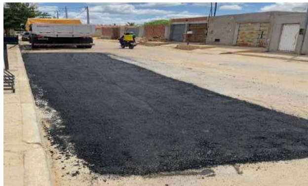
AV GIRASSOL - MANUTENÇÃO PAV ASFÁLTICO