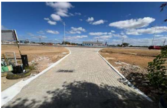
BA210 - MANUTENÇÃO PAV INTERTRAVADO