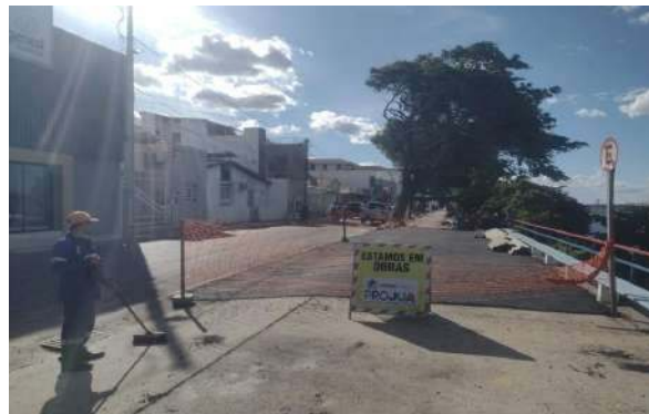
AV CARMELA DUTRA - MANUTENÇÃO PAV ASFALTO