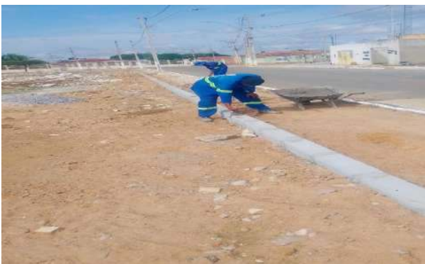
CARNAÍBA DO SERTÃO - MEIO FIO