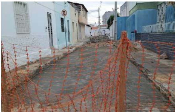
TRAV HILDETE LAMANTO - MAN. PAV. PARALELEPÍPEDO