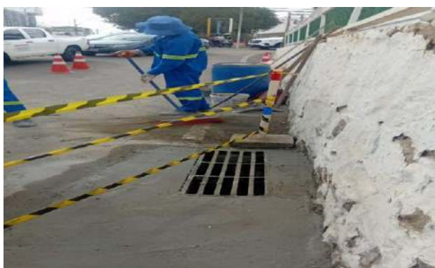
TRAV. FRANCISCO MARTINS - INSTALAÇÃO DE GRELHA