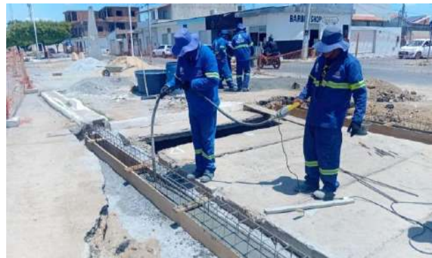
AV LUIS INÁCIO - CONCRETO ARMADO