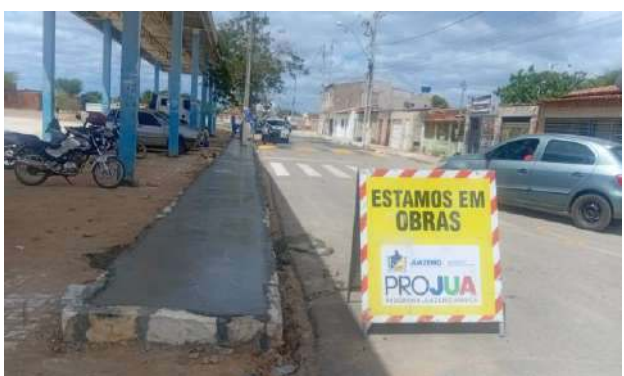
CARNAÍBA DO SERTÃO - CONCRETO USINADO