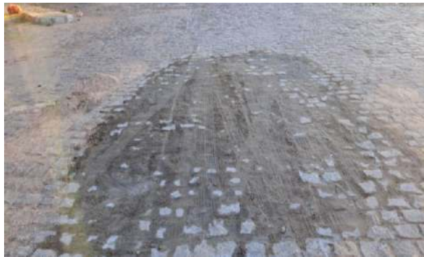
MANUT. PAV. PARALELEPÍPEDO - RUA H e RUA G