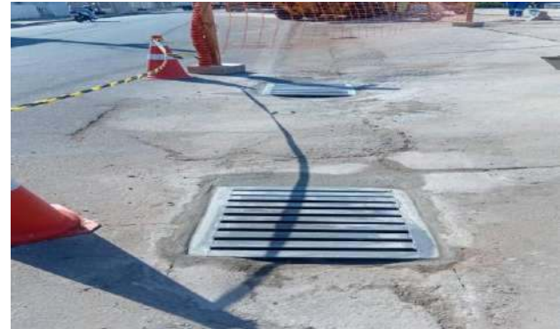
AV CARMELA DUTRA - GRELHAS DE FERRO