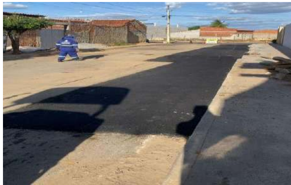
AV CRISTALINA - MANUTENÇÃO PAV ASFALTO