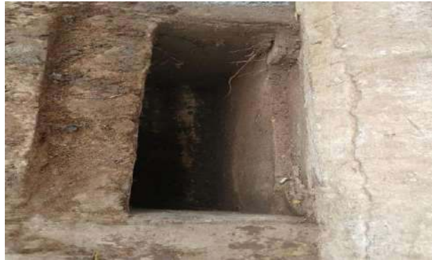
RES. SÃO FRANCISCO - DESOBSTRUÇÃO DE CAIXA