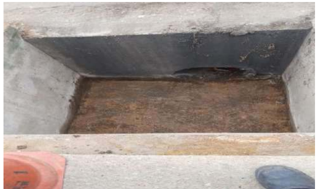
AV GIRASSOL - DESOBSTRUÇÃO DE CAIXAS