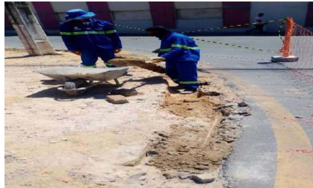
PRAÇA PEDRO PRIMO - ESCAVAÇÃO MANUAL