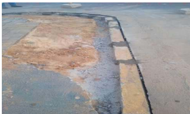
AV CARMELA DUTRA - AJUSTE DE MEIO FIO