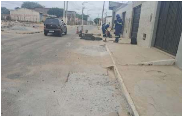
AV IRMÃ DULCE - MAN. PAVIMENTO ASFÁLTICO