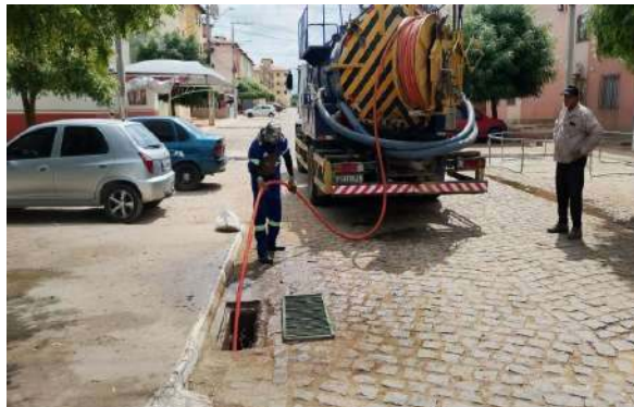
RES. SÃO FRANCISCO - SEWERJET