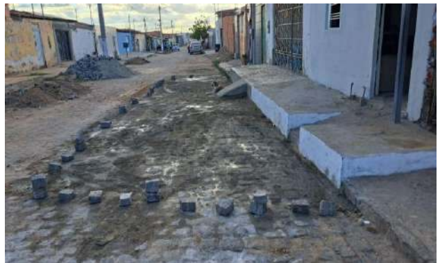
RUA PEROVAZ - MAN. PAVIMENTO PARALELEPÍPEDO