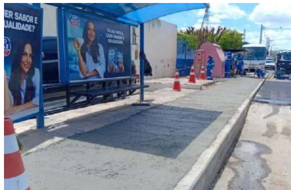
AV OSCAR RIBEIRO - CONCRETO USINADO