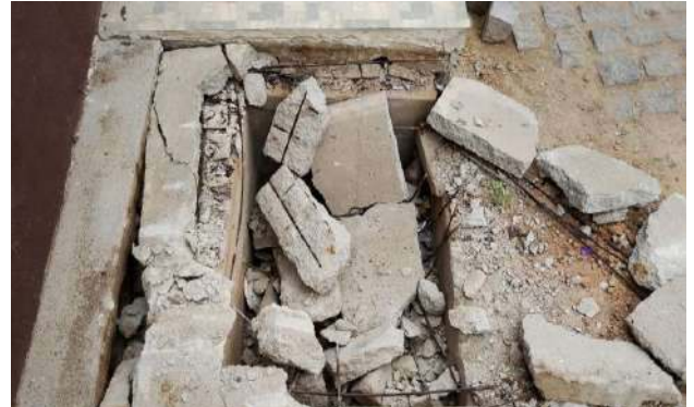
AV PEDRA DO LORD - DESOBSTRUÇÃO DE CAIXAS