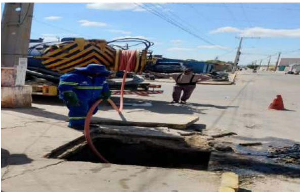
RUA DA PAZ - SERVIÇO DE SEWERKET