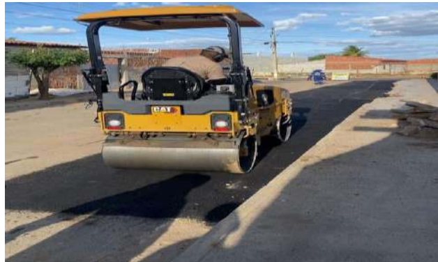
AV CRISTALINA - MANUTENÇÃO PAV ASFALTO