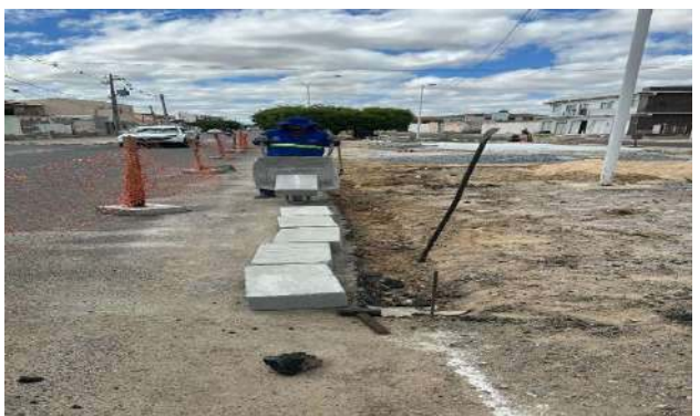
AV LUIS INÁCIO - ESCAVAÇÃO MANUAL