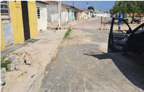
R MARQUES DE BARBACENA - MAN. PAV. PARALELEPÍPEDO