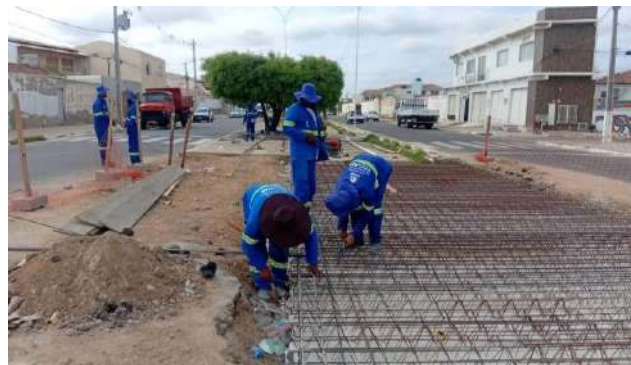
AV LUIS INÁCIO - ARMAÇÃO DA LAJE