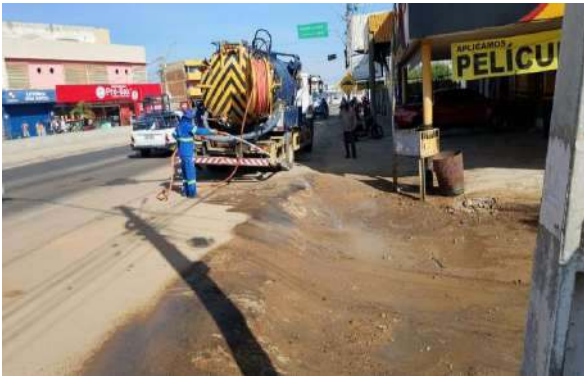
RUA DA PAZ - SERVIÇO DE SEWERKET