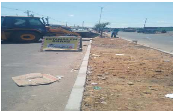
CEASA - ASSENTAMENTO DE MEIO FIO