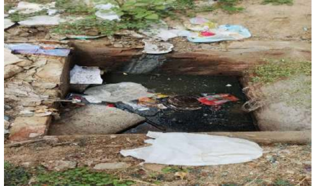
AV MALHADA DA AREIA - DESOBSTRUÇÃO DE CAIXAS