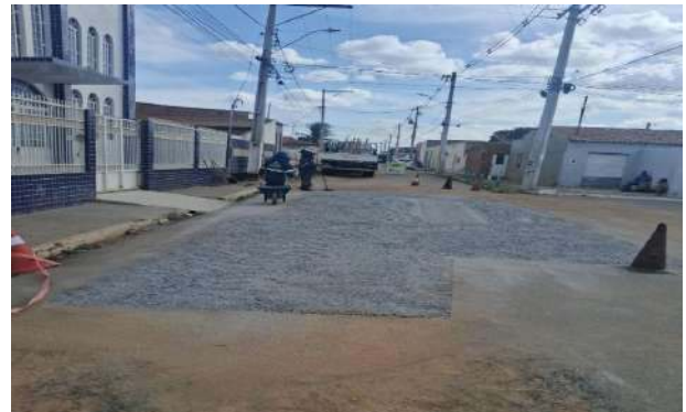
AV EDÉSIO SANTOS - BRITA GRADUADA SIMPLES