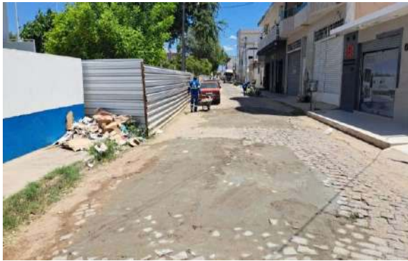
MANUT. PAV. PARALELEPÍPEDO - R HEMENEGILDO