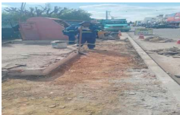
AV OSCAR RIBEIRO - REGULARIZAÇÃO DE TERRENO