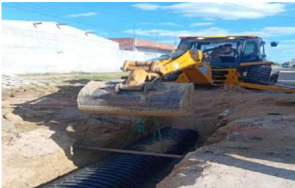
AV MIGUEL SILVA - ASSENTAMENTO DE TUBO 450MM