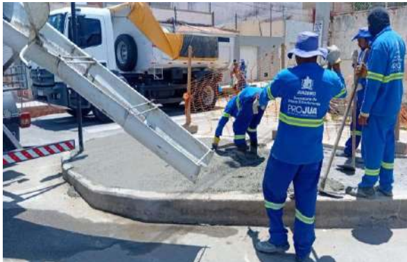
AV OSCAR RIBEIRO - CONCRETO USINADO