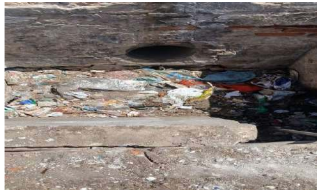
CEASA - DESOBSTRUÇÃO DE CAIXAS