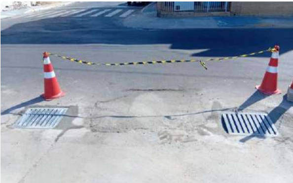
AV CARMELA DUTRA - GRELHAS DE FERRO