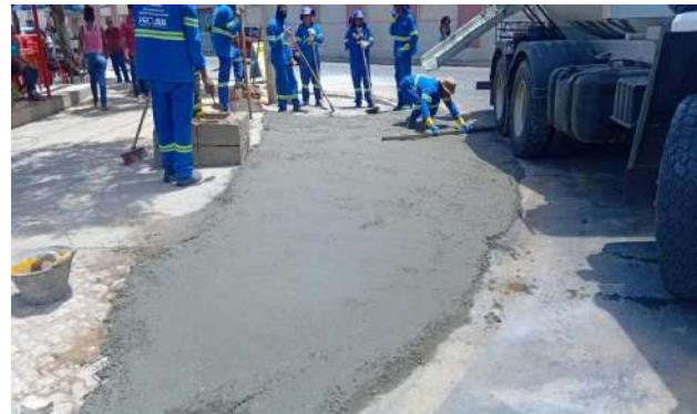
PRAÇA PEDRO PRIMO - CONCRETO USINADO