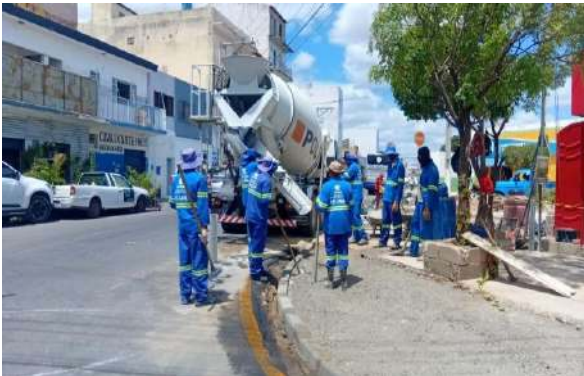
PRAÇA PEDRO PRIMO - CONCRETO USINADO