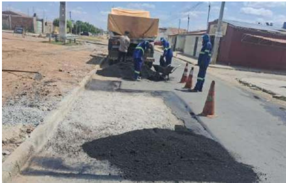
AV CRISTALINA - MAN. PAVIMENTO ASFÁLTICO