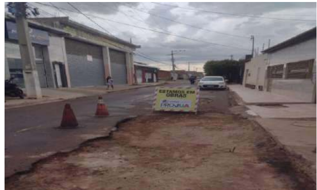
AV SÃO FRANCISCO - MAN. PAV ASFÁLTICO