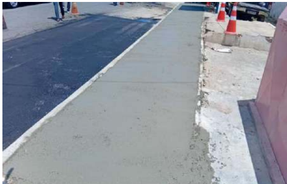
AV OSCAR RIBEIRO - CONCRETO USINADO