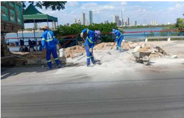
AV CARMELA DUTRA - ASSENTAMENTO DE MEIO FIO